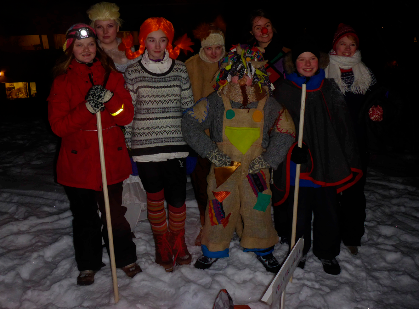
Med på arrangementet var elever fra dramalinja ved Kongsbakken videregående skole, fra teatergruppa Tiptopp på Kulta, lur-laget fra Tromsø Kulturskole, pluss mange andre frivillige fra Barnas Turlag og Troms Turlag.

17:30: Sprengkulde, sur vind eller mørke stanset ikke tøffe unger og foreldre! Over 400 deltakere ble med på eventyrsti med Barnas Turlag Tromsø. I skogen ble ungene hilst velkomne med lur-fanfarer og på sin rundtur møtte de på troll og hekser, Pippi Langstrømpe, Rødhette med en helt ekte ulv, Robin Hoods menn, Elsa fra Frost, Espen Askeladden og en klovn.