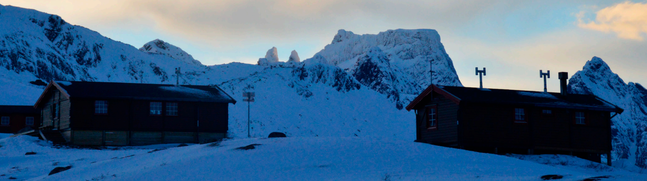
Snytindhyttene med Møysalen i bakgrunnen.

Med god drikke og turledere for anledningen pyntet i skjorte og slips ble det mer allsang, dans og annen underholdning. Ellen Marie overgikk nesten seg selv og bladde opp en krevende månequiz som svar på tilsynets etterlysning av bidrag fra Troms Turlag. Da våknet gjengens konkurranseinstinkt! Vet noen av leserne forresten hva lykantropi betyr?