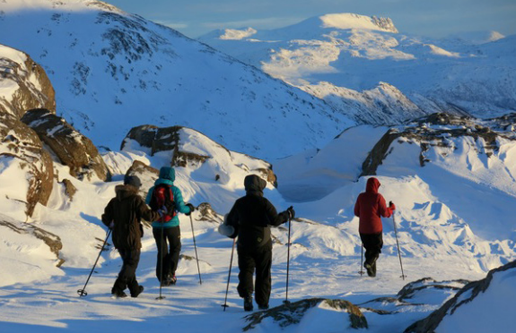
Vi fant sola!