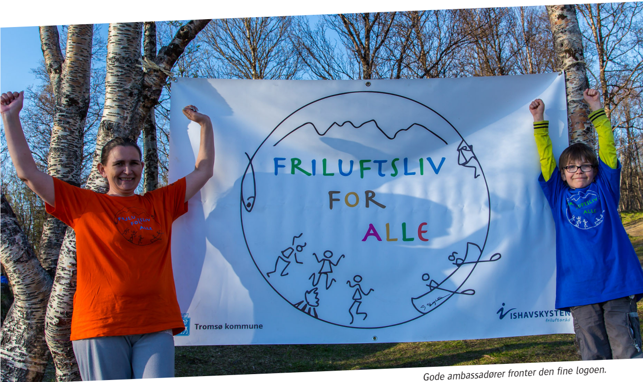
Gode ambassadører fronter den fine logoen.

Tromsø: Troms Turlag, Arctandria, Nord-norsk Vitensenter, Statens Naturoppsyn, Norsk ornitologisk Forening, Tromsø Jeger- og Fiskerforening, speiderne, Tromsø Villmarkssenter og Fløya Bueskytterne