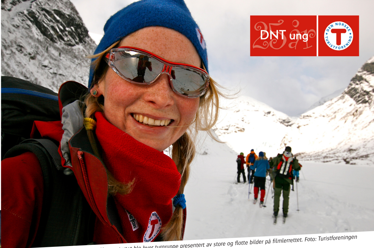
Før filmen startet ble hver turgruppe presentert av store og flotte bilder på filmlerretet.

17:00: 13. januar åpnet Tromsø Internasjonale Filmfestival sin utekino på torget. Den inspirerende filmen Bjørnøya - om de tre brødrene Wegge som drar på sitt livs eventyr - på jakt etter den perfekte bølgen ble vist, og alle medlemmer av Troms Turlag og DNT ung var spesielt inviterte!