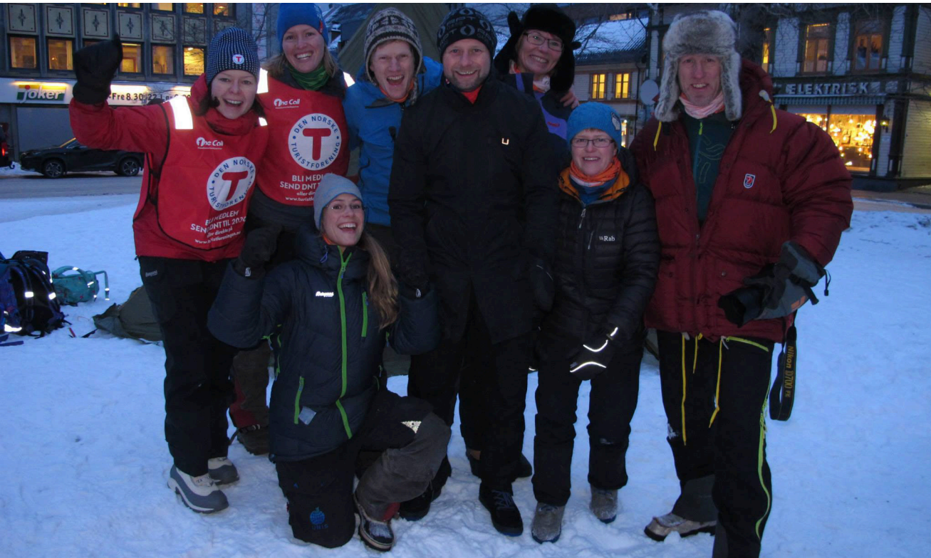
Troms Turlag var godt synlig i byen på åpningsarrangementet.

13. januar gikk startskuddet for Friluftslivets År 2015 og denne tirsdagen ble virkelig en utendørs festdag. Eventyrsti, bålcaffe, utekino, konkurranser – denne dagen skjedde det noe som kunne lokke alle og enhver ut. Her er en oversikt over åpningsarrangementene: