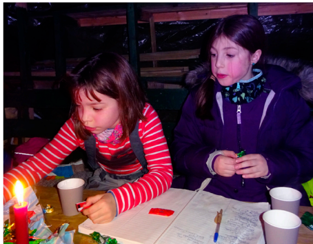
To jenter kom akkurat tidsnok til å få twist.