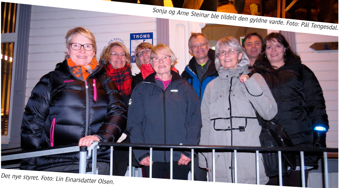
Det nye styret.

I god årsmøteånd kom det inn kommentarer til årsmeldingen, som styreleder manøvrerte greit.