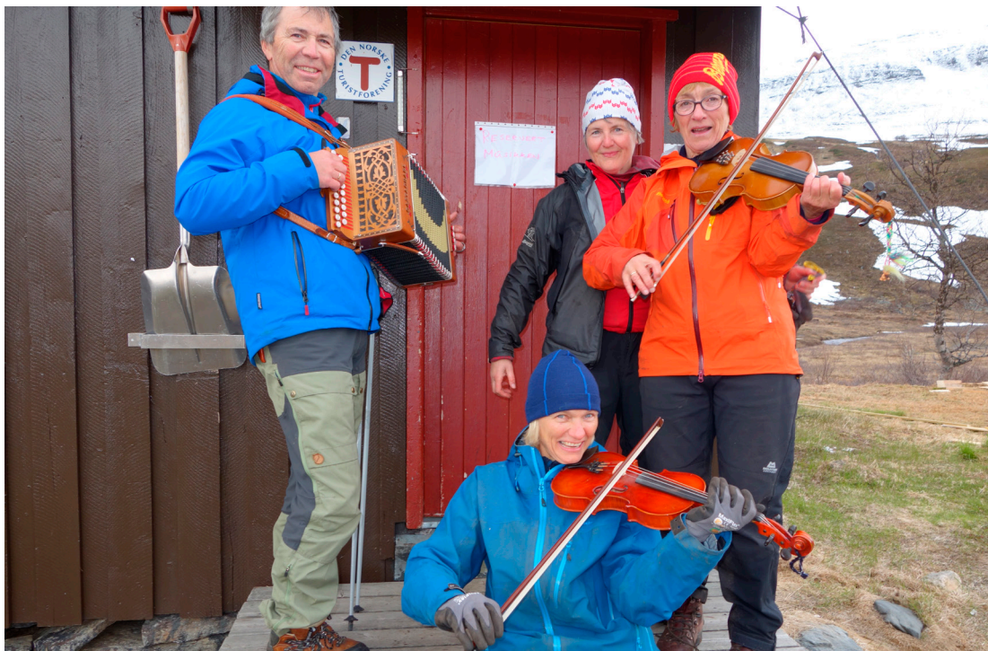
Spæll og moro på Rosta.

Øverst i Rostadalen ligger tre hytter sammen på et lite tun, og går under fellesbetegnelsen Rostahytta. Den eldste hytta blei bygd i 1964 og hadde 50-årsjubileum i 2014. Sankthanshelga hvert år blir det arrangert dugnad på hytta. Da møtes dugnadsfolket der veien slutter nederst i dalen, før vi drar med oss mat, materiale og verktøy opp de seks kilometrene det er til hytta. I år kom vi en liten gjeng litt seinere enn de andre, og hadde bare ei motorsag og bensin til å bære opp. Trodde vi.