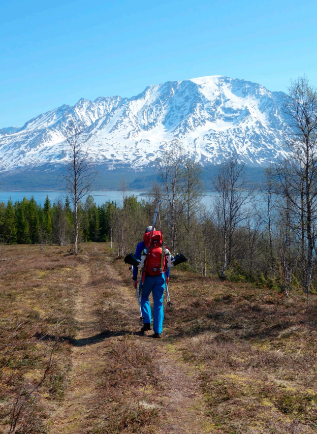
Klokka nærmer seg 11 og vi er nede i våren igjen. Fugledalsfjellet i bakgrunnen.

misunnelig. Men så ble det da en ny topp, og det er aldri feil for oss som elsker å se de vakre fjellene fra stadig nye vinkler. Pga forholdene ble det en meget forsiktig nedkjøring på ganske lett ski (Dynafit Manaslu).