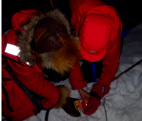
Det var umulig å tenne fakkelbokser i blåsten.