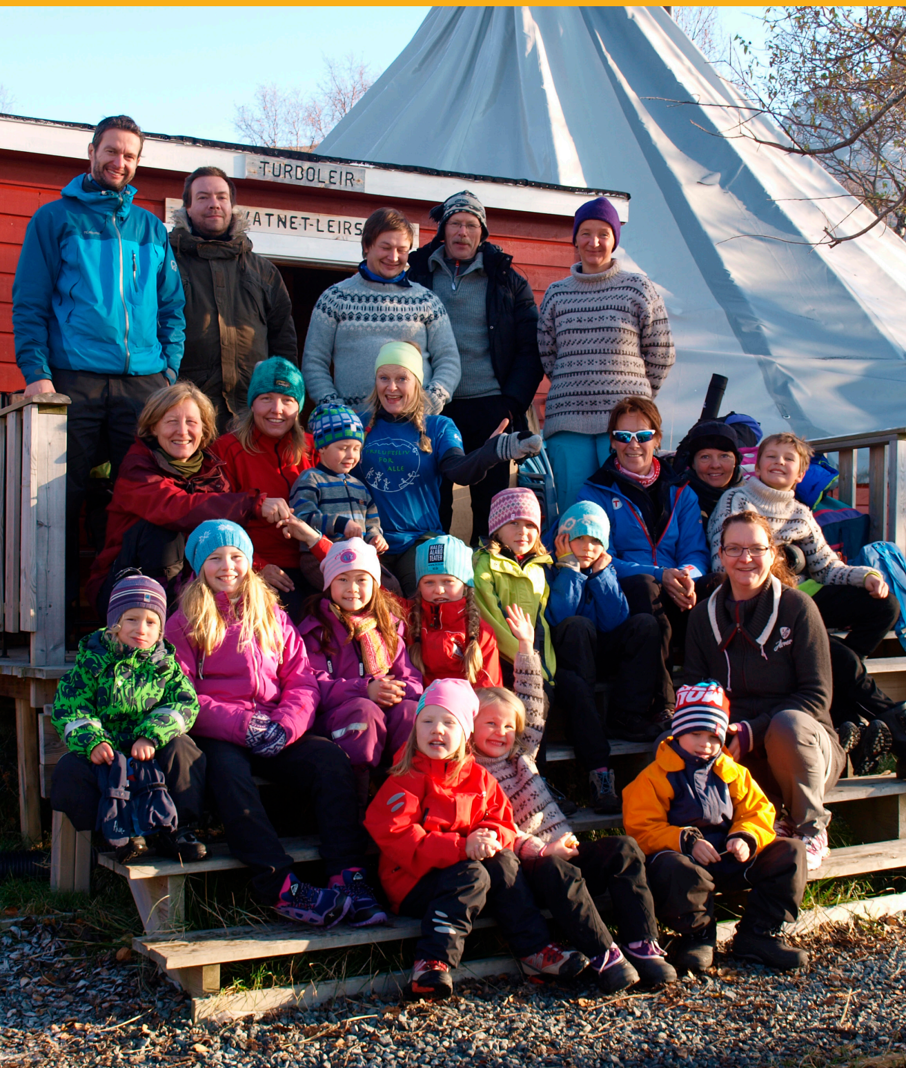
Ved Jægervatn har Barnas Turlag et fantastisk familieleirsted som du bør besøke. Hit arrangeres det helgeturer i alle årstider.