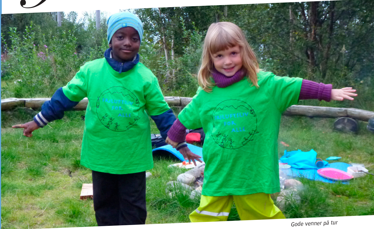
Gode venner på tur

Friluftsliv for alle ble en stor suksess i 2014. Det var mange som ble med Ishavskysten friluftsråd ut på tur, uansett vær og vind. Mange av de glade deltakerne ble gode ambassadører for prosjektet, og tok med seg venner og klassekamerater på neste arrangement. Takket være ivrige lag og foreninger arrangerer Ishavskysten friluftsråd Friluftsliv for alle i år også.