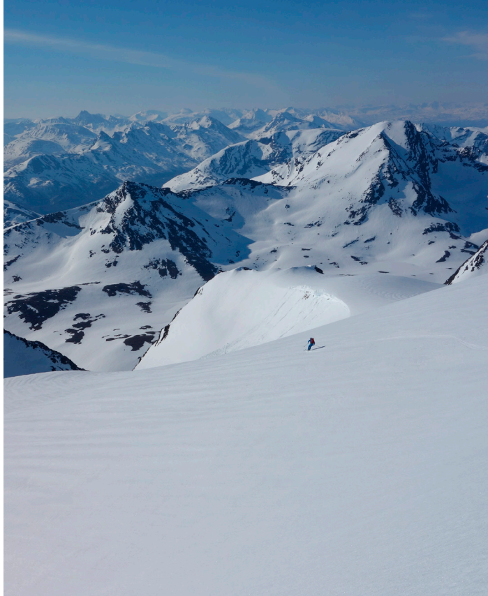
Lekker nedkjøring fra Tverrfjellet ca klokka halv ni på morran.

Men våreventyret sluttet ikke der. Mandag 2. juni var vi i gang igjen. Avmarsj såpass sent som kl 05, denne gangen med retning Ramfjorden like ved Tromsø. Hvem har ikke sett på den lekre nordflaten på fortoppen (1134) til Henriktinden 1270, innerst i Ramfjorden? Snøen smeltet raskt unna nå, det var jo