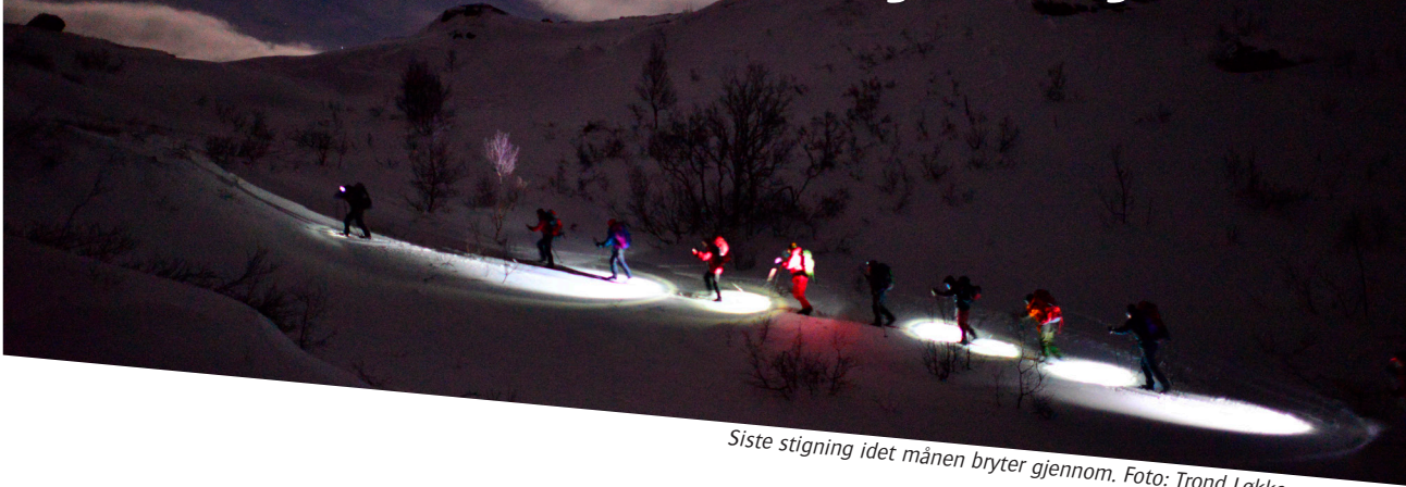
Siste stigning idet månen bryter gjennom.