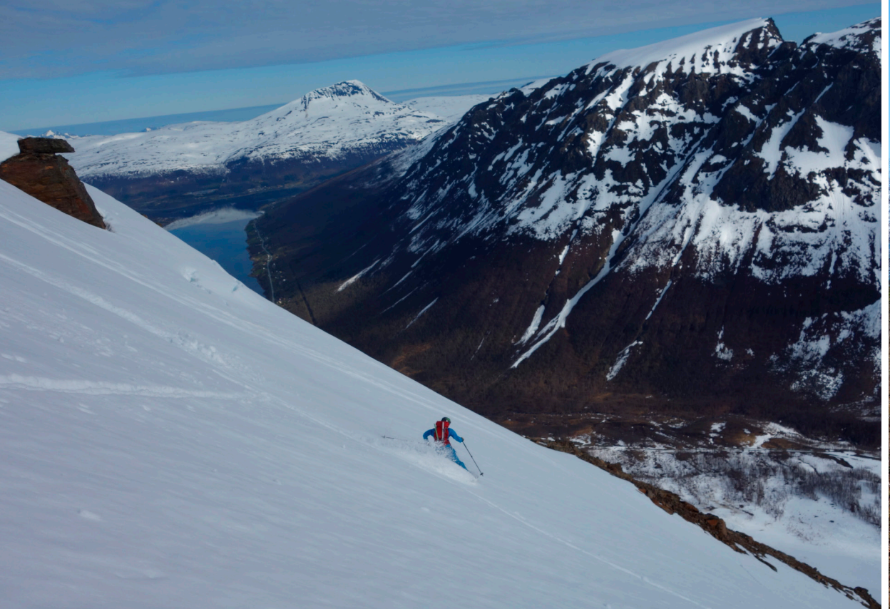
Leif nyter vårsløsj litt over 8 på morran ned fra 1134., Ramfjorden ved Tromsø. Maritinden og Tromsdalstind bak.

både på Sennedalfjellet 1395, og Tverrfjellet 1394. Og nå ble en annen fordel med alpin start ganske åpenbar; snøen bar godt, også i «lavlandet».