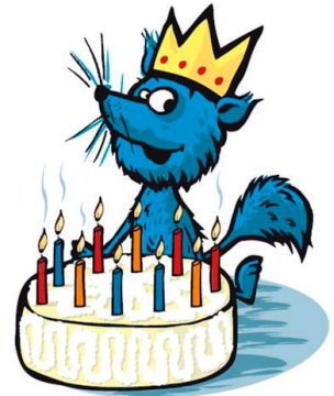
TURBO: Barnas Turlag sin maskot, Turbo, jubler for alle engasjerte foreldre og turglade unger.

Barnas Turlag sin maskot jubler, for nå har han fått små turvenner ikke bare i Tromsø, men også på Senja, i Balsfjord og i Målselv.