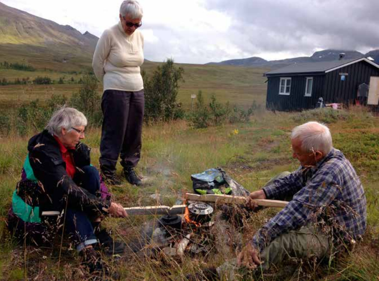
Bålcaffe ved Nonsbu

En del av ønskene fra deltakerne var «Ti på Topp»-turer. Deltakerne fikk denne pakken gratis av Idrettskretsen/Idrettsrådet. Men vi fikk også en flott mulighet til å markedsføre Troms Turlag med alle turtilbudene og hyttene vi har!