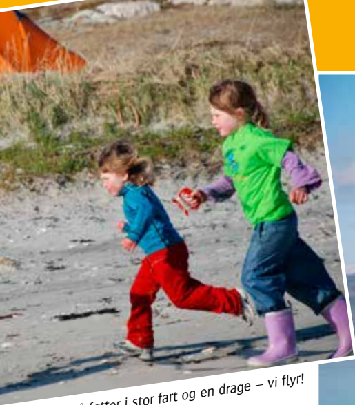
Små føtter i stor fart og en drage – vi flyr!