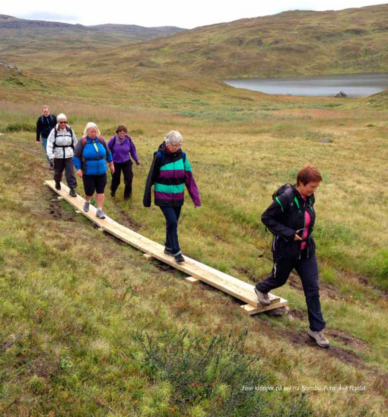
Fine klopper på vei fra Nonsbu.