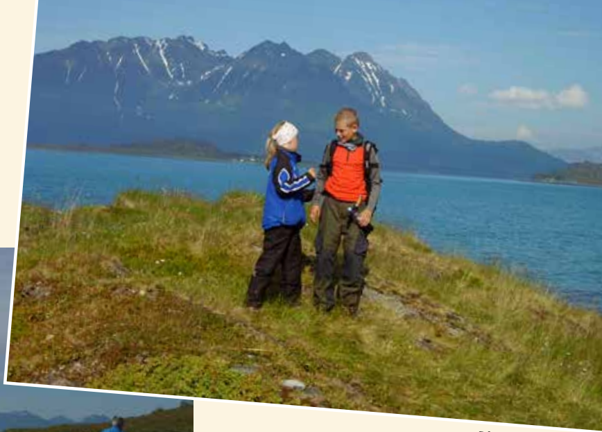
På tur i Storvik

Topptur til Uløytinden, 1114 moh. Varden ble bygget på slutten av 1800-tallet av NGO