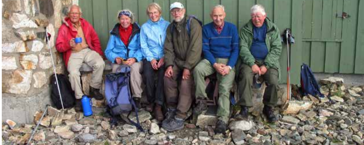
En rast på Kjølen

Troms Turlags Veterangruppe er for medlemmer av Troms Turlag fra 60+ til 90+. Vi møtes andre tirsdag i hver måned i høst/vinterhalvåret. Underholdningen kan være nye og gamle bilder fra turer medlemmene har gjennomført fra kysten til områder i indre Troms. Eller vi får noen til å holde foredrag om alt fra turer i inn- og utland til grottevandring.