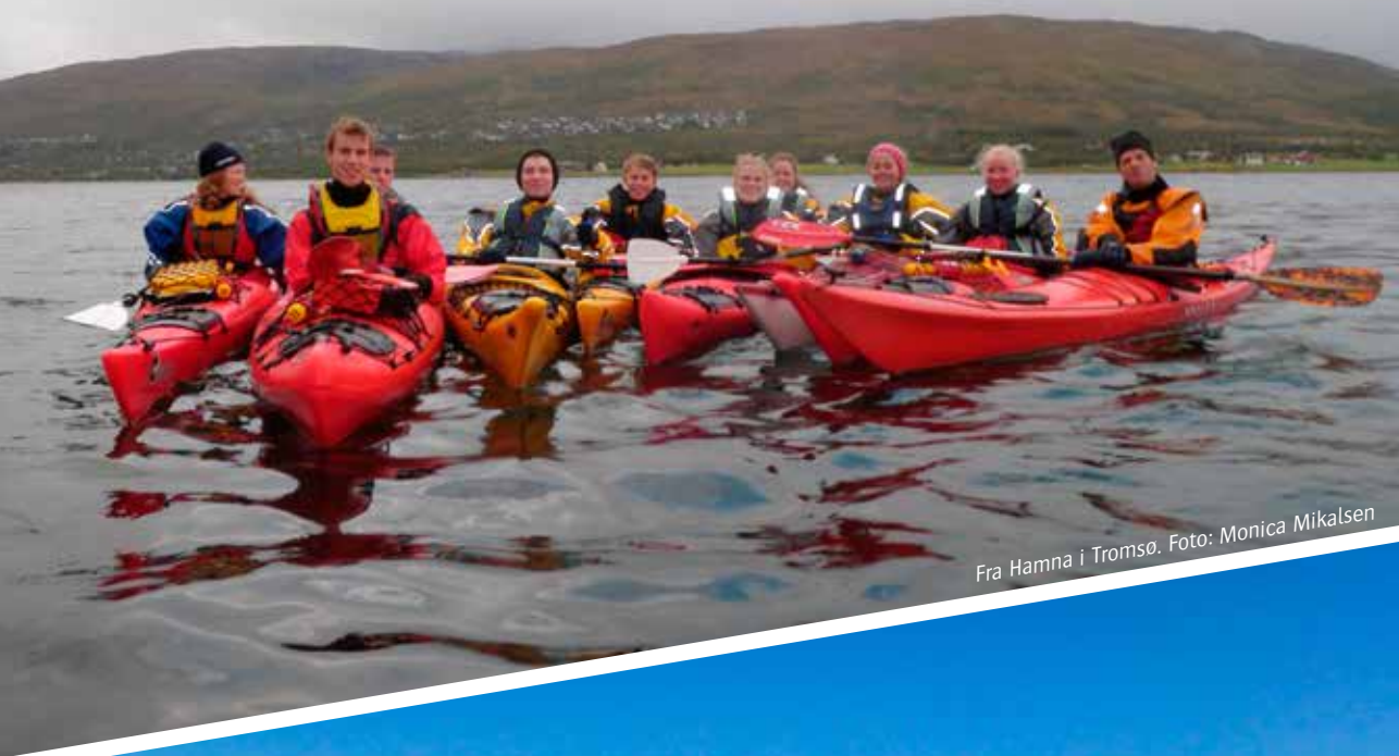
Fra Hamna i Tromsø.

DNT Ung består av ungdommer fra 16–20 år som er klare for turer og friluftaktiviteter. Om du er lysten på å bli med, sjekk ut hjemmesiden vår troms.turistforeningen.no , eller kontakt dnt.troms@gmail.com for mer informasjon.