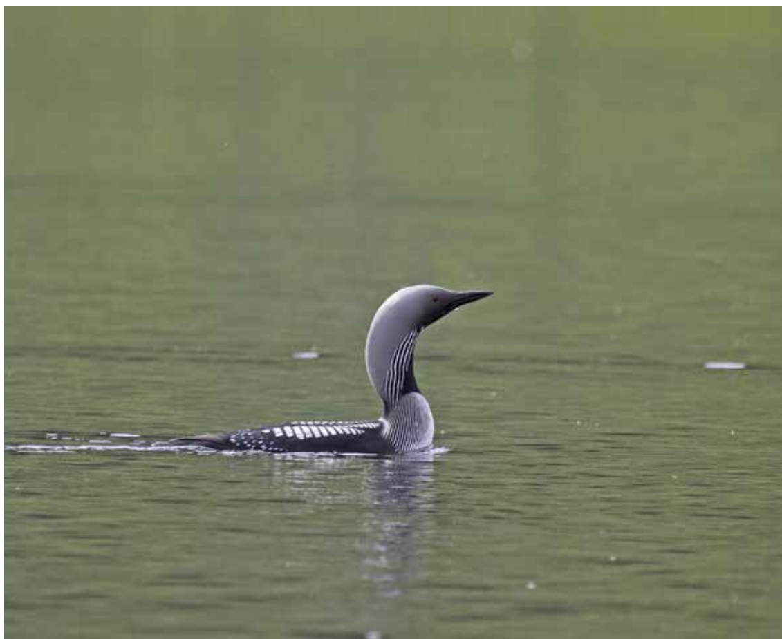
Den vakre storlomen hekker flere steder i Dividalen.

hvite og svarte fjærdrakt og karakteristiske rop markerer sin ankomst. Hannene kurtiserer hunnene og sloss nesten hele tiden. De er staselige der de svømmer rundt i råkene og løfter sine lange, flotte stjertfjær rett opp mens de stadig utstøter sine kraftige rop.