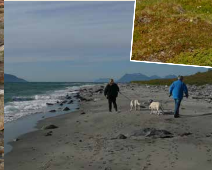
Fjæretur på Russenessanden

kulturlandskap ligger her. Gamle støer, nausttufter, rester av gangspill, murer etter hus, tufter fra steinalder. Man kan fortsatt finne åpne gressvoller etter husmannsplasser, og ildtuer mellom trær vitner om tidligere slåttemark. Dette landskapet pleies i dag av omlag 500 fastlandssauer på sommerbeite. På grunn av stor snøskredfare anbefales strekningen Havannes - Uløybukt bare i sommerhalvåret. På nord-siden av øya er det merket sti fra Klauvnesodden til Storvika.