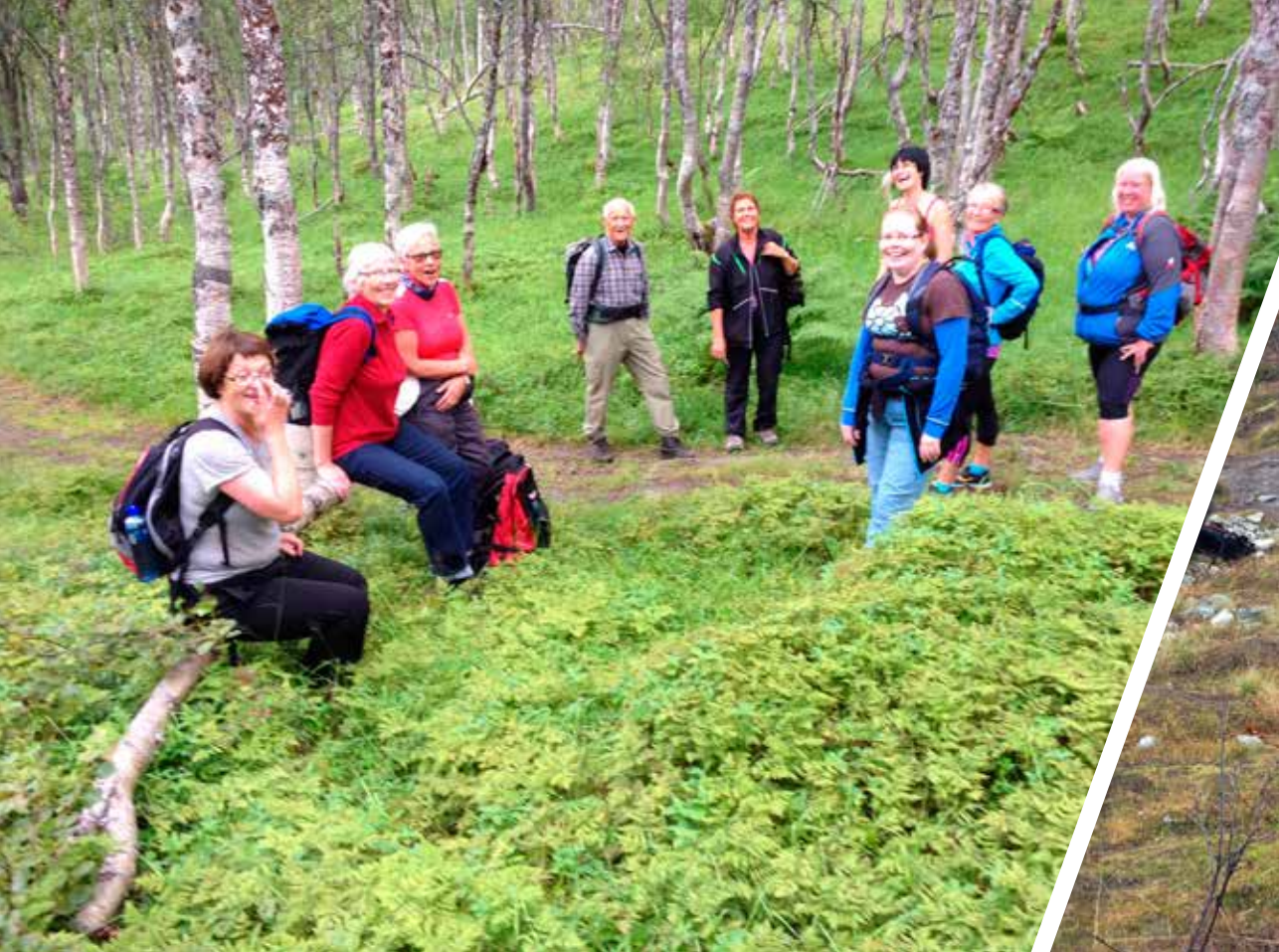
På vei til Nonsbu