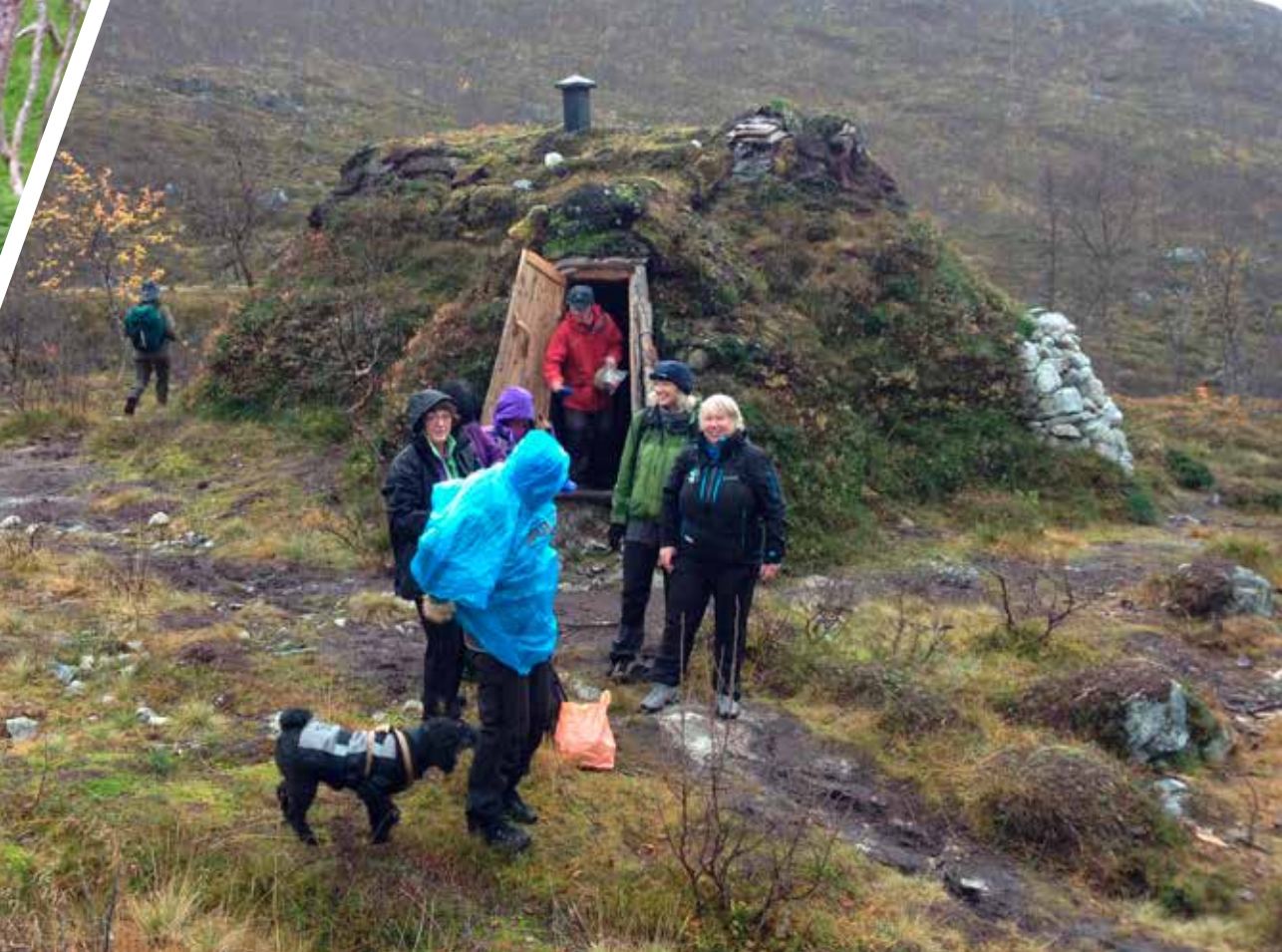
Jordgammen i Simavikdalen

«Aktiv på Dagtid» er et allsidig aktivitetstilbud i regi av Troms Idrettskrets og Tromsø Idrettsråd, tilpasset mennesker med ulike forutsetninger for aktivitet. Det er mange muligheter: basseng, tennis, treningsstudio, trimsykkel, bowling, thai-chi chuan. Og på sommeren også turgåing hvor Troms Turlag kommer inn.