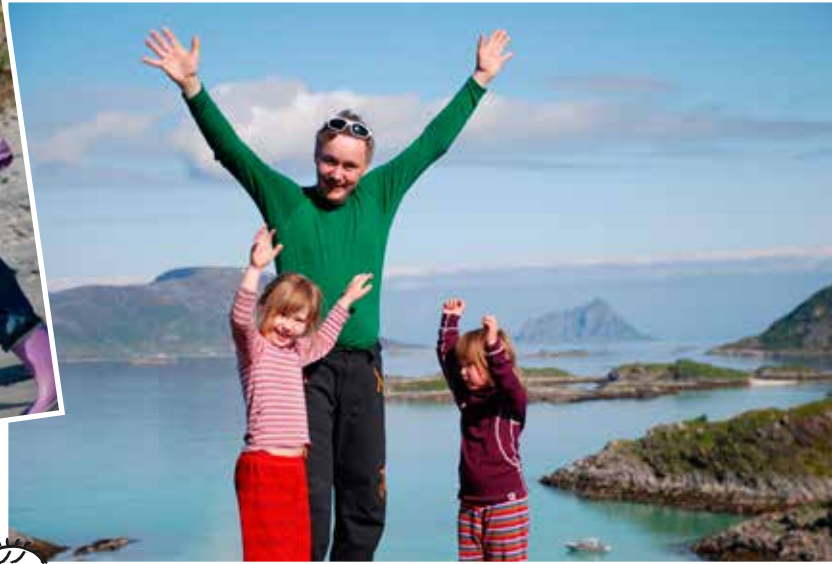
Hurra – vi nådde den lille toppen.