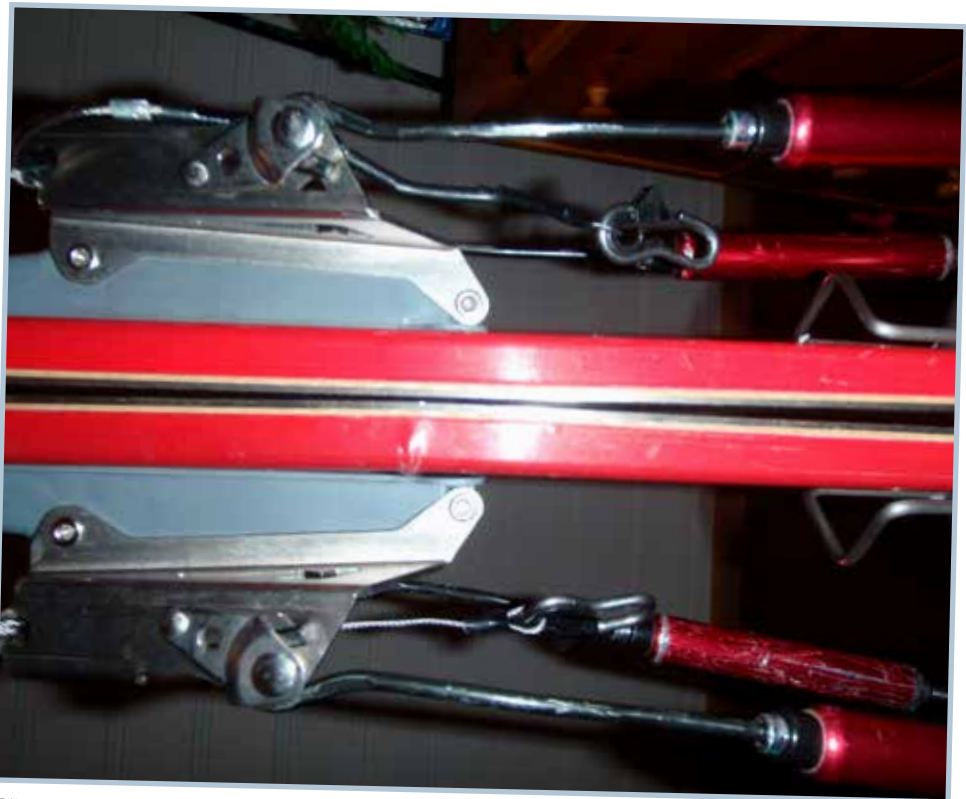
Bildet viser at skia har sviktet midt under bindingen akkurat der skruene er. Skia sviktet under kjøring og ikke pga fall.