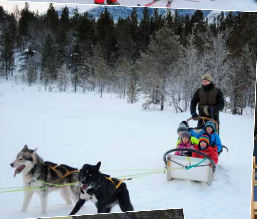
Gøy med hundekjøring.