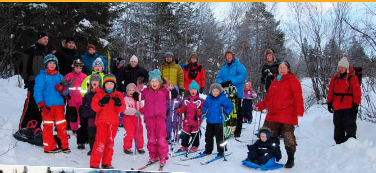
En del av gjengen.