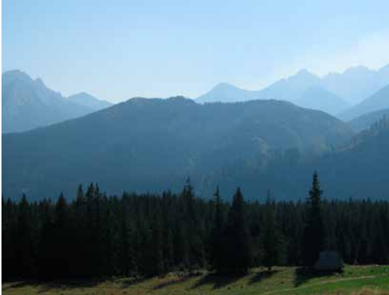
På vei opp til Swinick (2205 moh).