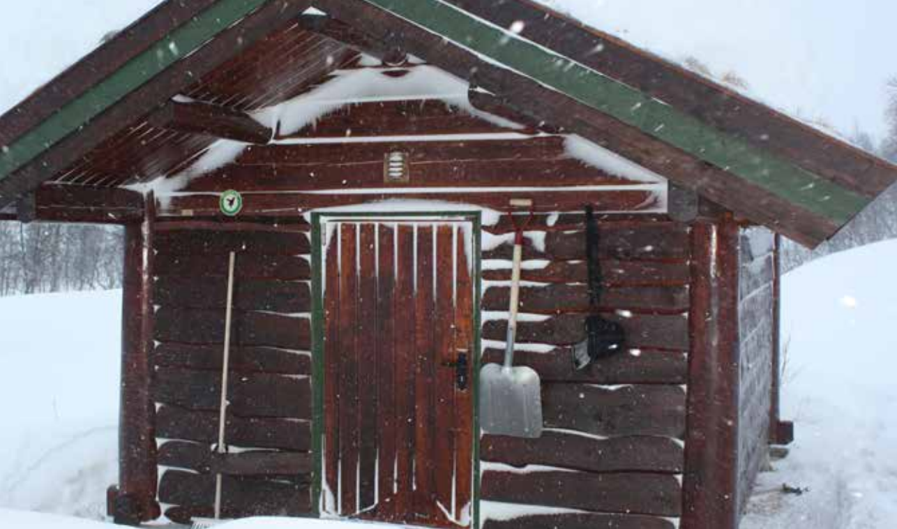
100-årsbua i Bjørnfjellområdet hadde cirka 250 besøkende i 2010. Hytta står åpen og ønsker gjester velkommen.