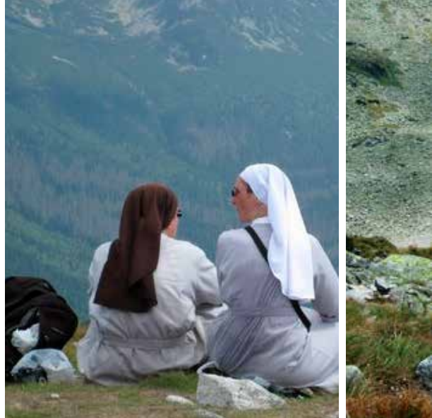
Søstre på tur.

møter utrolig mye folk i fjellet, og vi utvekslet hilsen som fjellfolk gjør; Dzień Dobry! God dag! Polsk befolkning besøker sine fjell. For den som søker fjellvandring på stille stier, er definitivt Tatrafjellene ikke rett valg. Her var det folksomt, sett med norske turistøyne.