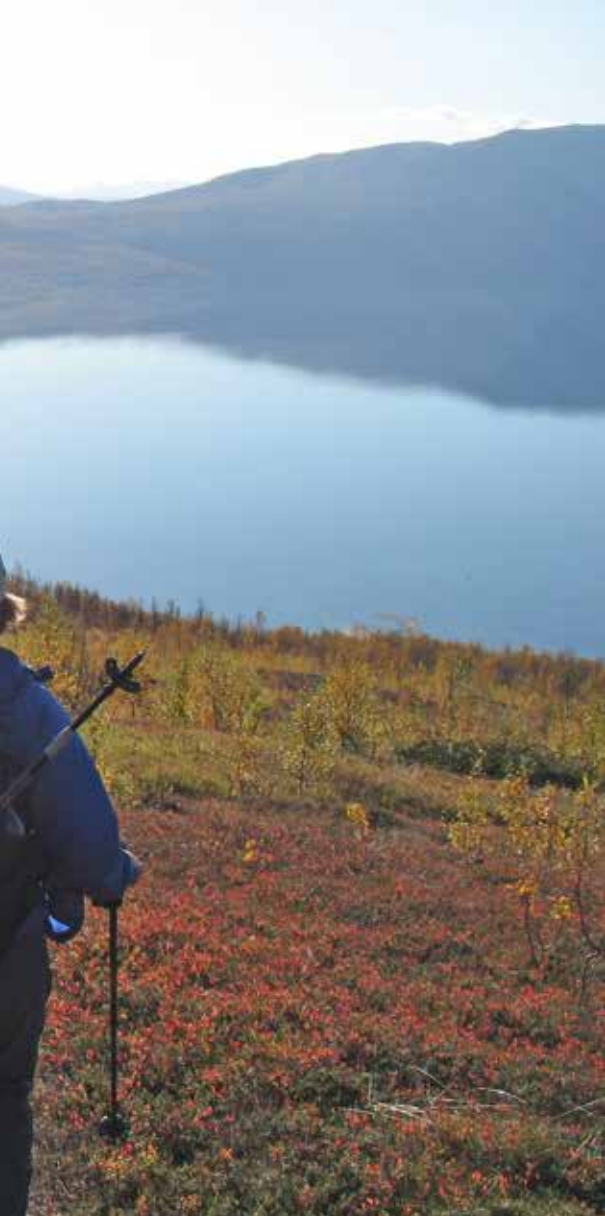
På veg ned fra Blåtind.

sosiale arrangementer (fredag 7. og lørdag 8. juni) , det er Landsmøtemiddag (lørdag 8. juni) og det er en rekke turer til fjells, i fjæra og på havet gjennom hele uka (fra onsdag 5. til søndag 9. juni) .