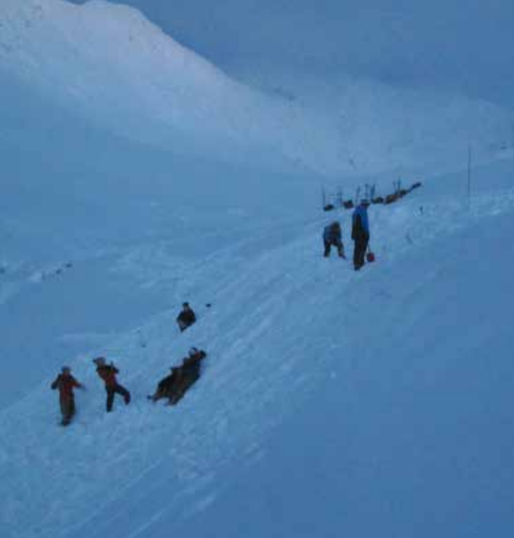
Her skal det graves! Gjengen har delt seg i flere grupper og fordelt arbeidsoppgaver.