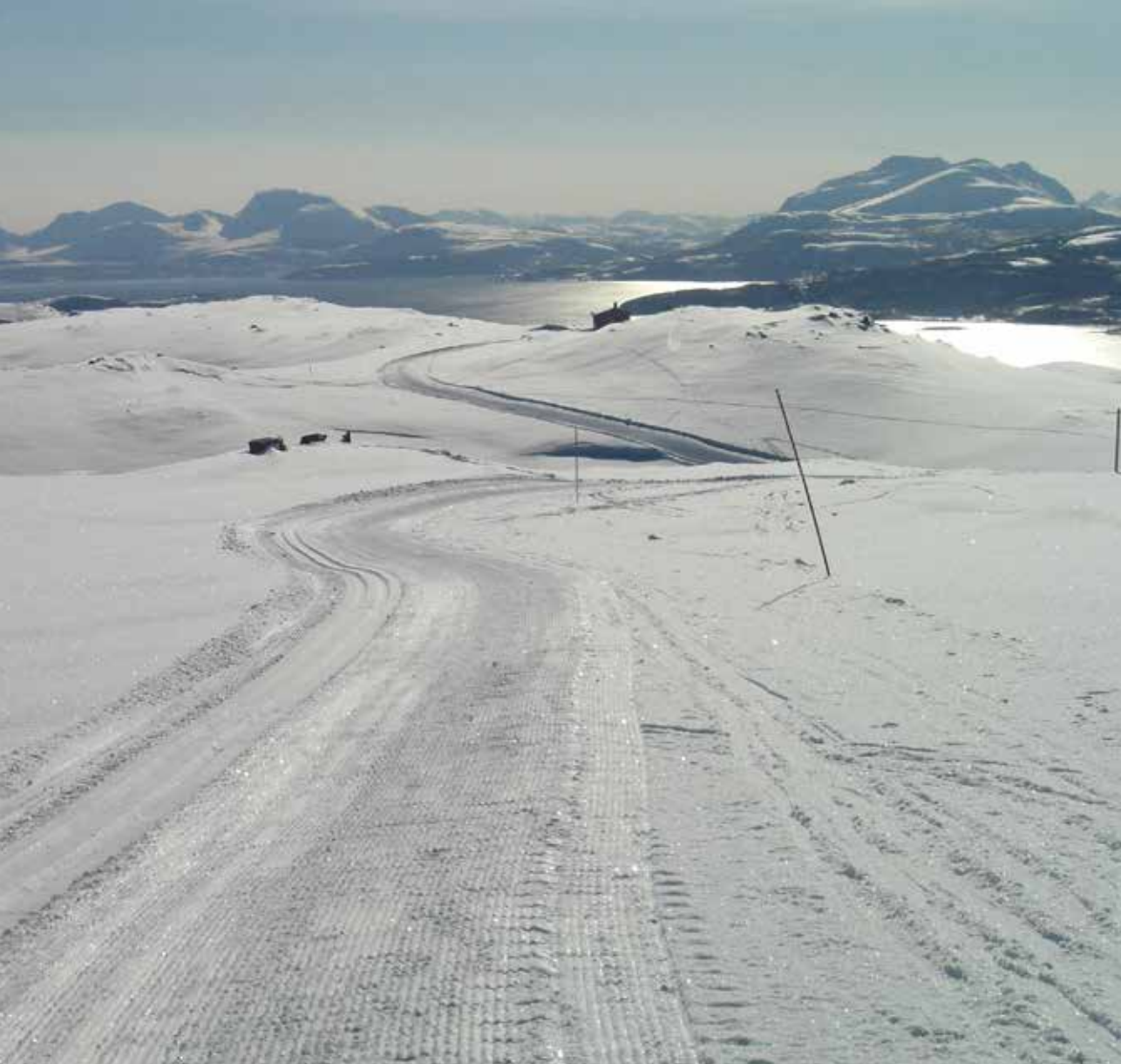
Utsikt mot Mallangen.

Det er også laget et utedo/vedsjå for de trengende. Noen vintre med mye sny blir det også tråkket løype til Rødfjellet.