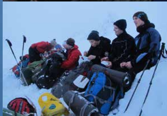
En pust i bakken for Ungdomsgruppa på veg opp mot Piggtinden.