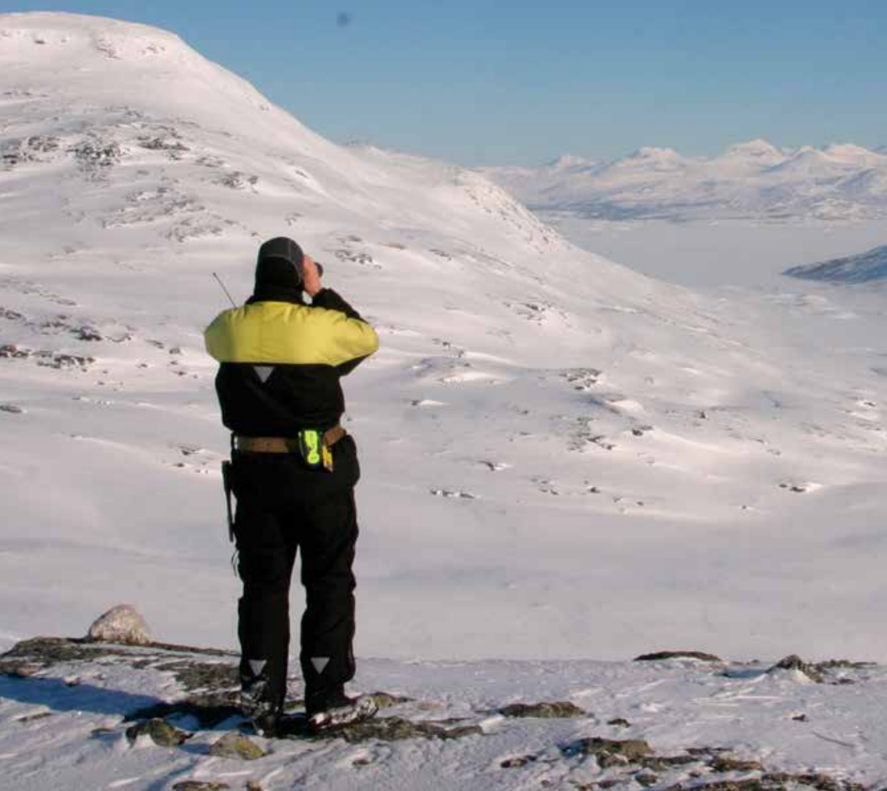
Oppsyn statsgrunn, et sted i nærheten av Altevatnet.

En viktig oppgave er tilstedeværelse på eie- dommene. Det er viktig for Statskog at det er god tilgang til herlighetene på fellesskapets grunn. Derfor legger vi vekt på tilrettelegging for jakt, fiske og friluftsliv. Årlig bruker vi store summer på tilrette- legging i form av åpne hytter, toaletter, klopper, stier, bruer, bord/benker, parkeringsplasser, gapahukerosv. I region Troms har vi over tretti åpne husvære.