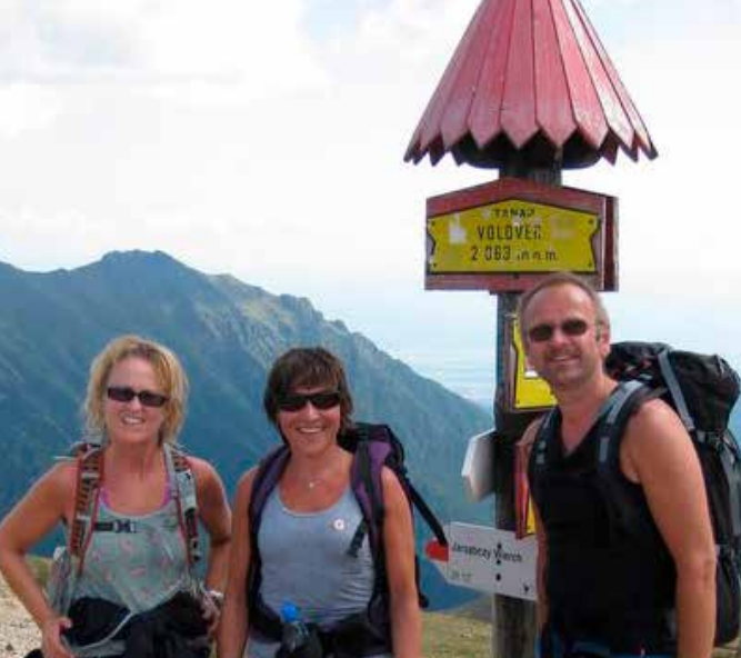
Her har team Tromsø kommet opp.