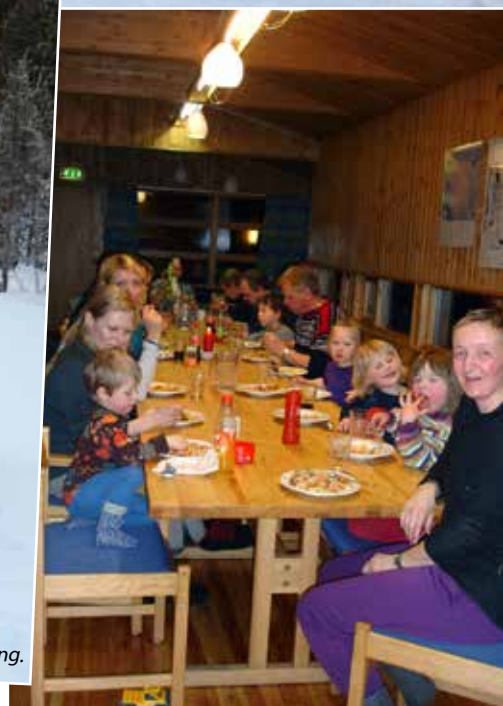
Som kjent så må mat og drikke også til- takk alle som hjalp til med fellesmat!