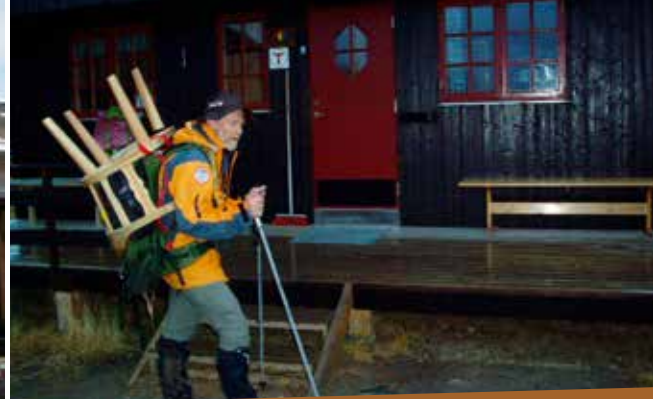
Takpapp må skiftes og inventar bæres opp.