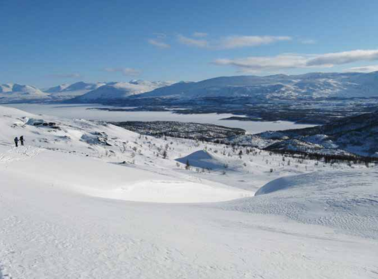
Fra nedkjøringa til Lappjord med utsikt over Tornetræsk.