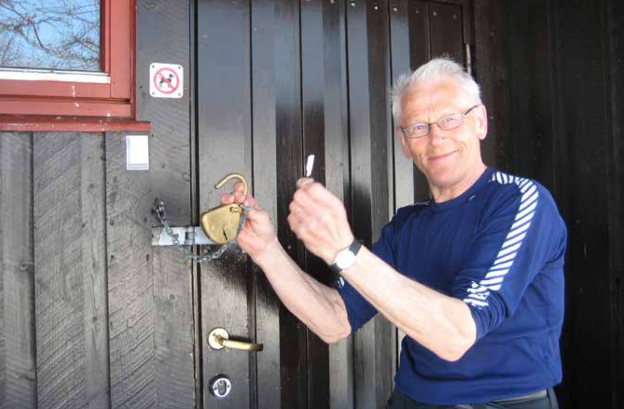
Her er nøkkelen til eventyret.