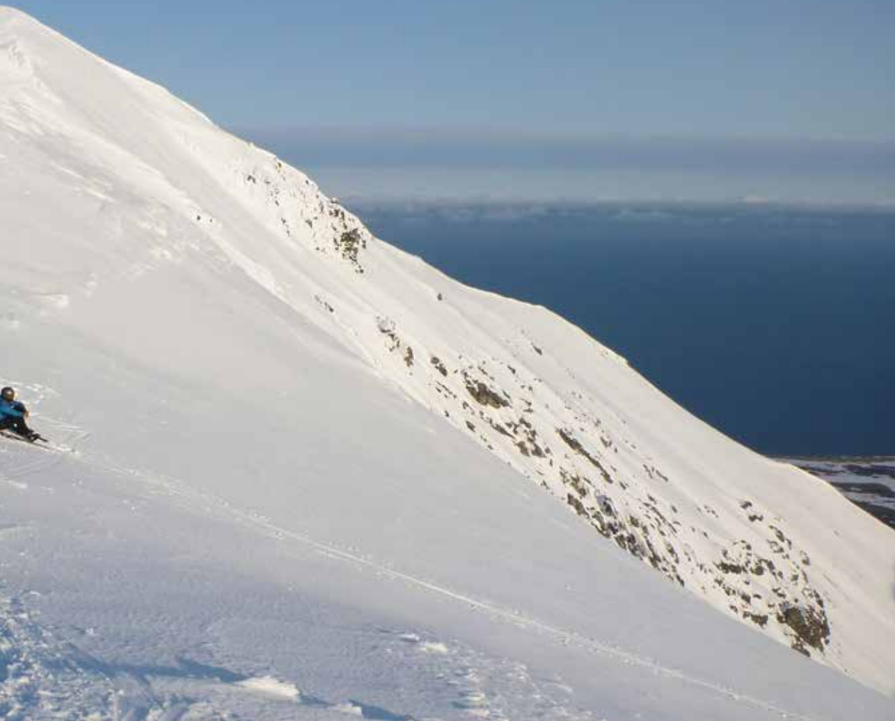
Pause med utsikt, nær toppen av Daumannen.