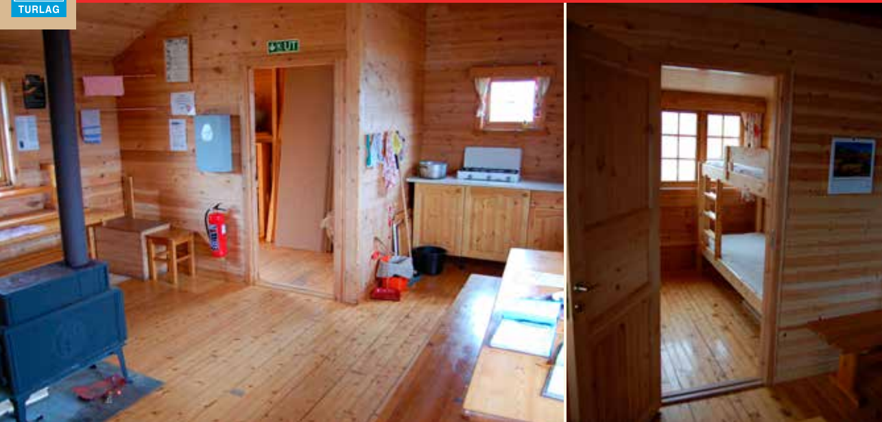
Den nye innredningen på Skarvassbu.