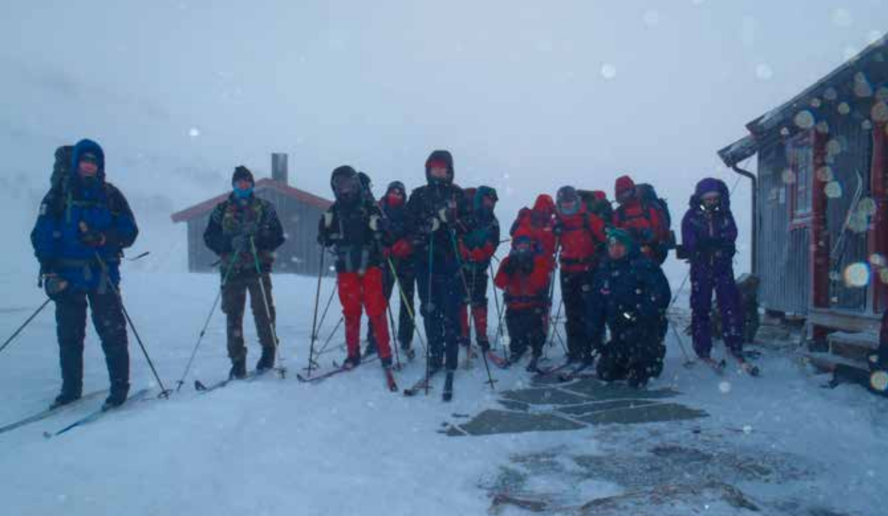
Frisk gjeng klar for avgang fra Rosta i minus 28 grader.

smidig overgang til hovedretten som var marinert lammecarre med glaserte rotgrønnsaker. Du verden for noen godsaker som kan lages til fjells! Her handler det om kreativitet, våge å tenke andre løsninger enn pølser i brød og tørrmat. Kvelden ble avrundet med skogsbærsuppe med fløte og nykokt kaffe. En annenledes lørdagskveld langt oppe på fjellet, måneskinn ute og solskinn inne i form av ett knippe varme og strålende deltakere som laget en perfekt ramme på kvelden. En nydelig dag gikk mot slutt og vi begynte så smått å tenke på turen tilbake.