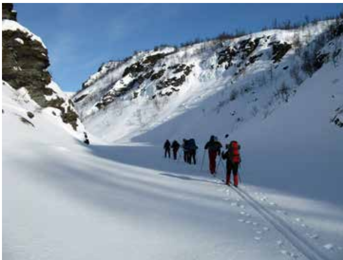
På veg ned canyon i Sørtdalen.

Å komme ned til Lappjordhytta og nyte utsikten er på mange måter å komme til et annet rike. Ikke bare