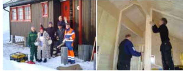
Fra nybygget på Dærta.

Fjellvåkenredaksjonen ønsker Kirsten velkommen og lykke til i sin nye jobb i Troms Turlag.