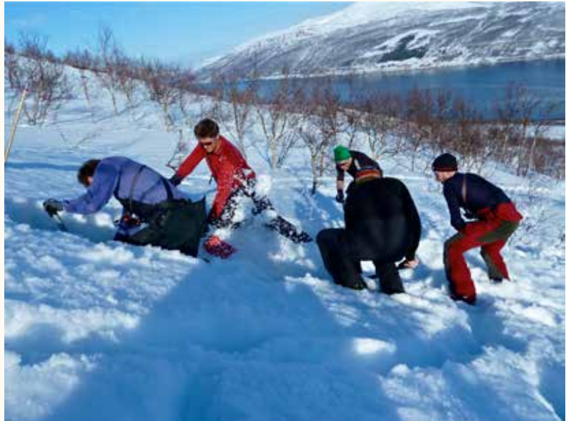
Fra skredkurs i regi av Fjellsportgruppa.

Noen faginstusjoner har sett på hvordan en kan forbedre skredvarslene, og har nå under utprøving en mer omfattende skredvarsling enn den mer generelle varslingen som har vært gitt. Du kan gå inn på www.varsom.no og finne mer spesifikk skredvarsel for ditt område. Oppdatert skredvarsel blir lagt ut to ganger i uka. Vær oppmerksom på at denne skredvarslinga er under testing og utvikling med varierende kvalitet. Det presiseres at det er ditt eget ansvar å bruke denne tjenesten, og nettstedet vil svært gjerne ha tilbake-