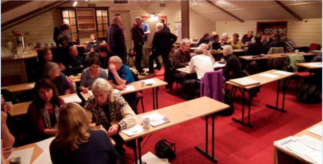
Gruppearbeid på tilsynsmøtet på Vollan.

Over 35 personer, de fleste tilsyn, stilte lørdag 6. november på Vollan Gjestestue for å få inspirasjon, litt faglig påfyll, og en uformell prat med sine kolleger på hyttene. Det betyr at de aller fleste hytter i nettet var representert. Vi var nok klar over det på forhånd, men under presentasjonsrundene i åpningen ble vi minnet på hvilken utrolig mengde erfaring og kunnskap som ligger samlet hos alle de som har tilsyn med våre hytter. Det er god spredning i antall år de enkelte har hatt tilsynsansvar; noen har holdt på i nær 30 år, mens andre er helt ferske.