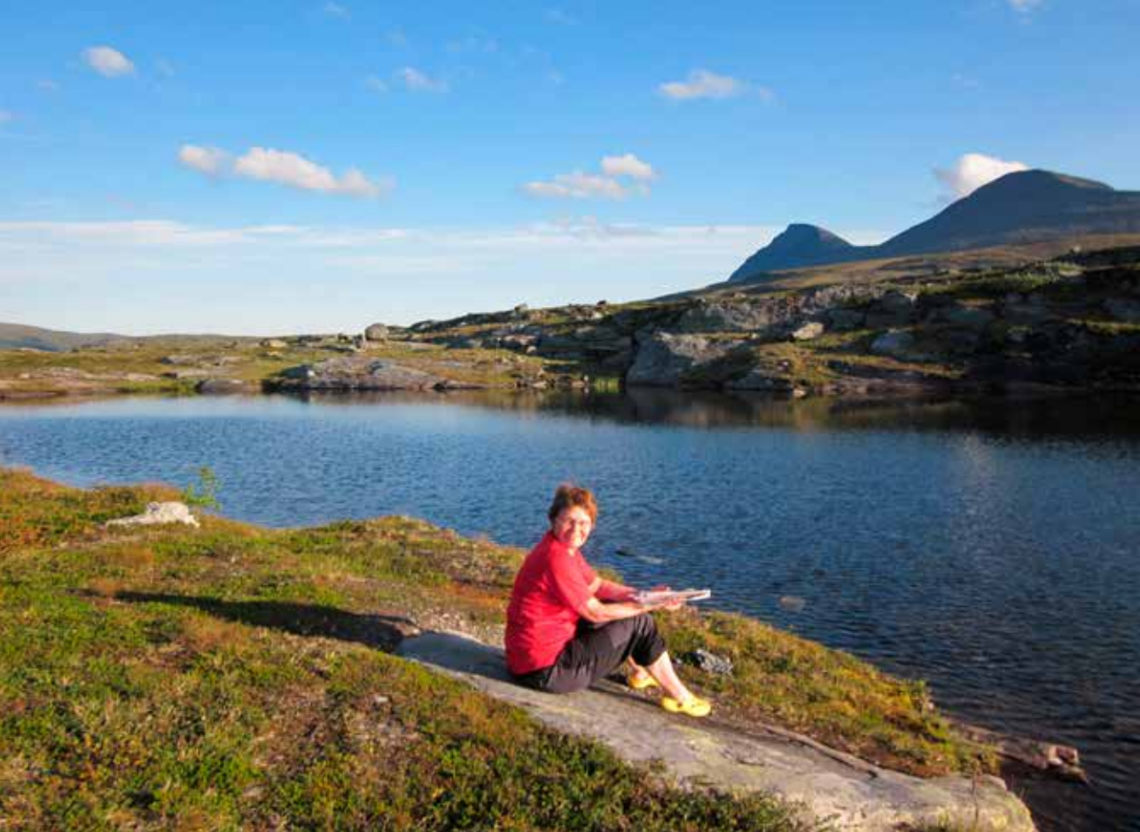
Stemning ved Gappohytterne med utsyn mot Pältsatoppene.

”Min sønn skal lage mat til meg og bære den tyngste sekken. Min sønn vil ikke være med til Paras”, forteller han. Sønnen uttrykker stolthet over sin spreke far, som han ikke lenger vil la gå alene i fjellet.