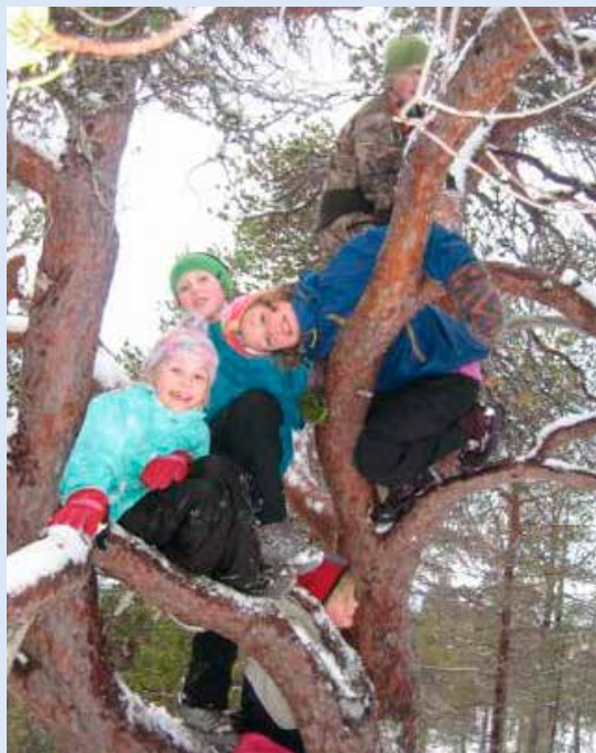
Fornøyde turbarne.

* Det er her snakk om en avgrenset uttømmende politiattest, dvs. en attest som bare sjekker noen bestemte typer lovbrudd, særlig i forbindelse med overgrep mot barn, men som inkluderer alt som er registrert på disse områdene, uten tidsbegrensning.