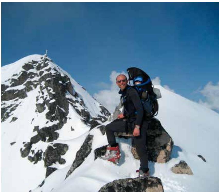
Pappa og Viljar på Skittentinden 14 mai 2007.

Så hva trenger du? En lett og god bæremeis. Sjekk feks. Bergans Junior sport på knappe 2 kg. Det blir tungt nok om du ikke skal dra på ett og ett halvt kilo meis ekstra. Tak er lurt, som beskyttelse mot både sol, vind, snø og regn. Varmepose med bein er ikke dumt, alternativt dine gamle bivuaakk-sko. Det er viktig å holde barnet varmt; så «husk; ull innerst». Gjerne også som mellomlag under vinterdressen. Pass godt på hender og føtter. At det blir litt kaldt er likevel knapt til på unngå. Vær spesielt oppmerksom om det blåser; i motsetning til deg sitter barnet stil-