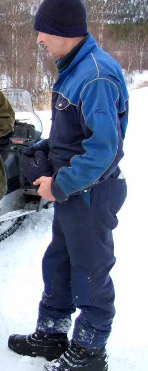
forbereder gasstransport til Dividalshytta.