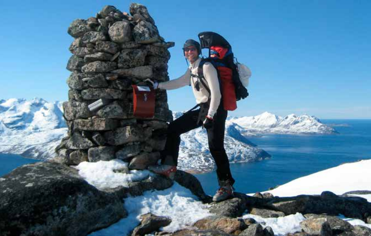
Fornøyde gutter på Nordtinden 12. mai 2010