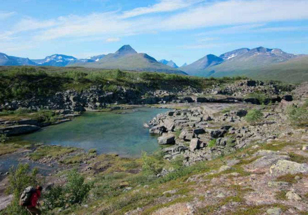
Skjærdalen byr på mange synsinntrykk.