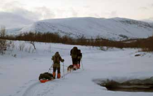
Turgruppe på vei opp Anjavassdalen. Gruppen følger elveisen, noe som kan vise seg problematisk.

skrøner måtte vike for vinterfjellets alvor denne nyttårskvelden.