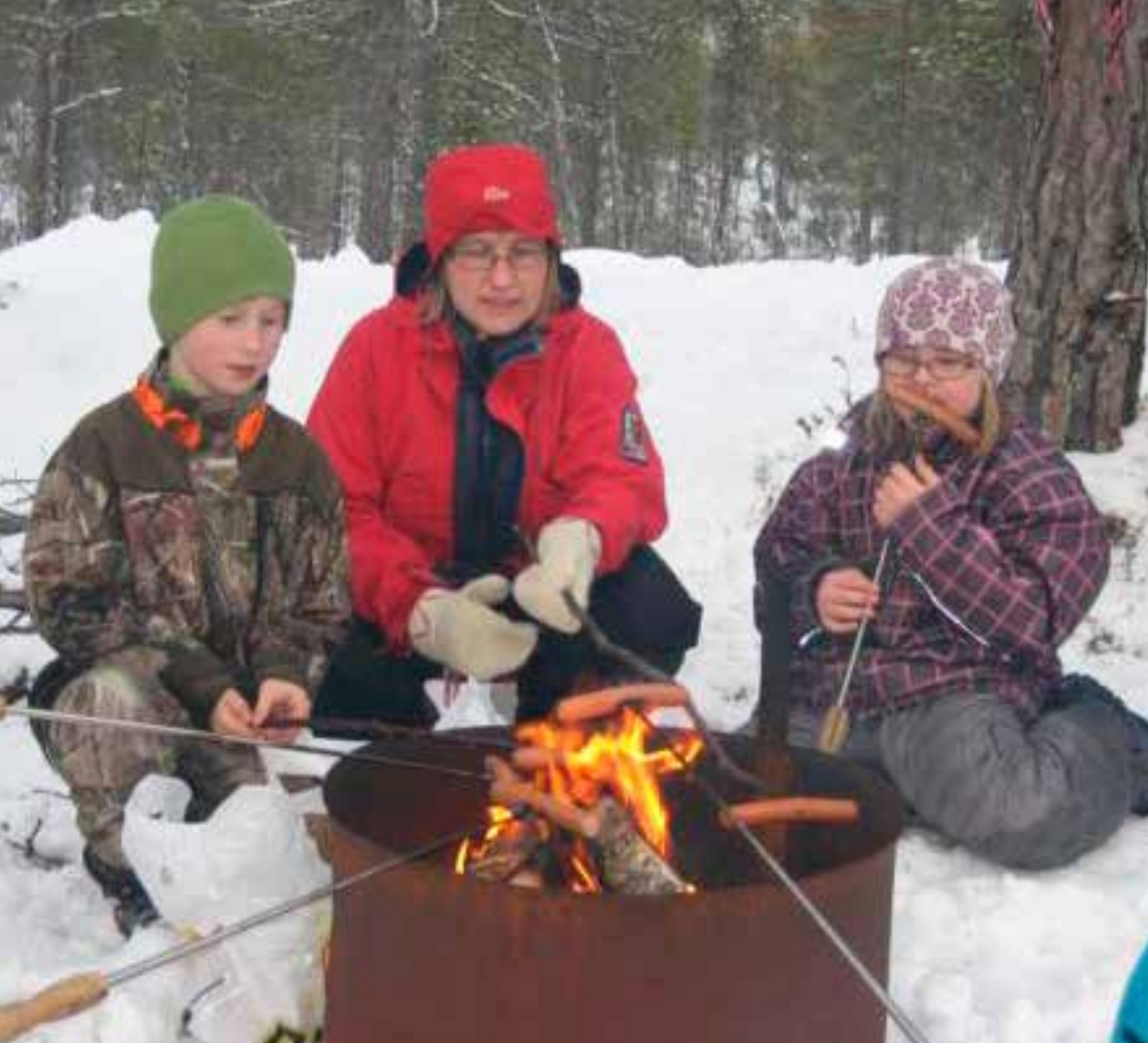
Pølser er populært!