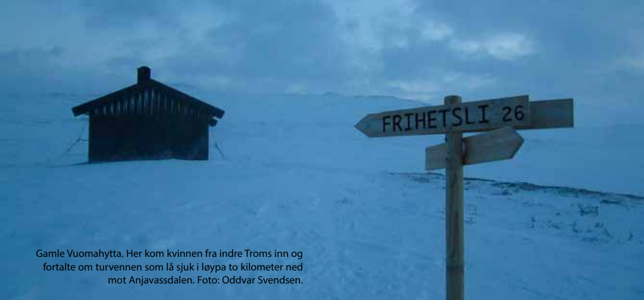
Gamle Vuomahytta. Her kom kvinnen fra indre Troms inn og fortalte om turvennen som lå sjuk i løypa to kilometer ned mot Anjavassdalen.

nisasjoner er basert på frivillig og ulønnet innsats. Det kan derfor synes som en utfordring å stable på beina en redningsstyrke på kveldstid nyttårsaftnen. Ikke desto mindre: Klokkeren 22.30 meldte Røde Kors at de hadde mobilisert redningsstyrker fra de lokale korpene i Bardu, Finnsnes og Balsfjord. Ventetida fortonet seg lang for dem som tok vare på pasienten i teltet i Anjavassdalen, og i denne tida ble det også sendt privat nødmelding til Spot-eierens pårørende. Dette ble tolket som en eskalering av nødssituasjonen både av pårørende og politi. Da pasientens situasjon fortsatt var kritisk, ble det også sendt to skiløpere fra Vuomahytta til Gaskashytta, der det var dekning for mobiltelefon, for å få gitt beskjed til redningstjenesten om at det var en alvorlig nødssituasjon. Det var tross alt nyttårsaftnen, og hvem visste hvordan en nødmelding ville bli tolket? Og hvordan ble våre nødbluss tolket? Året i forveien tjente de som nyttårsraketter!