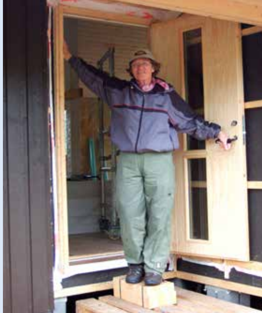
Velkommen til å bidra i fellesskapet.