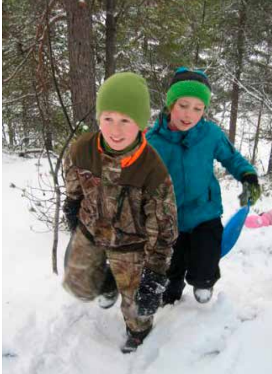
Klar for aking