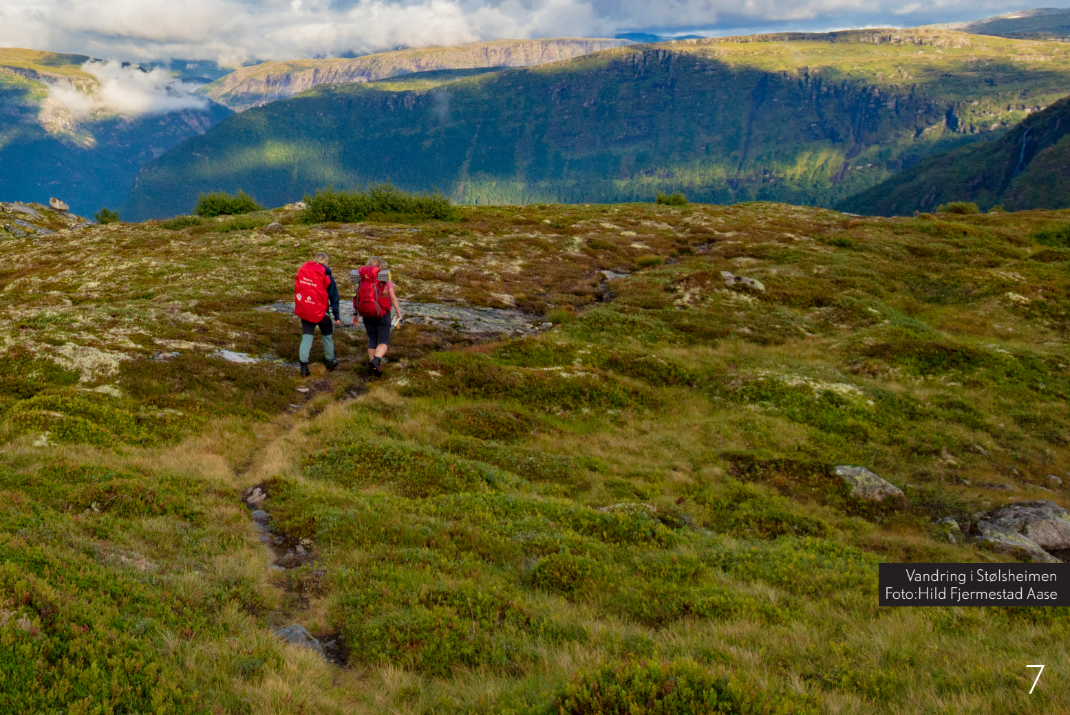
Vandring i Stølsheimen

"DNT foreiningane har ein sentral rolle i friluftslivskulturen i Noreg, og difor skal me også inspirera alle som driv friluftsliv til å redusera sitt fotavtrykk"