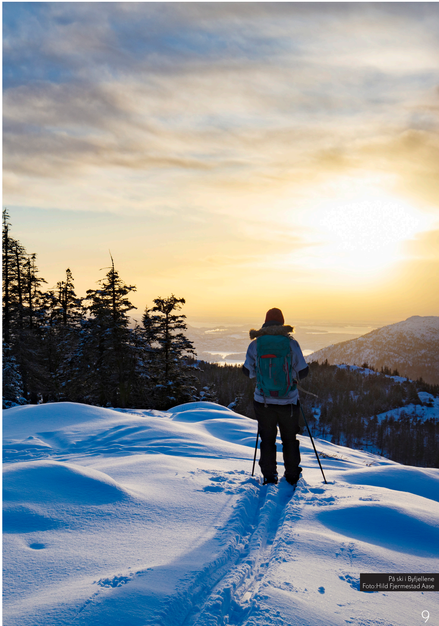
På ski i Byfjellene