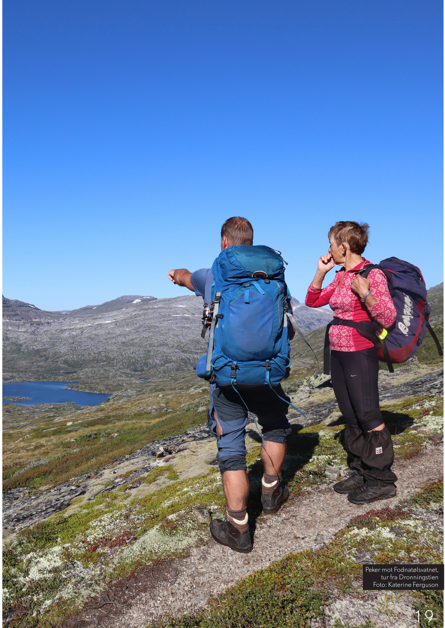
Peker mot Fodnatølsvatnet, tur fra Dronningstien