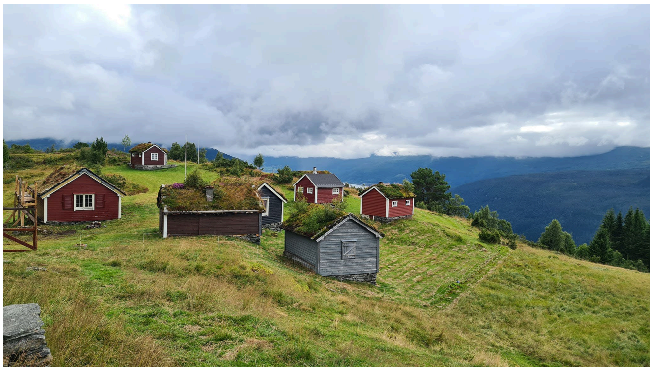
Utitunstøylen på Hopland