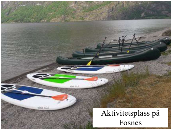
Aktivitetsplass på Fosnes