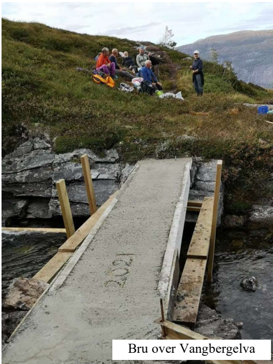
Bru over Vangbergelva