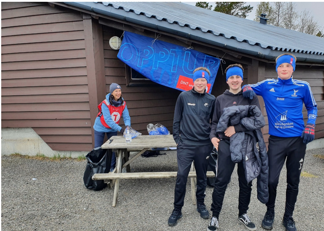
Bilde: Vi legg bak oss det 16. flotte arrangementet med OPPTUR

Det blei ein kjekk OPPTUR dag med alle 8.klassingane, lærarar, Skogselskapet, sponsorar og dei frivillige frå Flora Turlag - å joda kalde vart vi men rike på naturopplevingar, kunnskap og mestring.