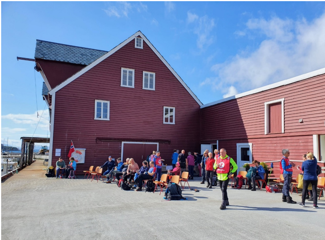
Bilde: Mange deltok på Øyane Over i år, og vi var velsigna med godt vær

Både Alden Værlandet/Bulandet og Hovden dagen blei avlyst i år på grunn av dårlig vær. På hausten var det mykje regn og vind, ingen turdeltakarar melde seg og fleire turar blei også difor avlyst. Det var satt opp skitur frå Ålfoten som skulle være ein fellestur for Keipen Turlag som hovudansvarleg saman med Midtre Nordfjord Turlag og Flora Turlag, denne blei også avlyst på grunn av dårleg vær. Vi prøvar igjen i 2023, og kryssar fingrane for betre vær.