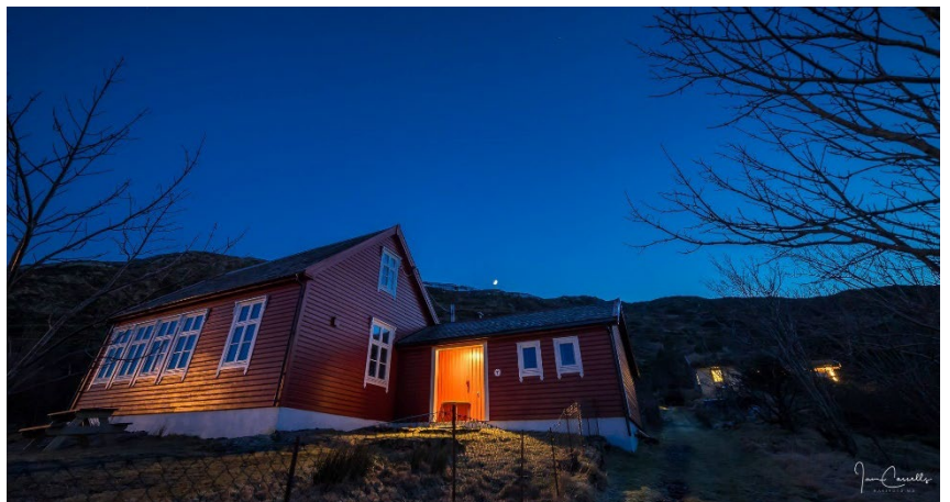
Bilde: Mykje dugnad på hytta på Kinn i 2021.

konfirmantar og hyttefolk. Ein skuleklasse har også rydda og fekk redusert leige for det. Skifterheller som mangla på tilbygget er lagt på. Lista ferdig rundt vindu og døra i boda og fjerna gamal kjøkkenbenk. I juni fekk vi nytt stort kjøleskåp med Elkjøp. Vindua i stova er pussa ned slik at dei kan opnast. Ny septiktank er på plass/kobla til, drenert og lagt på grus på baksida av hytta. Vegen opp til inngangen er grusa.