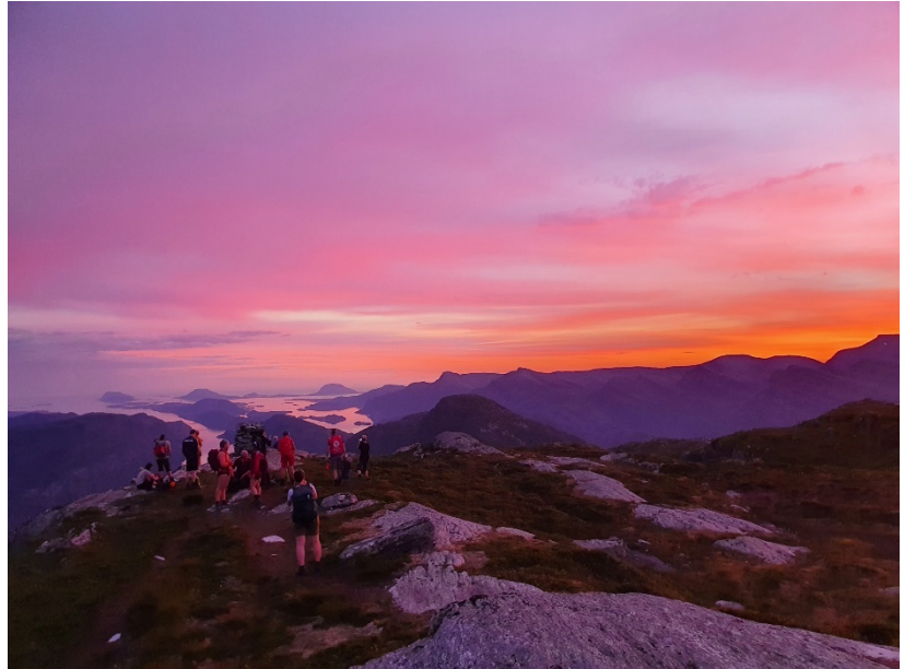
Bilde: Nipenatt blei ei fantastisk naturoppleving.

Som alltid har sikkerheit vore i fokus hjå oss, og vi har ikkje hatt nokon personskeidar i 2021. Alle turar blir risikovurdert på førehand av turleiar. Vi har revidert beredskapsplanen vår, og følgd nasjonale DNT sine smittevernstiltak, samt nasjonale og lokale. Vi har jobba for å alltid være oppdatert på dei siste føringane vedr. Covid-19, og vi har tatt smittevernet på alvor. Alle våre turleiarar har tatt nettbasert smittevernkurs. Vi har også innført obligatorisk påmelding i forkant av turane, og når dei nasjonale føringane har kravd det har vi satt eit tak på 20 personar pr. tur. Det har også blitt gitt føringar for transport. På øyaturne har vi tatt hensyn til offentleg transport.