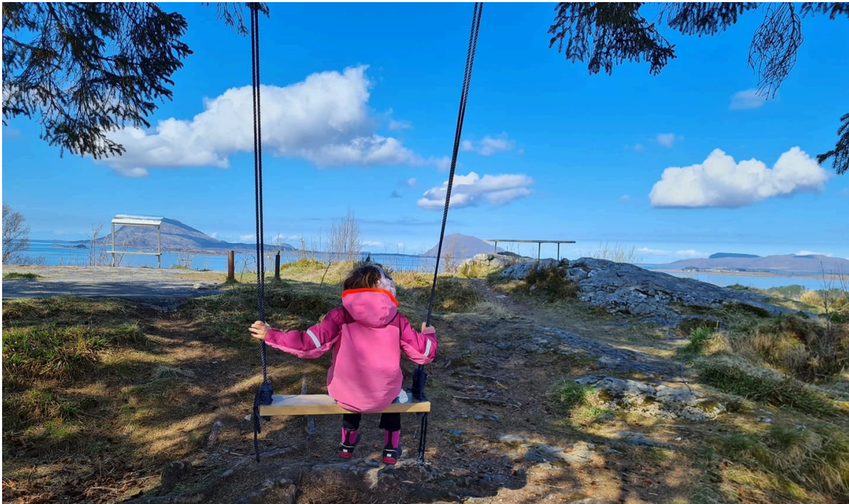
Bilde: Mange tok turen til både Store – og Litleåsen i Trimpoeng perioden.