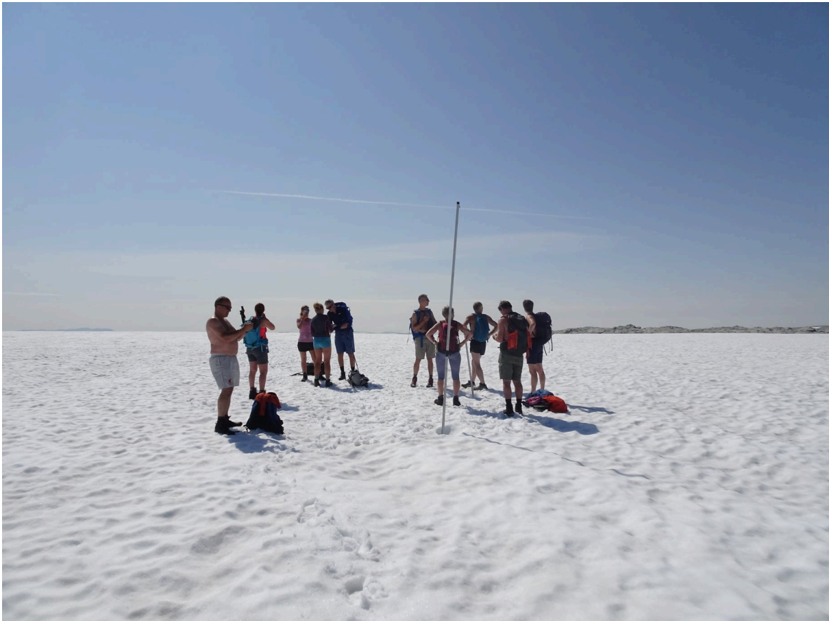
Bilde: På Ålfotbreen og toppen av høgste brekulen.

Flora Turlag (FT) er tilslutta Sogn og Fjordane Turlag (SFT) som er ein av medlemsforeiningane i Den Norske Turistforening (DNT). Flora Turlag sitt medlemsområde er gamle Flora kommune, og utøvar sitt arbeid i Flora kommune. Formålet er å være den leiande formidlar av eit enkelt, aktivt, allsidig og naturvennleg friluftsliv, samt jobbe for ivaretaking av friluftslivets natur og kulturgrunnlag.