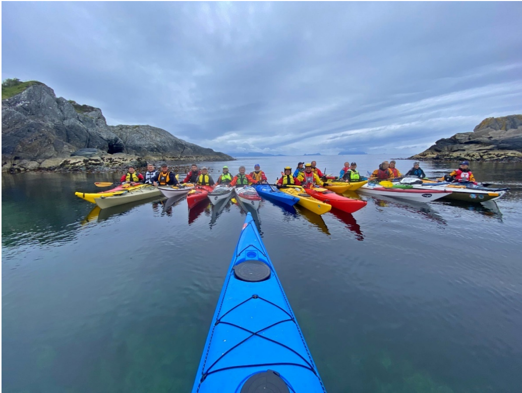
Bilde: Mange deltakarar på populær onsdagspdaling.