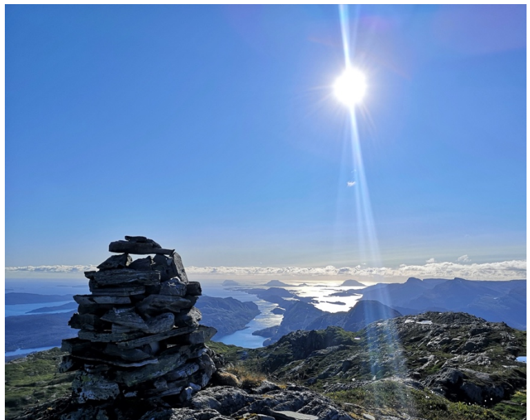
Bilde: Flotte Flattenipa er ein av turane som ligg på SjekkUT.

UT.no DNT sin digitale tursti, og her har Flora Turlag 158 turtips og 3 hytter. Ut.no er eit levande prosjekt som vi oppdaterer heile tida.