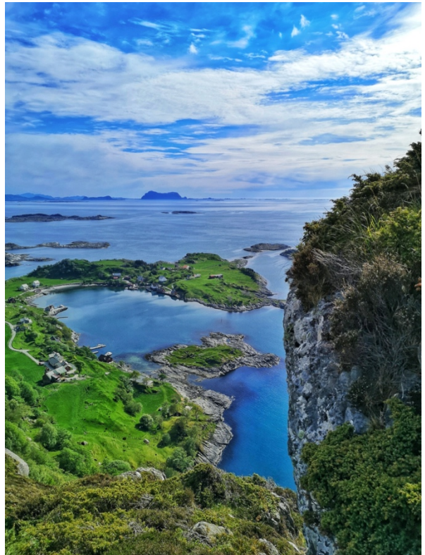
Bilde: Eit av årets fredagstips var på Askrova.