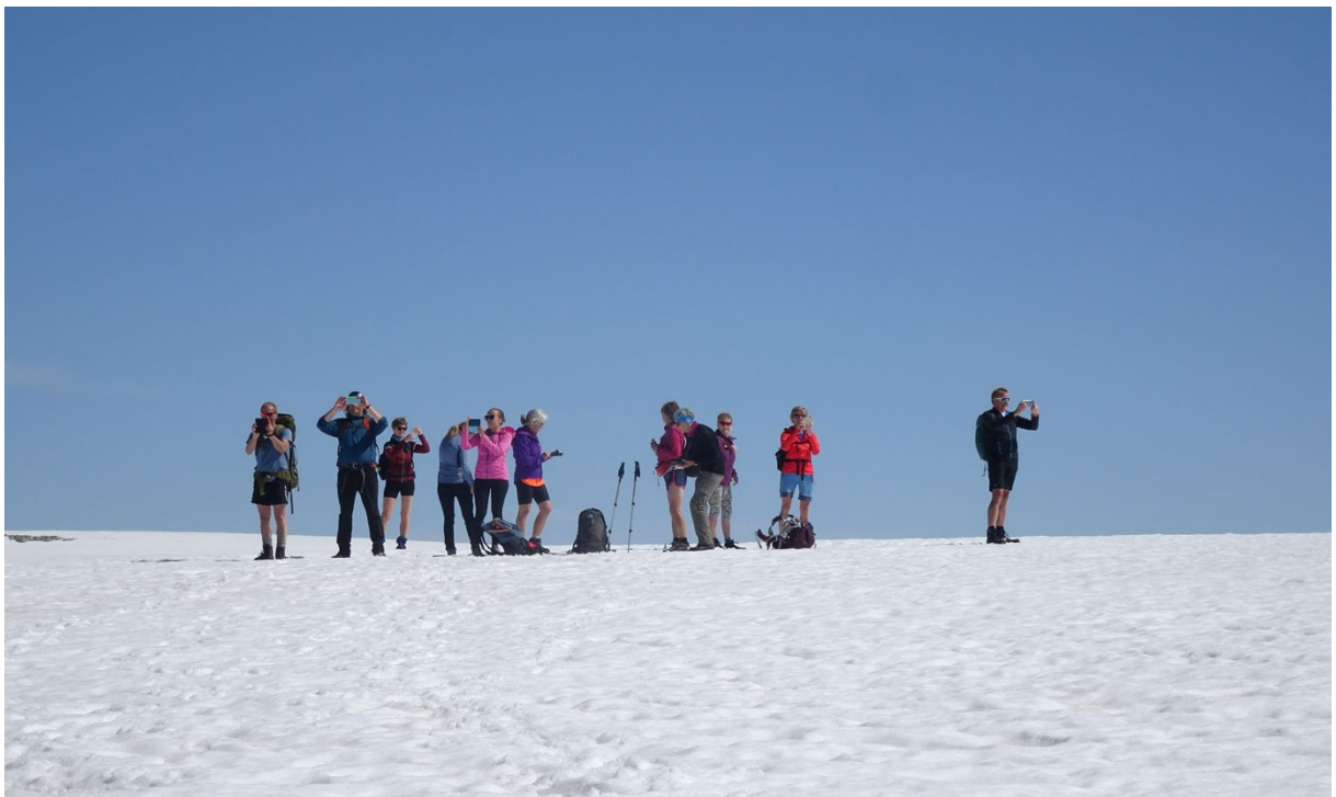
Bilde: Ein av våre flotte helgeturar, her er vi på Ålfotbreen.

Nokre av turane blei set opp seinare på året; nokre fekk vi heldigvis gjennomført og andre blei avlyst av været. Øyane Over, året store arrangement blei korona avlyst, men blei prøvd å sett opp seinare, men då avlyst på grunn av vær og lite påmeldingar. Både Alden Værlandet/Bulandet, Nipenatt og Hovdendag blei korona avlyst i år. Dette er ein tursesong som kjem til å gå inn i minneboka til dei fleste av oss. Og kanskje gjer det at vi set enda meir pris på dei turane vi får tatt saman.