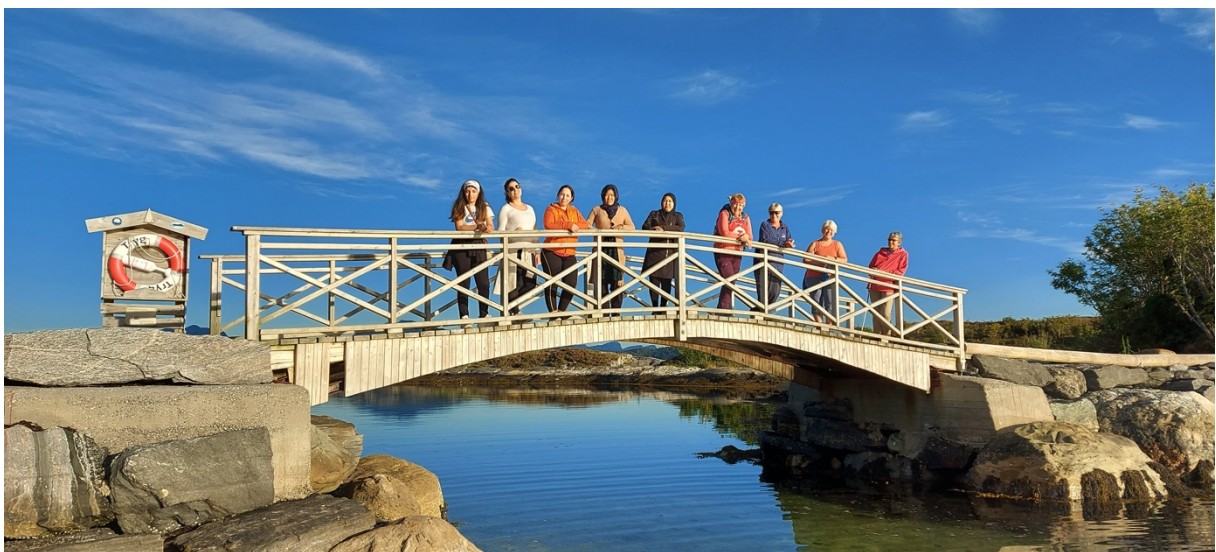
Bilde: Frå måndagstur i strålande vær. Her på Sørstrand.