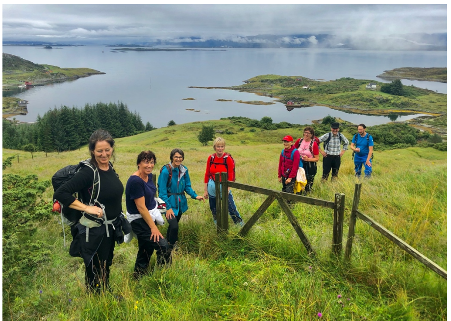
Bilde: Frå Askrova i august.

Det var turar ut frå nærområdet, lenger inn i fjorden og som øyatur. Padlegruppa er ein fin gjeng, og kjekt er det at det kjem fleire tilreisande på ettermiddagspadletur.