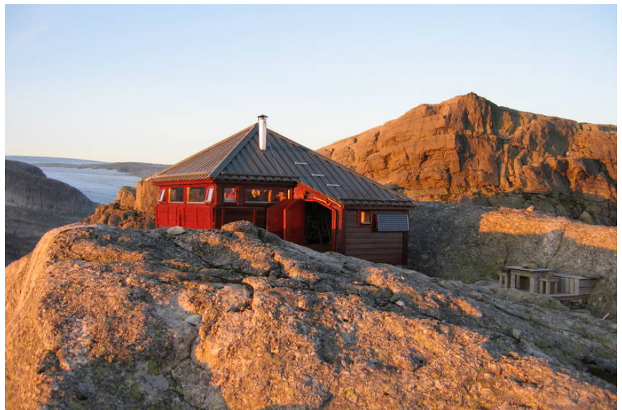
Her frå Gjegnabu.