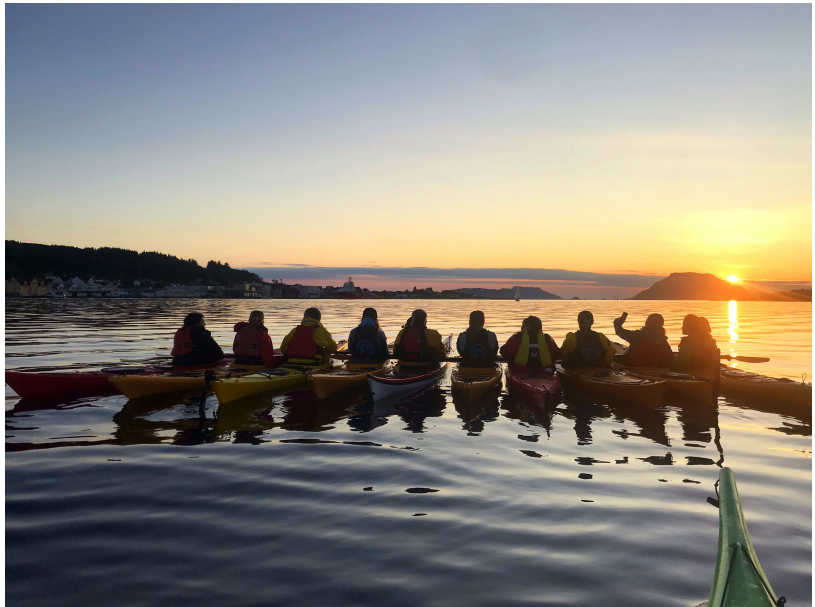
Onsdagspadling på årets siste tur.

Denne sesongen har vi valt å prøve ut fleire nye turmål for padlegruppa. Heile 5 gonger har vi pakka hengaren vår, og tatt med kajakkane på tur. Det har vore veldig populært, og kjekt å prøve ut nye områder. To gonger har vi tatt hengeren med på rutebåten, ein til Fanøya og ein til Askrova. Elles har vi vore rundt Grønenga, til Stakaldeneset og i Nordalsfjorden. Florø har så mange fine plasser for kajakkpadling!