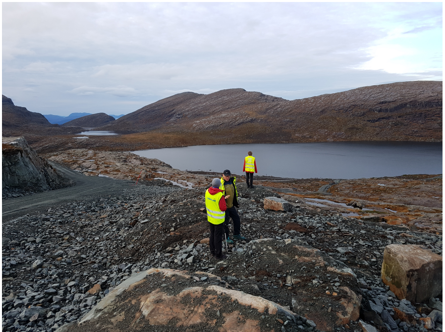
På synfaring i Grytadalen.