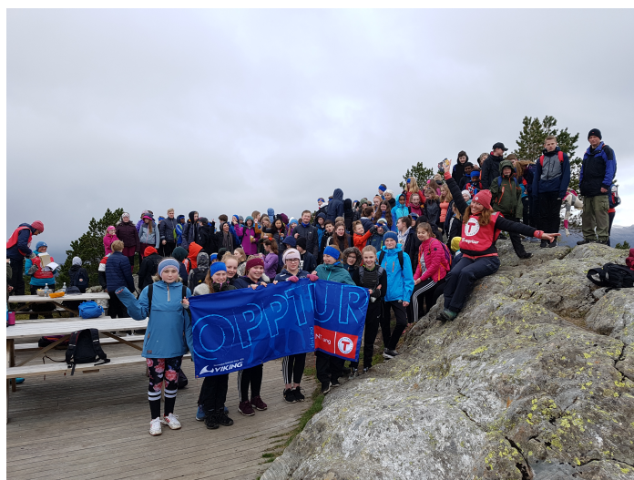
Oppturgjengen samla på toppen av Brandsøyåsen!