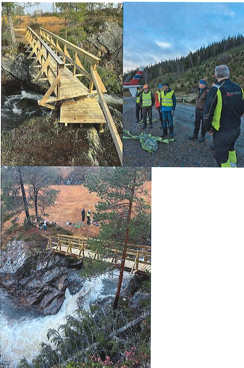
Ny bru over Storbekken og materialer til klopplegging av Malsåstien ble flydd ut.

Fjellgårdsstien i Snåsa og Blåmurstien som går mellom Skorovas og Lierne ble ferdigstilt, og det er satt opp informasjonstavler og utedo på Arnbygget i Lierne. Største investering på sti i 2025 var Malsåstien og brua over Storbekken. Materialer til både bru og klopplegging ble flydd inn med helikopter da det ikke lot seg gjennomføre å kjøre dette inn med snøscooter. Etter flere utsettelse pga værforholdene, ble det gjennomført stordugnad 12.oktober med utflyging av materialer og bygging av bru.