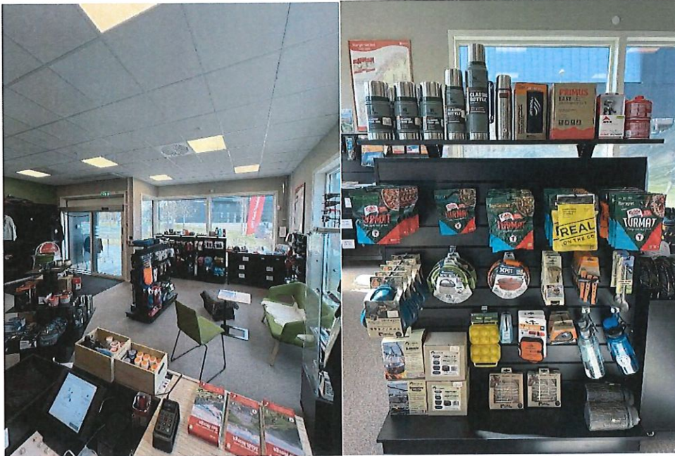
Tursenteret er godt synlig i sentrum på Stjørdal og med moderne lokalteter.