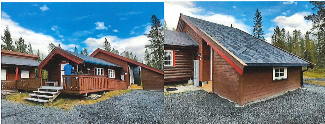
Veresstua med nytt inngangsparti og hundrom med to sengeplasser.

Styret vedtok i styremøte 2.desember 2024 utbygging av Veresstua, og i 2025 ble det inngått avtale med Mikael Wik Entreprenør AS. Utbyggingsprosjektet ble i gang satt 19.mai og ble fullført i løpet av juli. Innherred turlag planla og gjennomførte prosjektet med stor dugnadsinnsats og i godt samarbeid med entreprenøren.