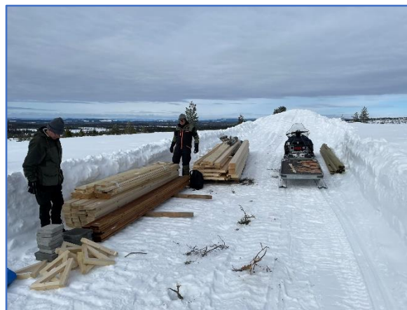
Utkjøring av materialer til gapahuken på Vesl-Svaen

I tillegg til fellesdugnader, er det flere som i omfattende grad tar et tak på egenhånd. Her kan nevnes vedlikeholdsarbeider på klopper, reparasjon bruer, vedhogst og generelt stivedlikehold. Våre ivrigste dugnadsarbeidere utførte i tillegg en stor restaureringsjobb for almenningen ved Svarttjernskoia og ved Hølmyrkoia, der både stall og koie fikk nye sylstokker. Stallen i Hølmyrkoia fikk i tillegg mye ny kledning.