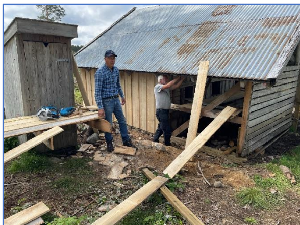
Restaurering av stallen ved Hølmyrkoia

Gjennom sommerhalvåret deltar mange aktivt i en eller flere av våre fellesdugnader. Gjerne 5-6 møter opp på mandager som er fast dugnadsdag. Det er registrert 412 timer på 27 fellesdugnader i 2023.