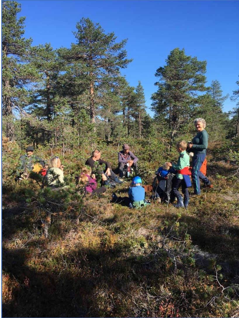
Befaring på «Tårntomt» ved Savalsæterhøgda