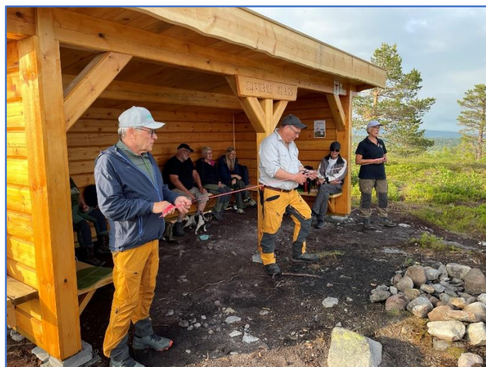
Fra åpningen av Gunnars plass på Vesl-Svaen

Kretsen disponerer flere koier i almenningen som vi har vedlikeholdstilsyn for. Det er kun overnattingskoiene Svartskogkoa, Savalsætra, Målia og Snippkoa som har fast tilsyn. De øvrige befares mer tilfeldig og så langt som vi har sett, framstår de i rimelig bra stand. På oppdrag fra almenningen ble det som tidligere nevnt, utførte noen av våre dugnadsfolk store vedlikeholdsarbeider på stall og koie ved Hølmyrkoa og på Svarttjernskoia. Utover dette består koievedlikehold stort sett av rengjøring og arbeid med vedforsyning.