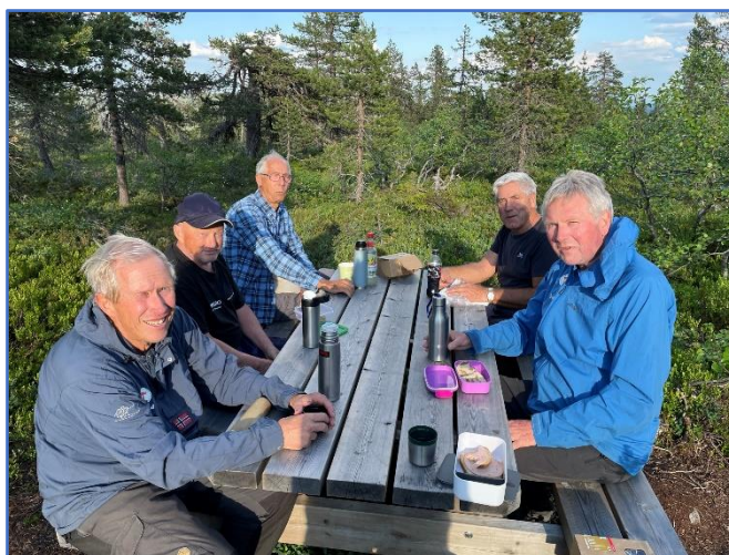
Det sosiale er viktig

Også i 2023 har vi lagt ut en hel del nye klopper, men mest av alt har vi vedlikeholdt gammel og nedtråkket klopping. Fjerde året på rad har vi fått en bra mengde impregnerte materialer fra Moelven Industrier. Riktignok i ukurante dimensjoner, men fullt brukbare til vårt bruk. Alt benyttes til fornying og vedlikehold av klopping. Vi fikk tidlig på våren tydelige signaler om å få til en sammenhengende og farbar sti rundt Mosjøen. Det var en særlig bløt 650 meter lang strekning på vestsiden av sjøen som nesten ikke var farbar. Noen hundre meter med klopper og en 3,5 kilometer runde rundt sjøen var klar, og ble øyeblikkelig tatt i bruk av turgåere.