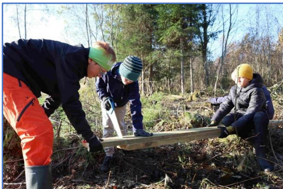
Elever fra Jønsrud skole i gang med stien mellom skolen og Furasaga

Rektor mente dette var et fint prosjekt for elevene og skolen, og med støtte fra oss i kretsen, skal de inngå grunneieravtaler og utføre alt det praktiske som etablering av en ny sti medfører. Skolen er allerede godt i gang med stien som skal åpnes med snorklipping og hurrarop før skoleslutt i 2024.