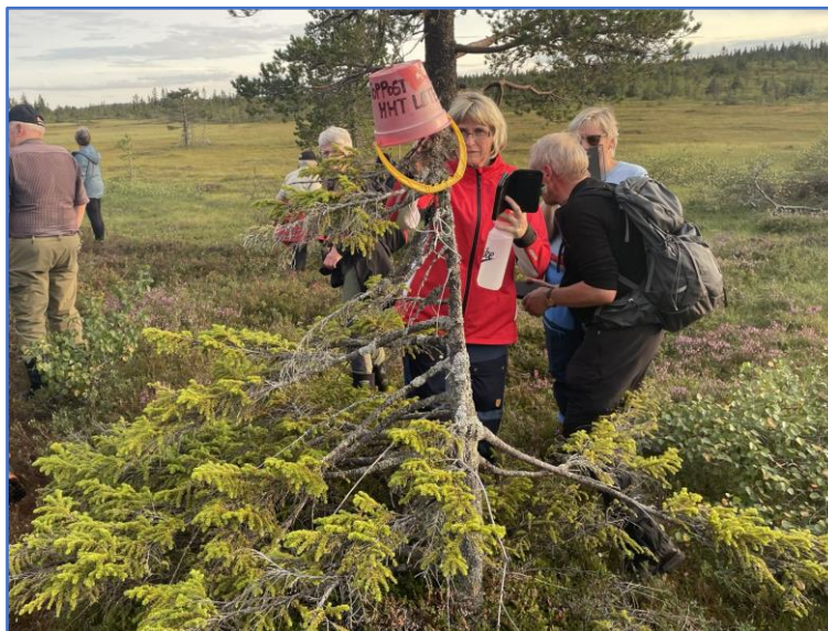
Turposten på Kløvmyrkjølen