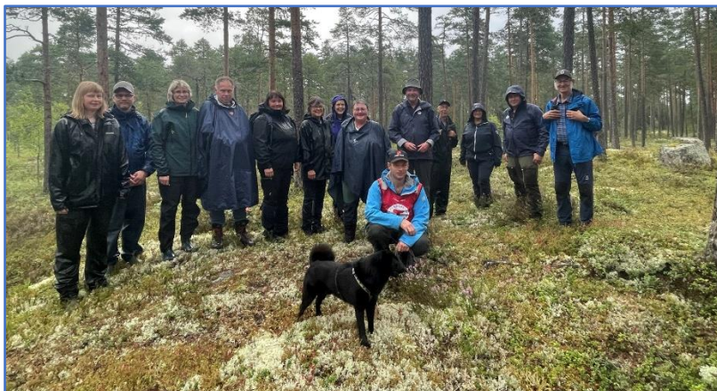
Deltakerne på Tirsdagstramp nummer 400