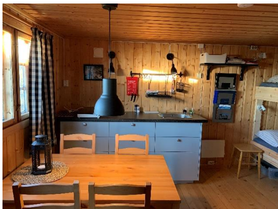
Stenfjellhytta anneks som ble ubetjent overnattingshytte.

Det er svært hyggelig å konstatere et rekordhøyt tall på overnattinger på hyttene våre i 2022 . Det er første hele året med fast system med bestillingsmulighet på halvparten av sengene. Visbook bestillingsløsning for hytteovernatting utvikles til å bli et bedre og bedre system som vi håper kan gjøre at enda flere bruker overnattingshyttene våre.