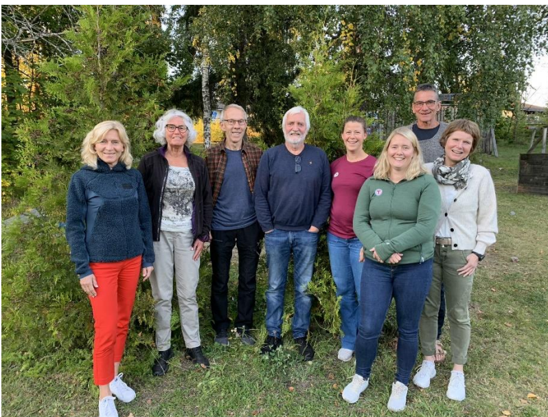
Styret i HHT i 2022