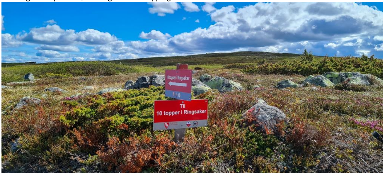
Merking av 10 topper i fjellet

10 topper i Ringsaker (med undertittel 10 topp turer) er svært populært for folk i alle aldersgrupper. Styremedlemmer i kretsen legger ned mye arbeid i planlegging, merking av turene og nedtaking av merking. 5186 postbesøk er registrert via app og innleverte deltakerkort.