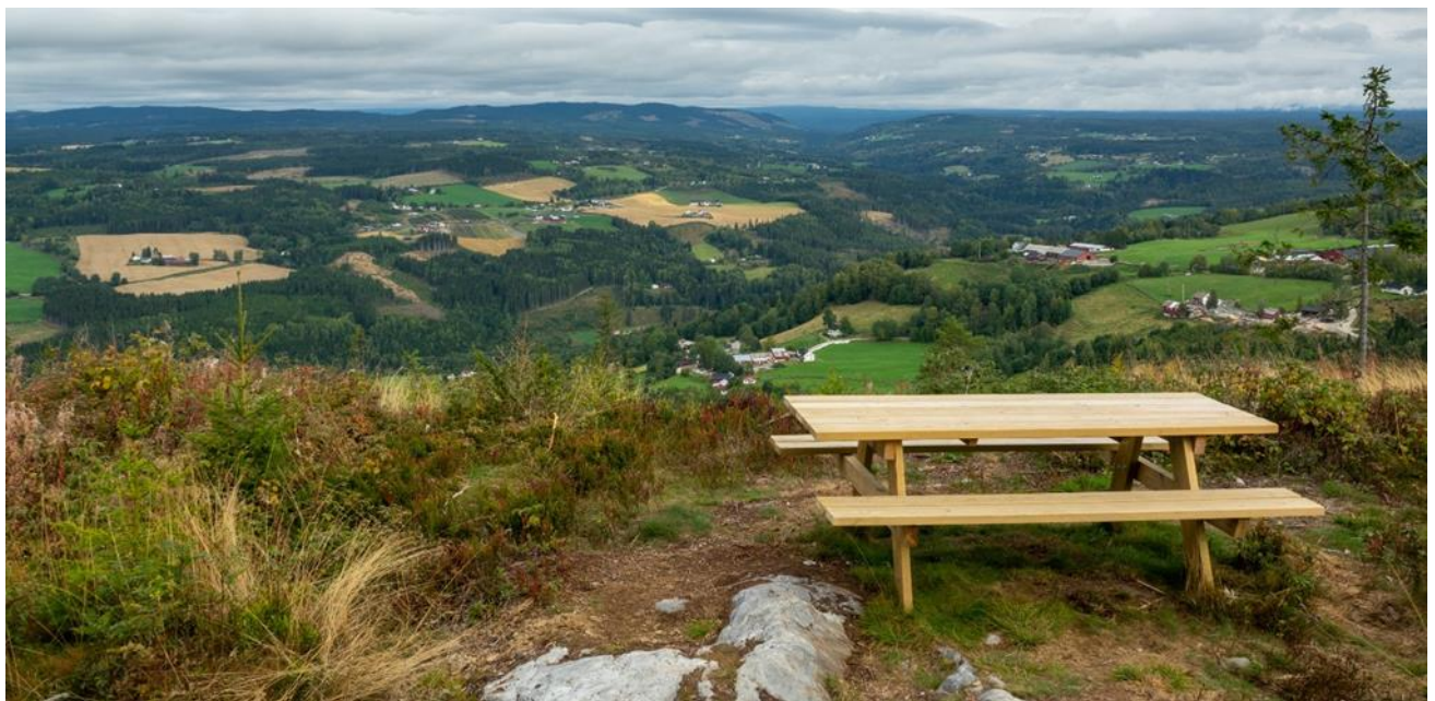
Ny benk ved Majorstua

Av arbeidet som er utført i 22-sesongen kan nevnes legging av flere klopper på Birkebeinerstien mellom Nysetra og hyttefeltet i Stalsberglia. Det er utplassert 3 rastebenker på fine «kvilesteder» og mye kvist- og grasrydding.