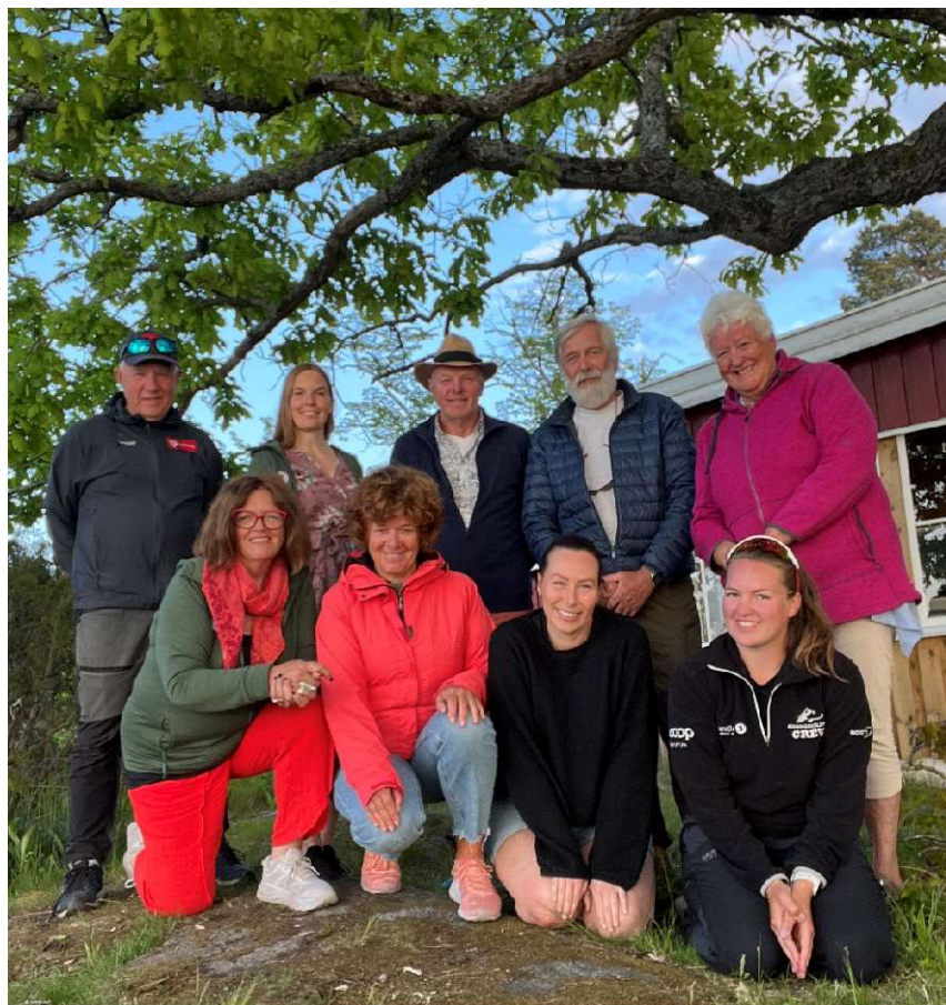
Styremøte på Padlehytta juni 2023.