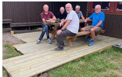
Fornøyde karer med ny plattning

Stor takk til helgevertene og komiteens medlemmer for godt utført arbeid i 2023.