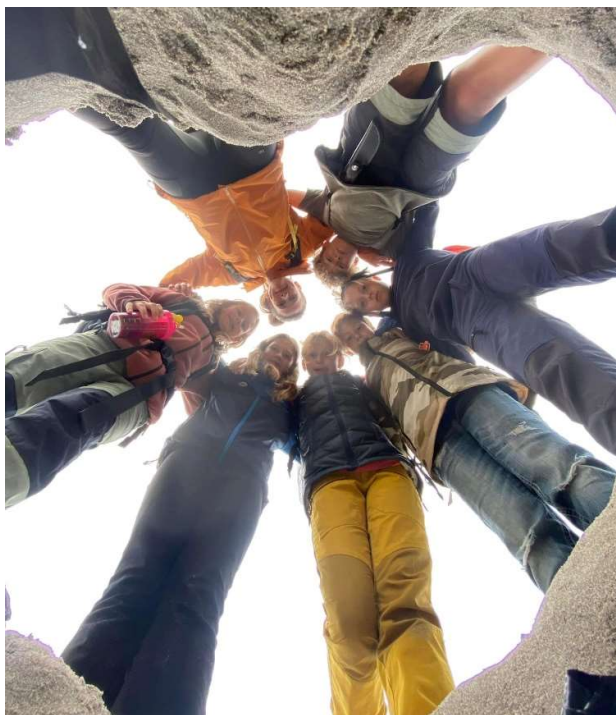
Tur til Rakke med Turboklubben i september 2023.

I Turboklubben har 19 påmeldte 4.-7. klassinger hatt samlinger en fast kveld i uka. På denne Turboklubben deltar barna uten foresatte, og barna blir godt kjent med hverandre. Turområdet varierer fra uke til uke. Fritidstilbudet har fokus på natur og friluftsliv som læringsarena. Barna har lært om temaer som sporløs ferdsel, mat på bål og livet i fjæra. De har gått på små toppturer, bygd fuglekasse, lagd seljefløyte, klatret og vært på sopptur. Flere fikk også en første erfaring med utenetter da de var på overnattingstur i telt/hengekøye på Ølbergholmen og på vintertur til Presteseter.