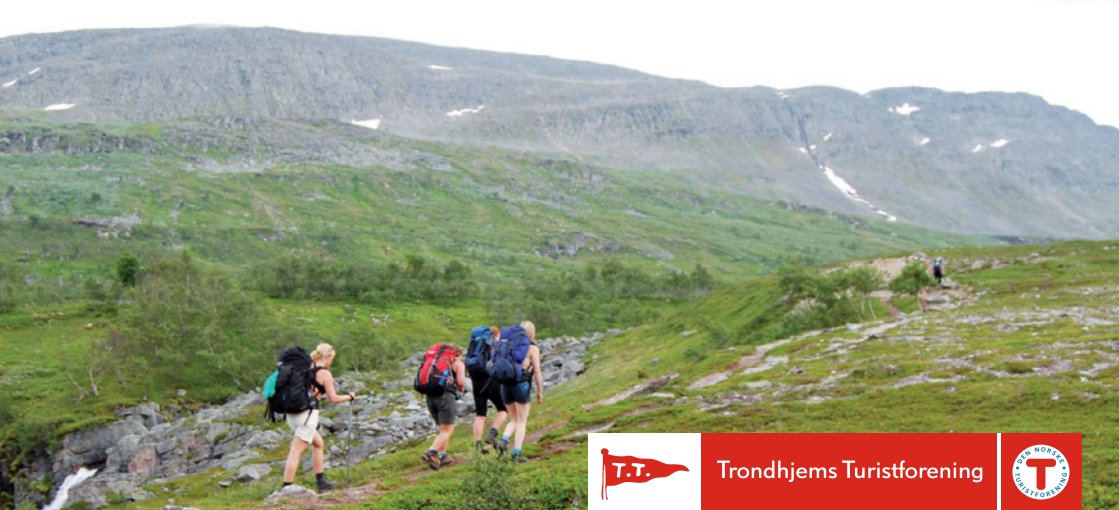
Fra oppstigninga mot Geithetta i Trollheimen.