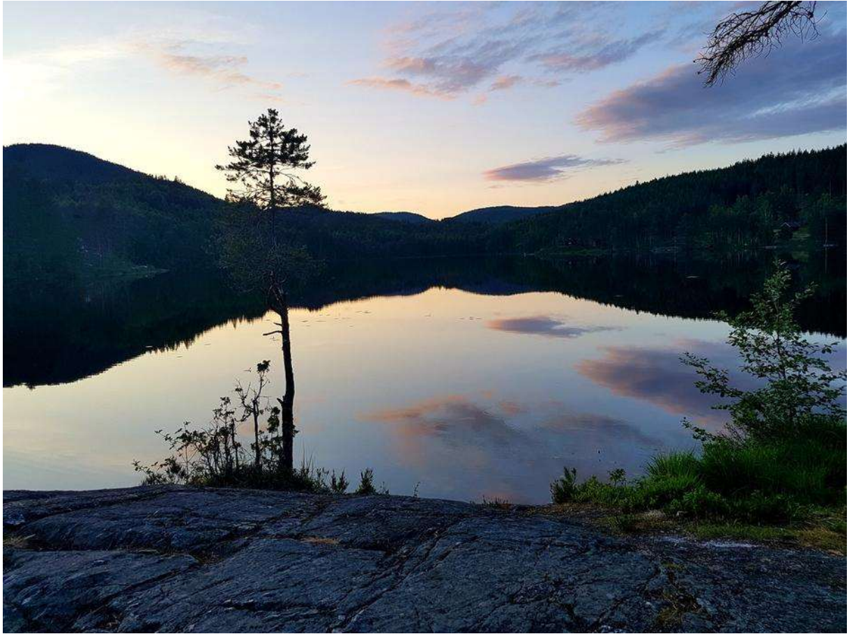
Nydelige Setertjern.