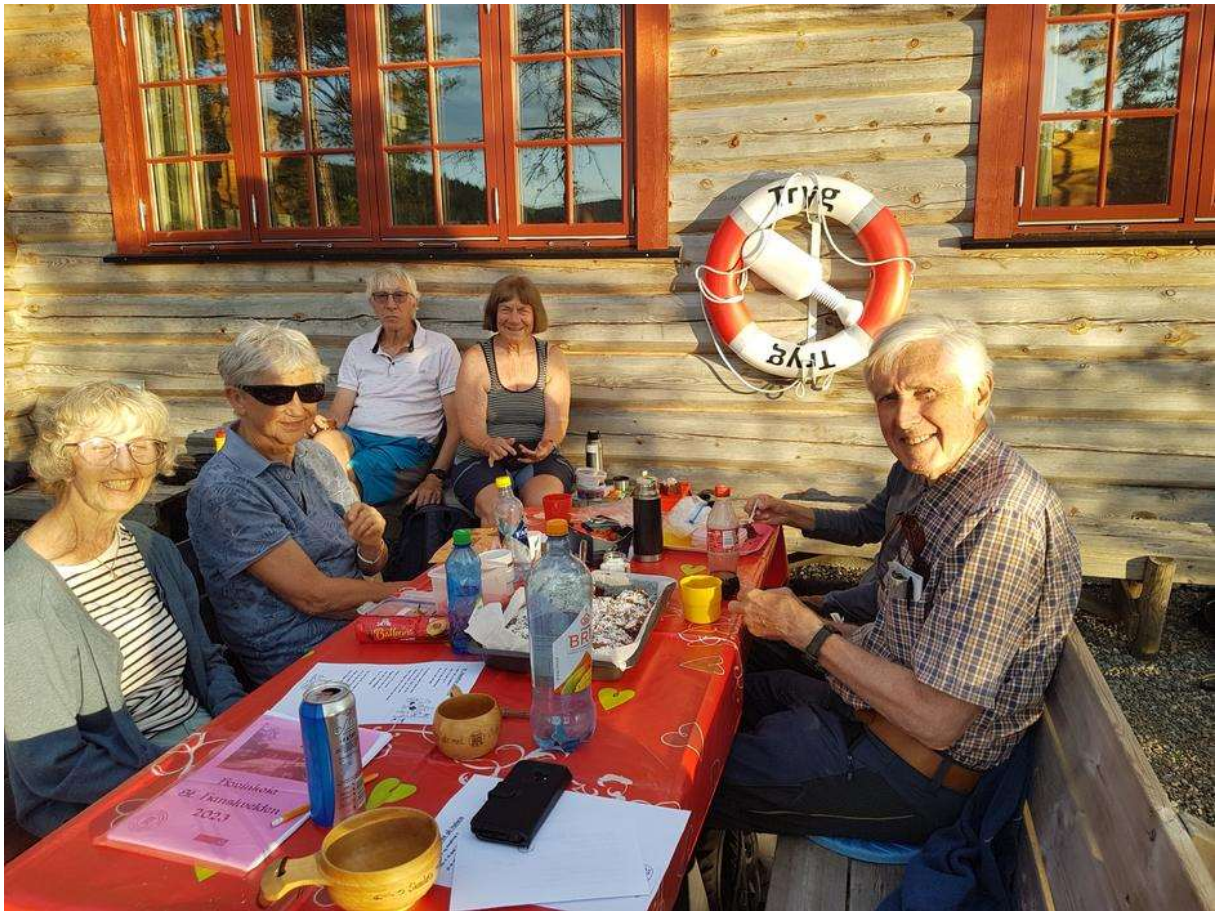
Fornøyde deltakere nyter kvelden.