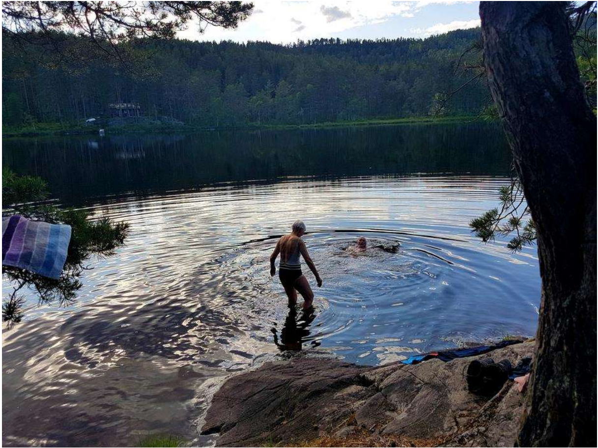
Godt med en dukkert.