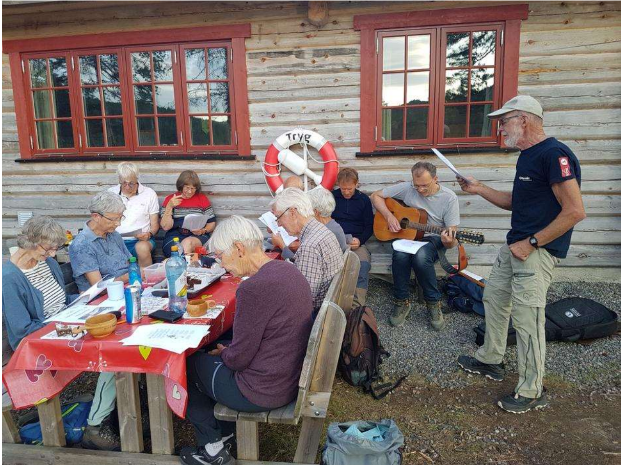
Flinke sangere feirer kvelden.

15 deltok på en trivelig kveld fredag 23. juni.