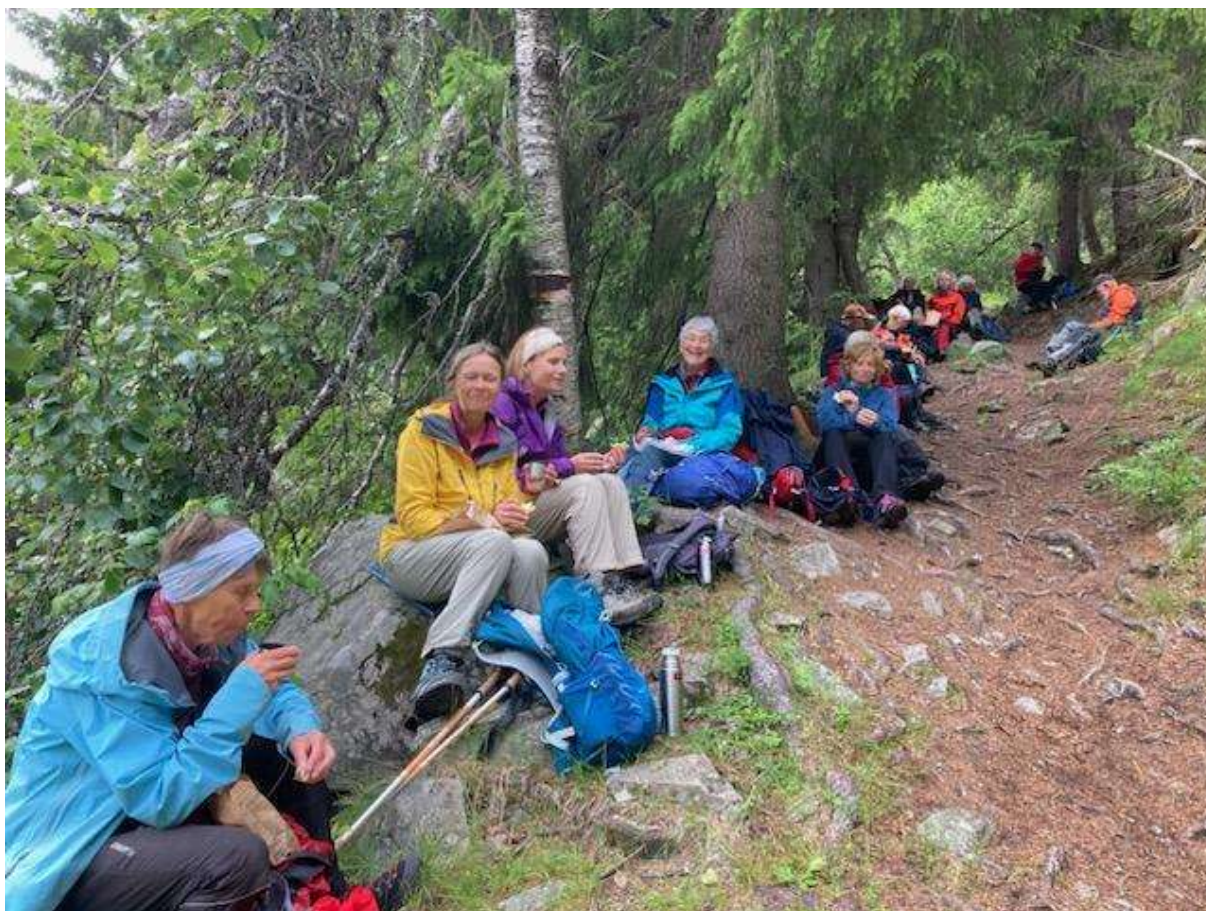
Matpause på Sabotørstien.