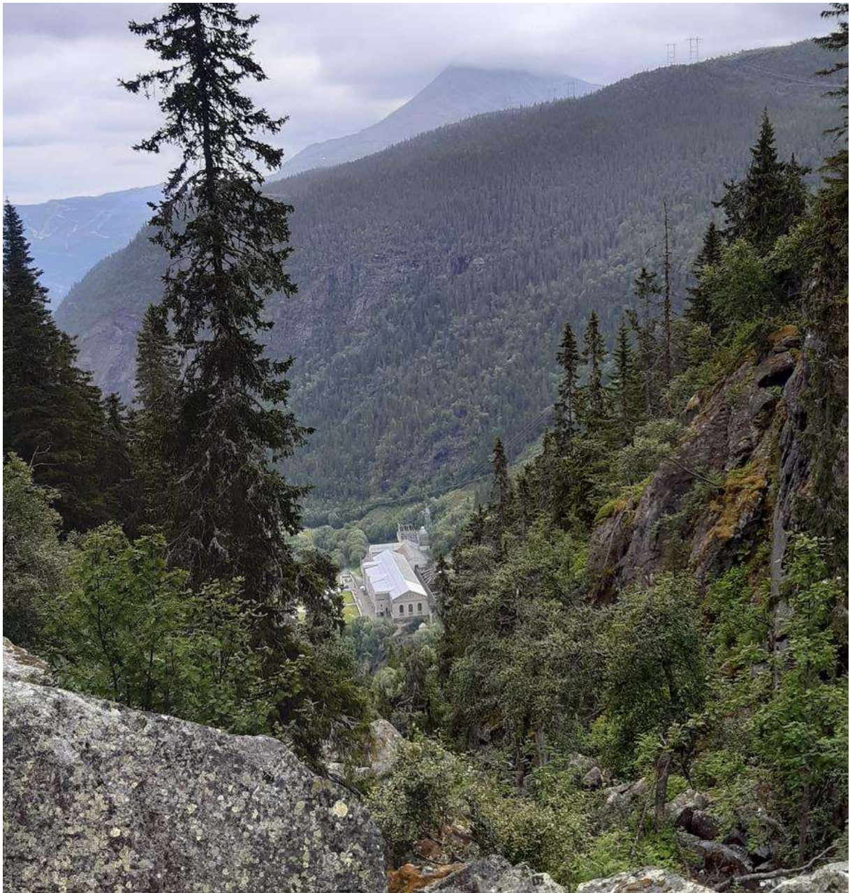
Utsikt fra Sabotørstien mot Vemork.