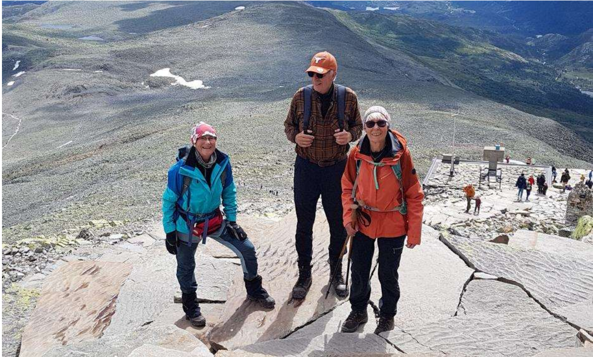
Utsikt fra Gaustatoppen mot stien vi klatret opp.