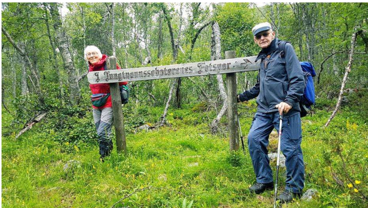
I tungtvannssabotørens fotspor.