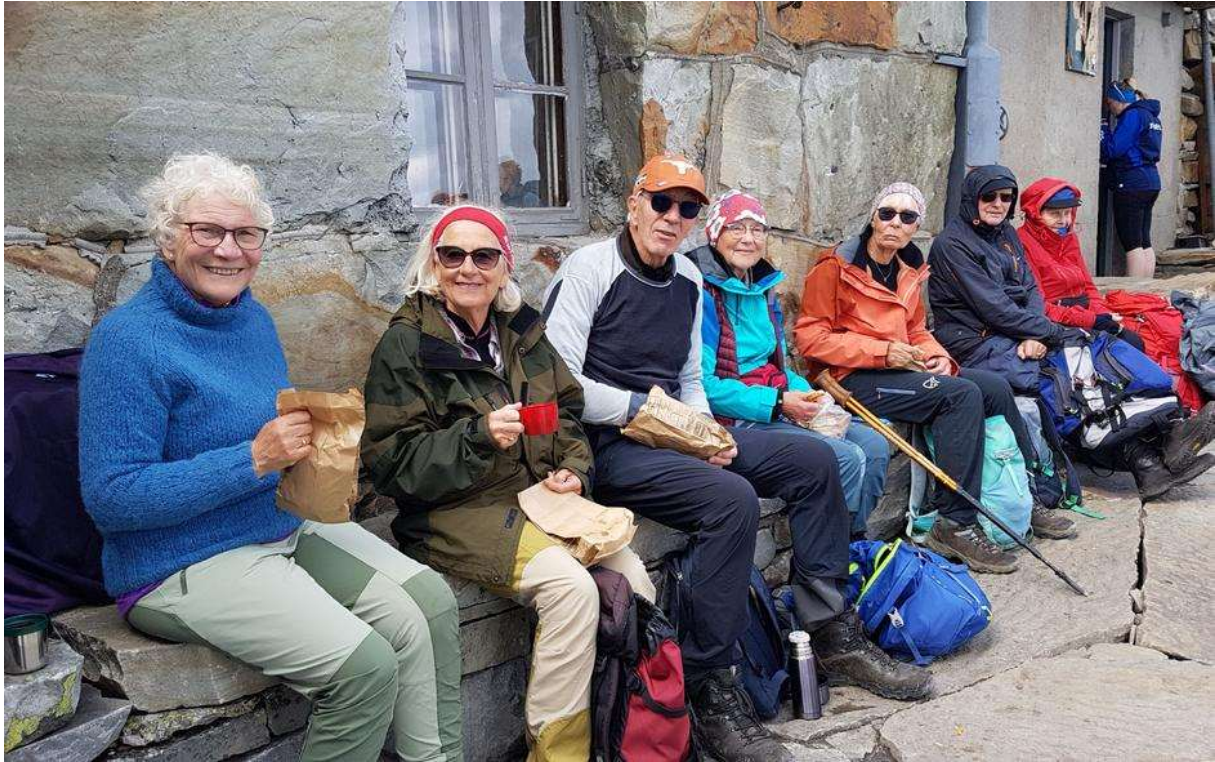
Noen av turdeltakerne ved kafeen på Gaustatoppen.