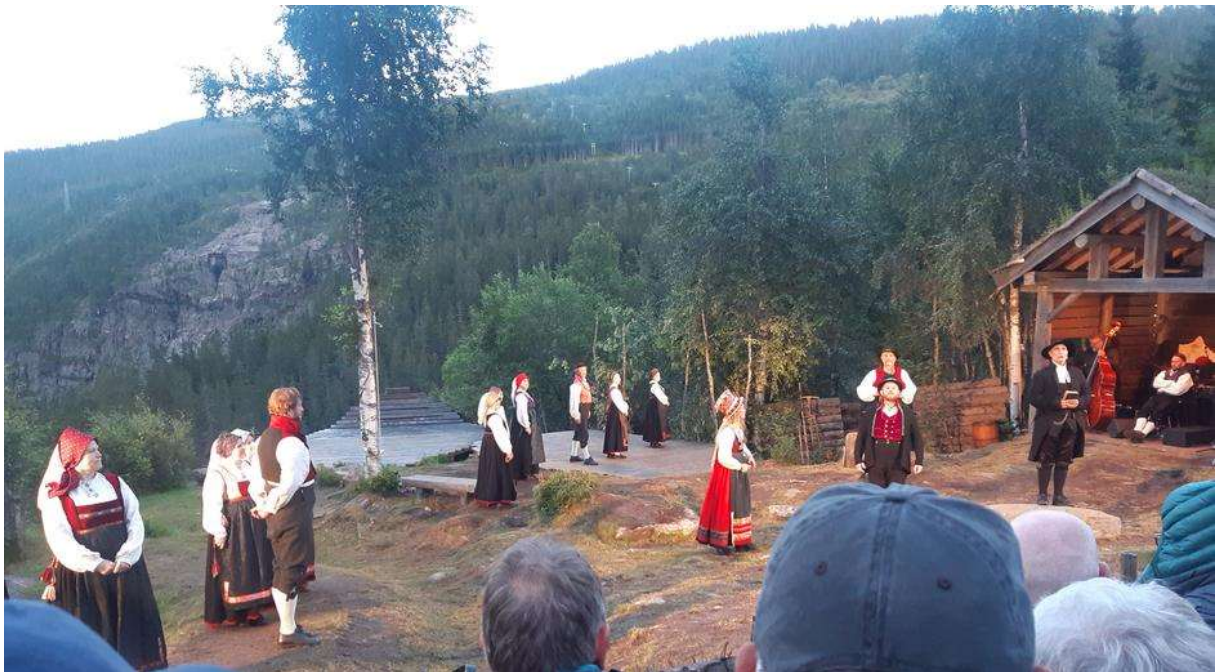
Scene fra Marispelet.

Referat ved Per Stubbraaten - med bidrag fra Axel Holt.