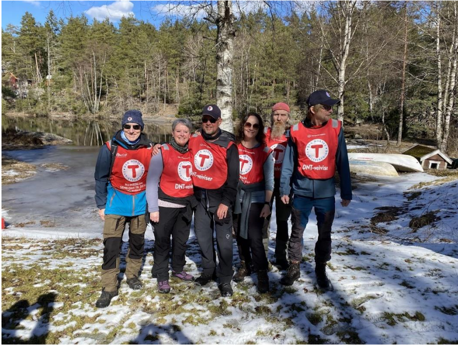
Turledere og frivillige for turen «Børtevatnets bakgård»