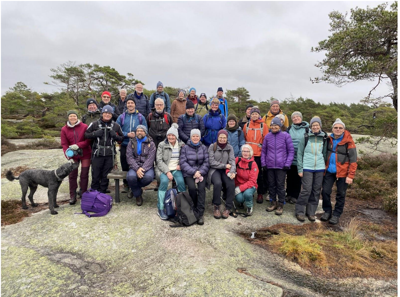
Fine turfolk på årets siste tur, Kråkerøy

Et mål for oss for året var å øke antall turer til de vakre kystområdene våre, og åtte turer er vel vandret i spennende kystlandskap på Vesterøy, Søndre Sandøy, Kirkøy, Kråkerøy, Asmaløy, Ullerøy og i Engelsviken. Vi ønsket oss også en likevektig fordeling av turer mellom de tre kommunene Sarpsborg, Hvaler og Fredrikstad, og dette har vi klart med god margin.