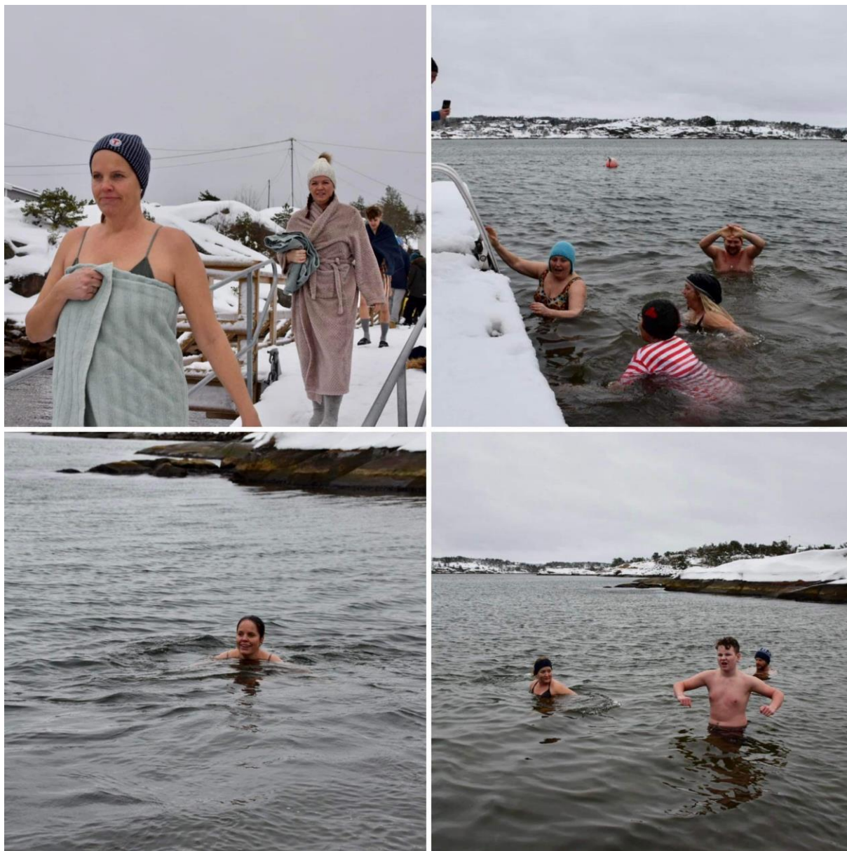
40 tøffinger avsluttet året med nyttårsbad på Pynten, Kråkerøy!!

2023 ble et år med stor aktivitet, både på tur- og dugnadsfronten. Heldige er vi, som kan se tilbake på et år med høy deltagelse på våre turer og aktiviteter! At driften av foreningen går så bra er helt og holdent avhengig av de mange dugnadshender som bidrar med stort og smått gjennom hele året. Styret retter en stor takk til alle frivillige i DNT Nedre Glomma for den gode innsatsen i 2023!