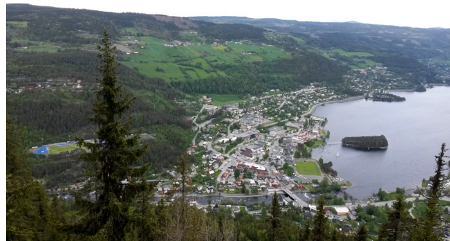
Utsyn mot Fagernes og Reinheimsbygda.