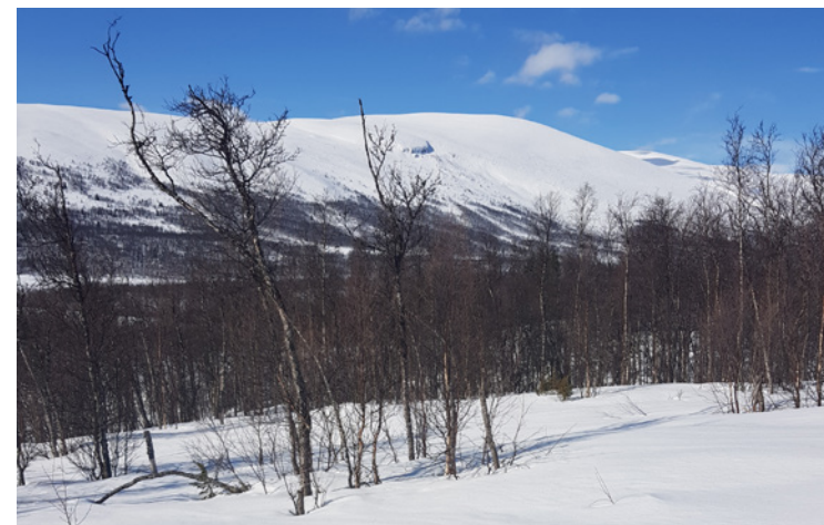
Mot Gråkampen.

Turlleder: Linda Wickstrøm 416 97 914 eli-wick@online.no