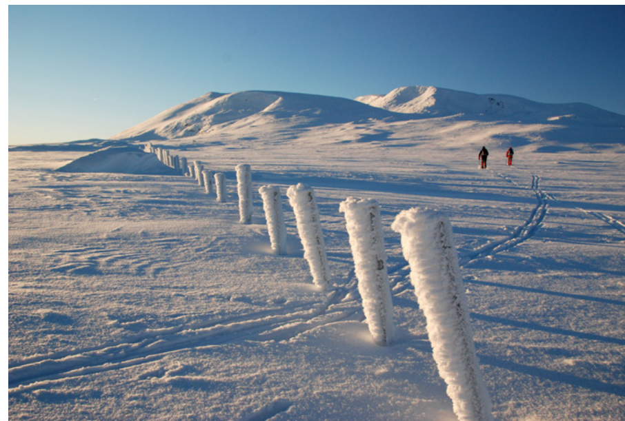
Kaldt men flott på Valdresflye vesle julaften i 2018.

Turleder: Linda Wickstrøm 416 97 914 eli-wick@online.no