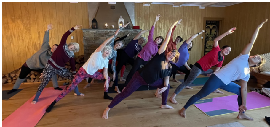
Flere av turene også i år kombineres med yoga.

Turleder: Linda Wickstrøm 416 97 914 eli-wick@online.no