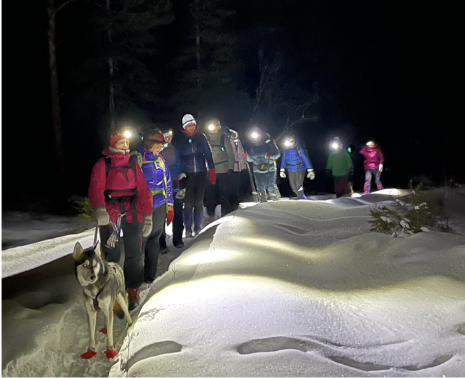
En stor gjeng damer på trivelig kveldstur.