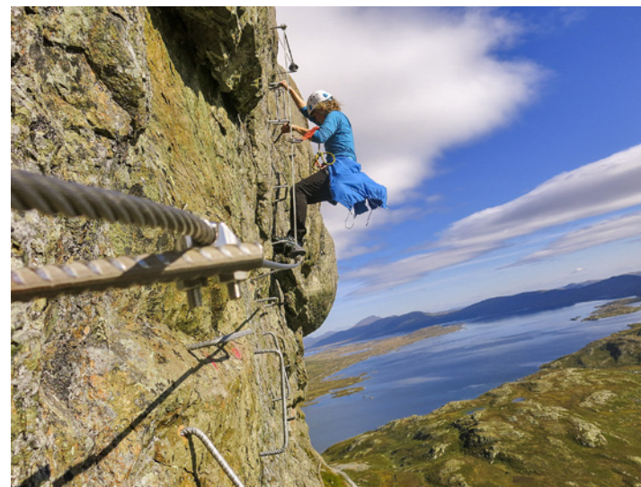
Luftig og spennende – og trygt sikret.

Fra 2022 starter vi et to-årig prosjekt for å videreutvikle DNT Ung, i samarbeid med blant andre Valdres friluftsråd. Vi har søkt og fått 340 000 kr i støtte fra Gjensidigestiftelsen til prosjektet, der det vil bli holdt bl.a. turlederutdanning, merkekurs, skredkurs, kajakk-kurs, brekurs, dugnader samt andre friluftaktiviteter og friluftscamper. Dette vil skape sosiale møteplasser i friluft, og målet er at flere unge er fysisk aktive, får lære nye ting, kjenne på mestring. Viktig ellers er å få til en god organisering slik at aktivitetene fortsetter når prosjektperioden er over.