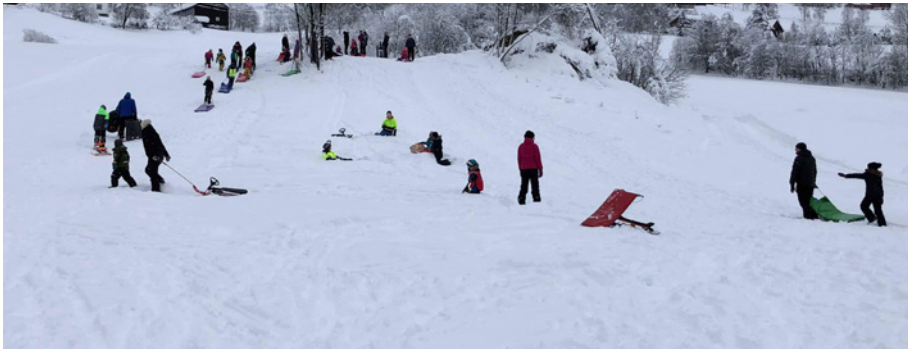
Fra en tidligere akedag i Barnas Turlag.