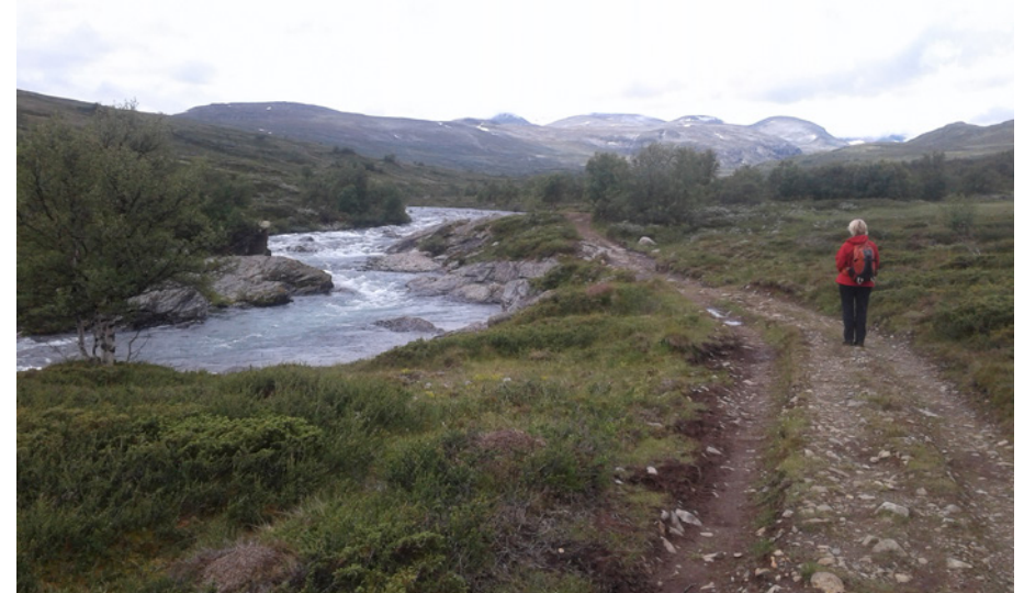
Oppover langs Russa.

Turleiar: Bjørn Vegard Johnsen 481 42 002 mahanse@online.no