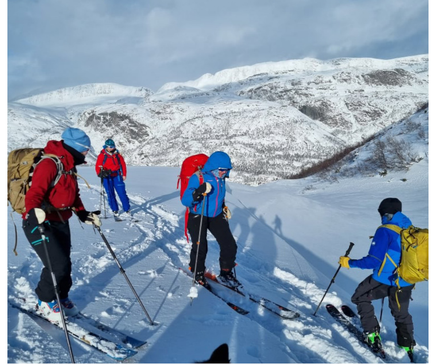
Nysgjerrige kursdeltakere.