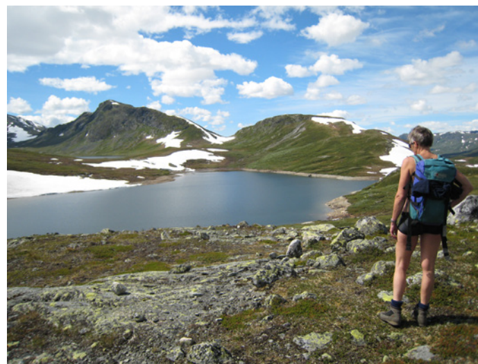
Mot store (t.v.) og vesle Sendehornet.

Turleder: Nina Horn Steindebakken 934 84 091 n-steind@online.no