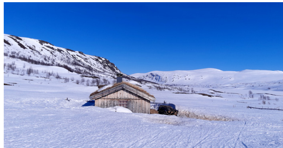
Sandbakkbu i Heimdalen sist i april.