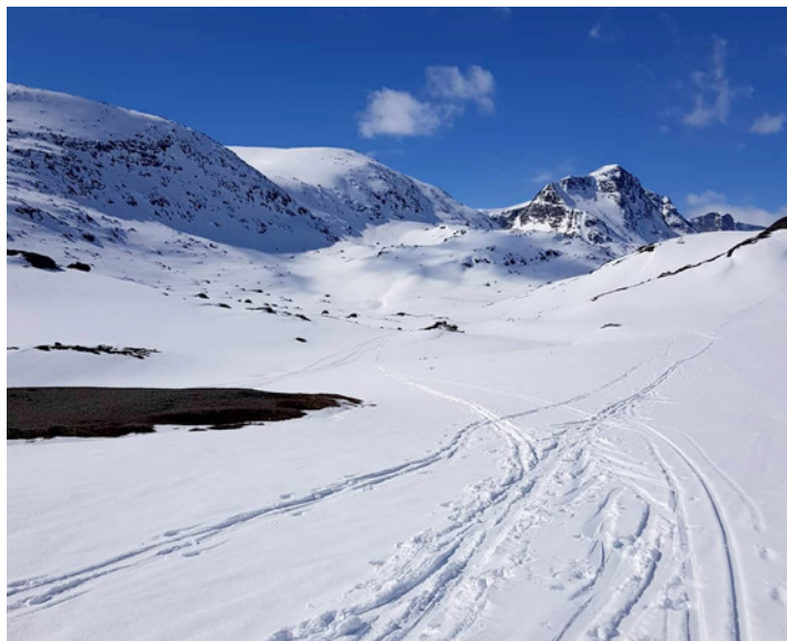
Innover Leirungsdalen, mot Munken.

Turlleder: Helga E. Waagaard 924 56 251 helgaew@yahoo.no