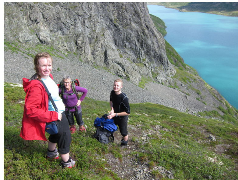
Høgt i oppstigninga langs Jo-stigen fra Gjende.

Turleder: Helga Waagaard 924 56 251 helgaew@yahoo.no