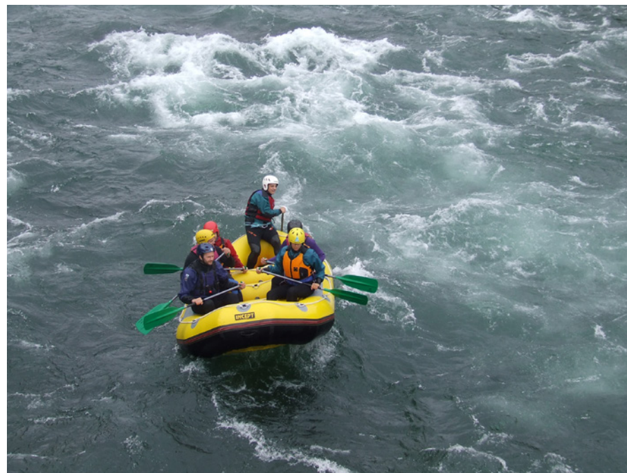
Vi starter nå et 2-årig prosjekt med aktiviteter rettet mot unge (13 – 26 år)