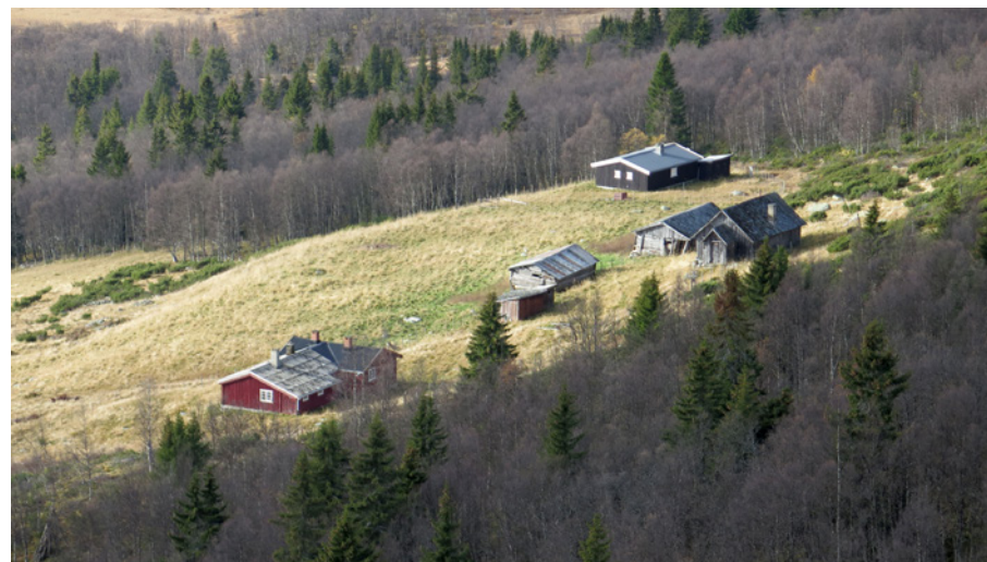
Skriulægeret sett fra observasjonsposten oppi lia.