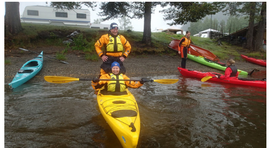
Sjøsetting av kajaker.