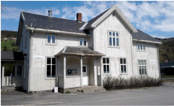
Fagernes stasjon.