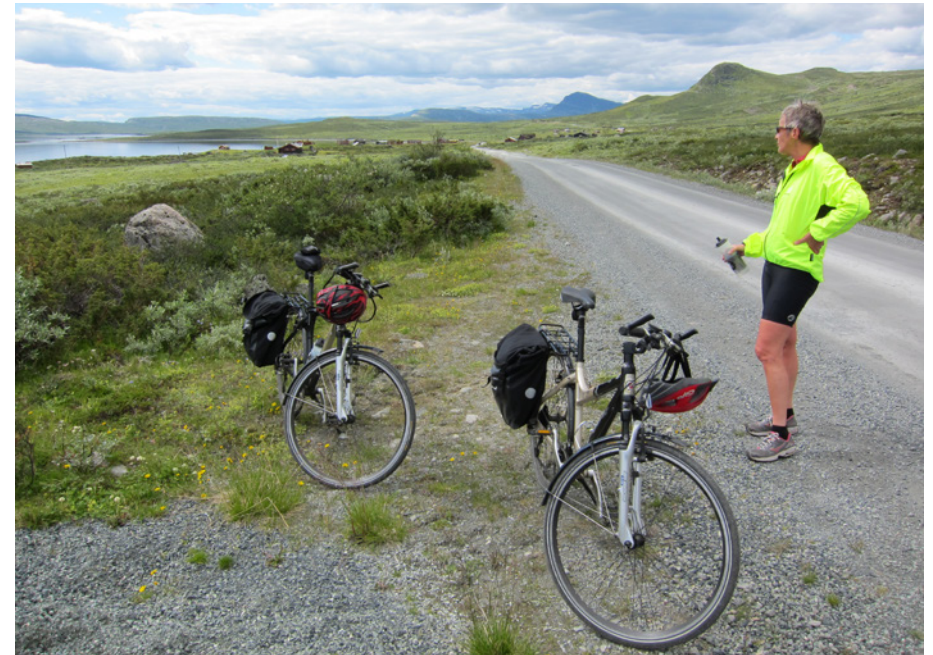
På Jotunheimvegen litt aust for Haugseter, med Urekkollen bak t.h.