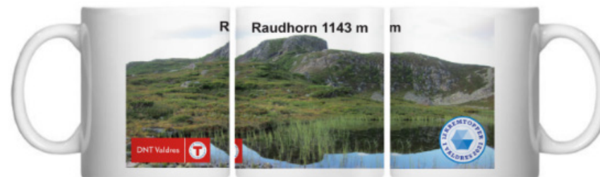
Kruset som var premie i 2021, med Raudhorn som motiv.