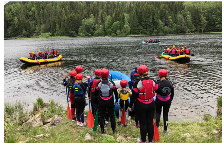
En spent gjeng venter på å komme i gang.