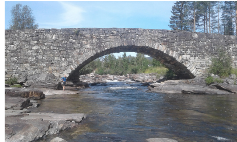
Lundebrue.