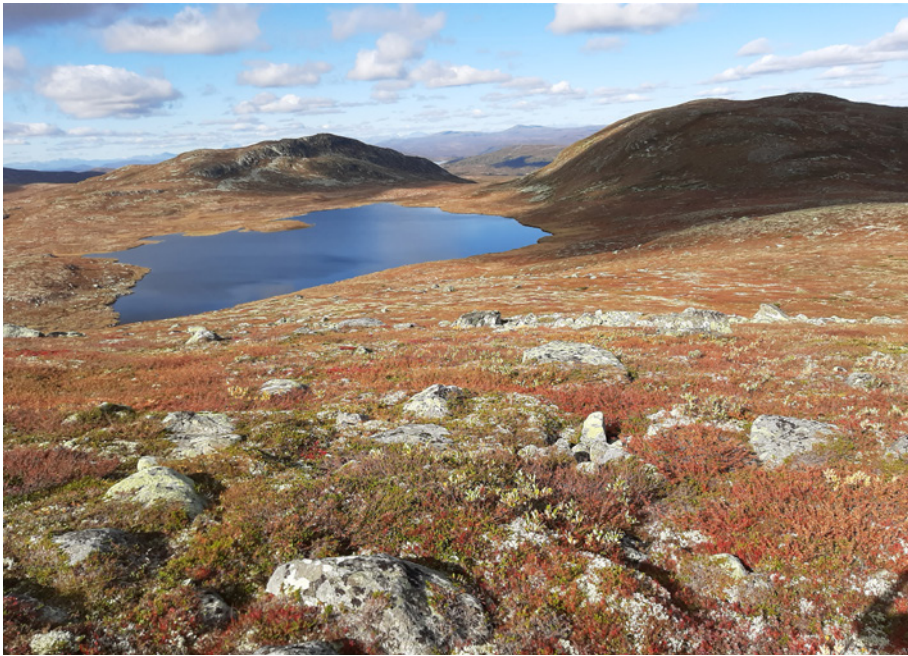
Et tjern ligger idyllisk til mellom de mange kollene.