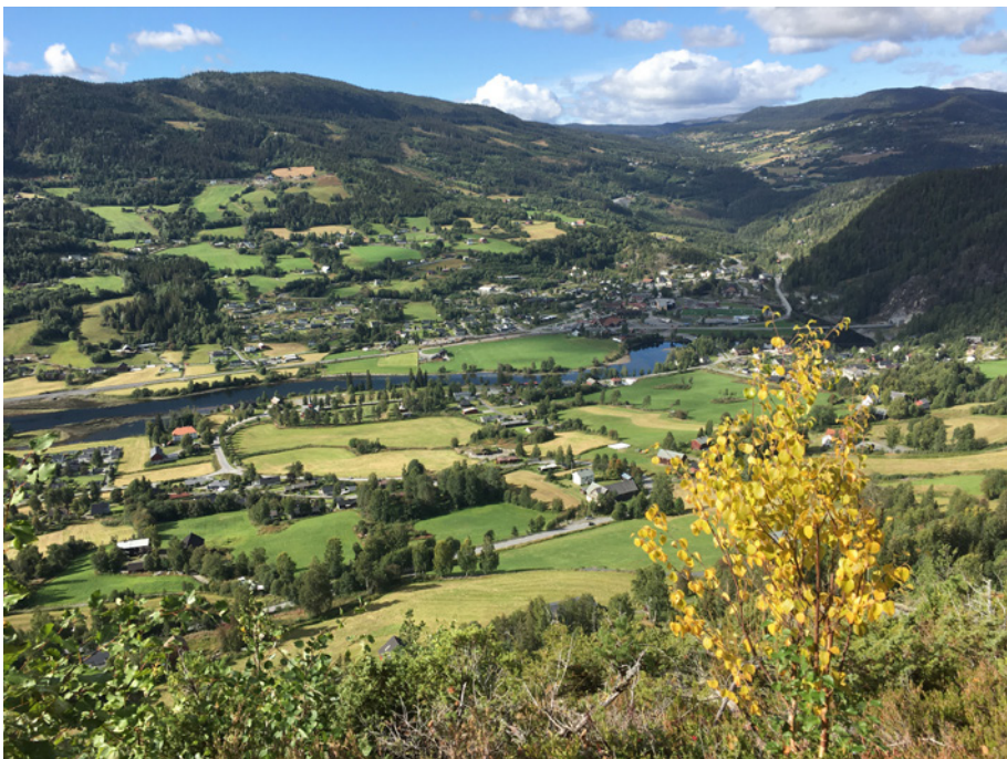
Utsikt fra Londonberget mot Bagn.