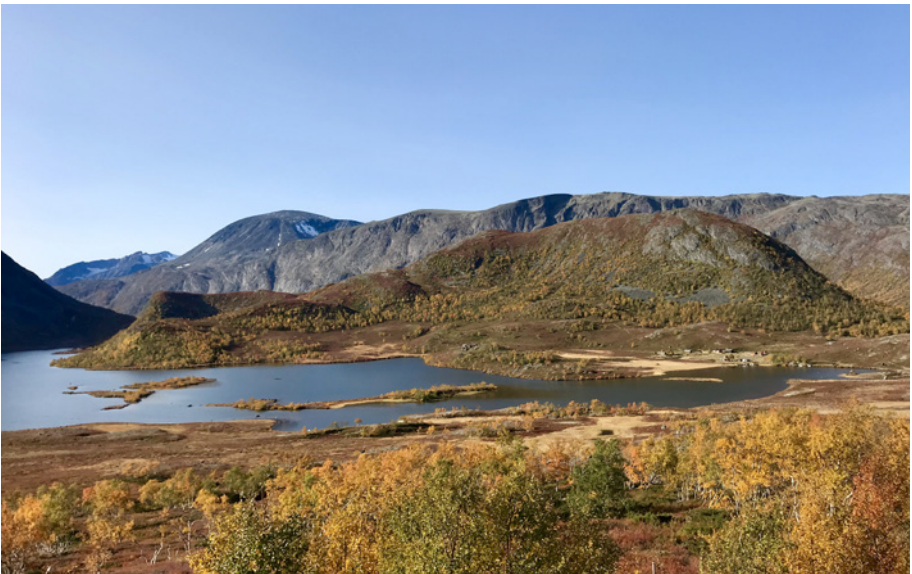
Til Gjendeshø (i forgrunnen) er det tur 2. oktober.