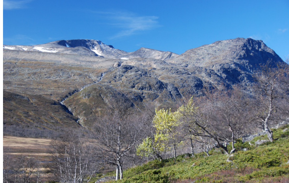
Mot Høgdebrotet (t.v.), Kvassryggen og Bukkehamaren.

Turleder: Anne Reidun Tvenge 975 22 091 annereidun@msn.com