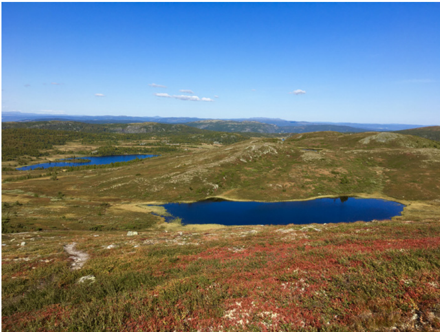
Et veldig trivelig område, ikke minst for høstturer.