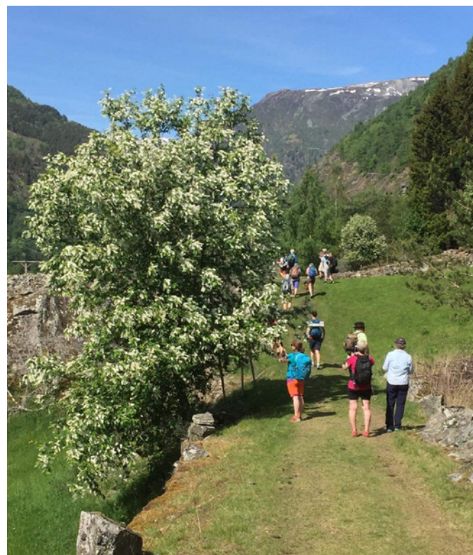
Langs Kongevegen over Filefjell.

Turleder: Trond Vatn 918 60 320 trond.vatn@dnt.no