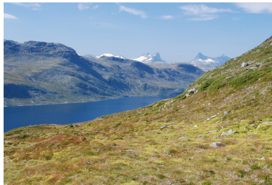
Langs den nye DNT-stien mellom Torfinnsbu og Eidsbugarden.