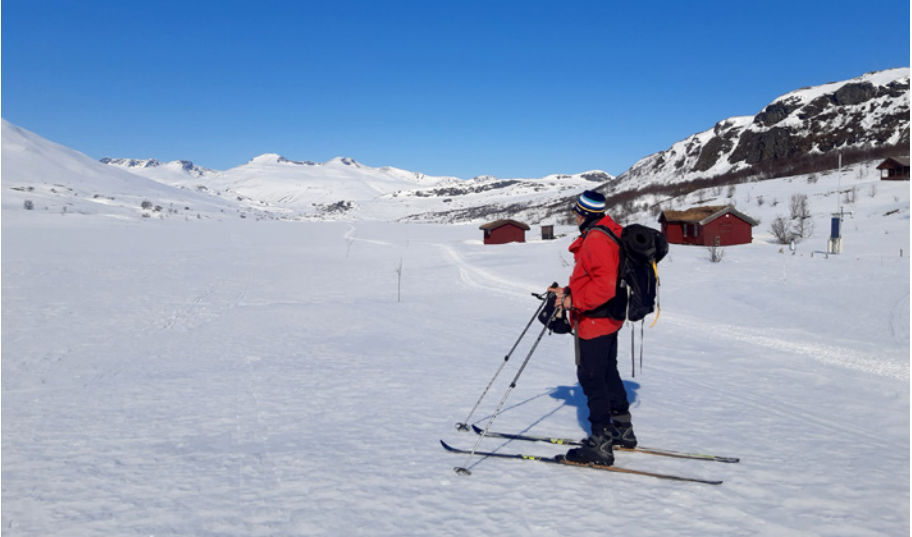
Ved Osbue i Heimdalen. Det blir tur hit sist i april.