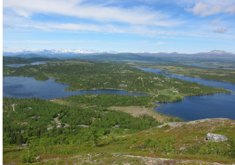
Fra Rabalsmellin mot vatn, vidder og fjell, fra Galdeberg til Skaget.

Turlleder: Dienne Versteeg 926 24 165 dienneversteeg@hotmail.com