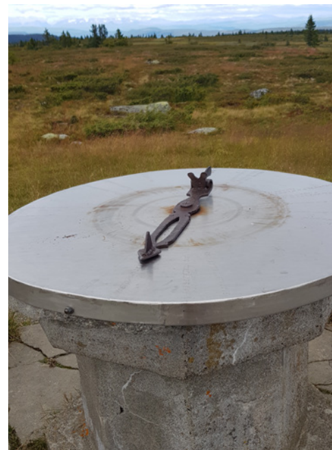
Siktesskiva på toppen.

Turleder: Steinar Kvåle 928 91 245 kvaale.steinar@gmail.com