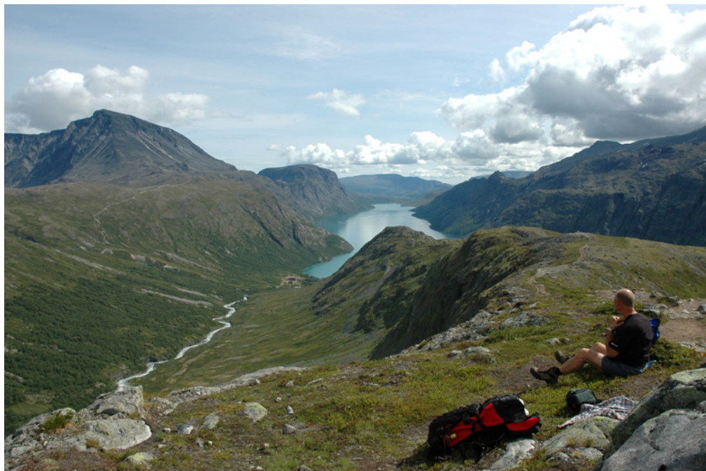
Ned mot Sjogurdstinden og Memurubu, Besshøe og Besseggen bak.

Turleder: Trond Vatn 918 60 320 trond.vatn@dnt.no