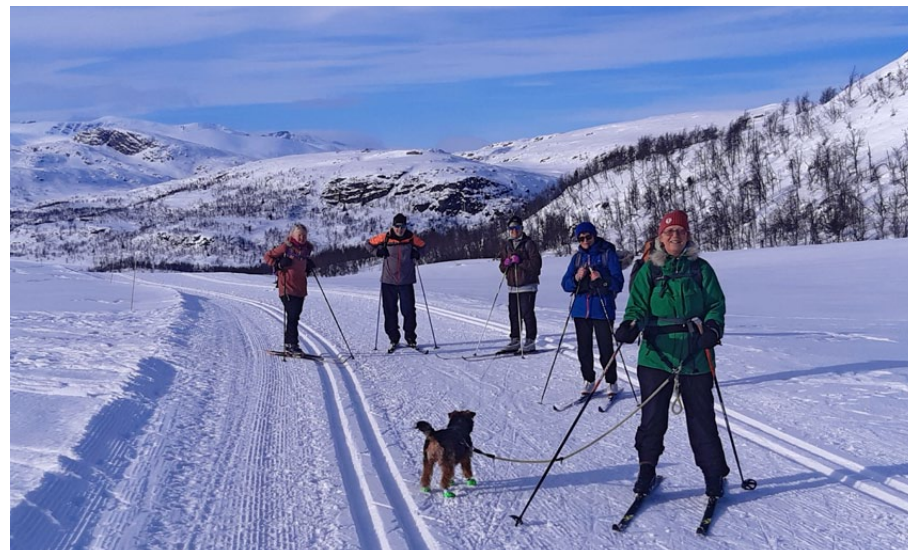
Fint utsyn ved Tutjerne, under Knauserunden.