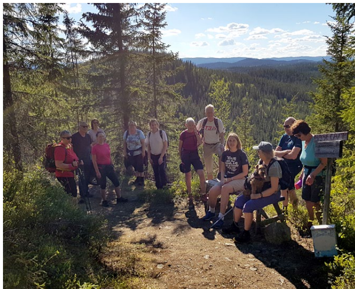
Frodigere ved «Base-camp» her enn langt i øst.