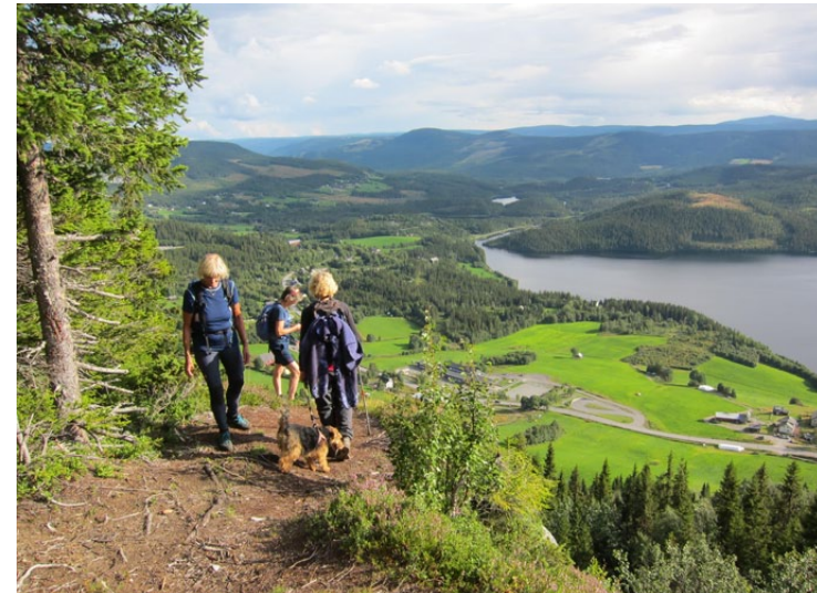
Flott utsyn frå berget over Flagget, blant anna mot Hedalsfjorden.