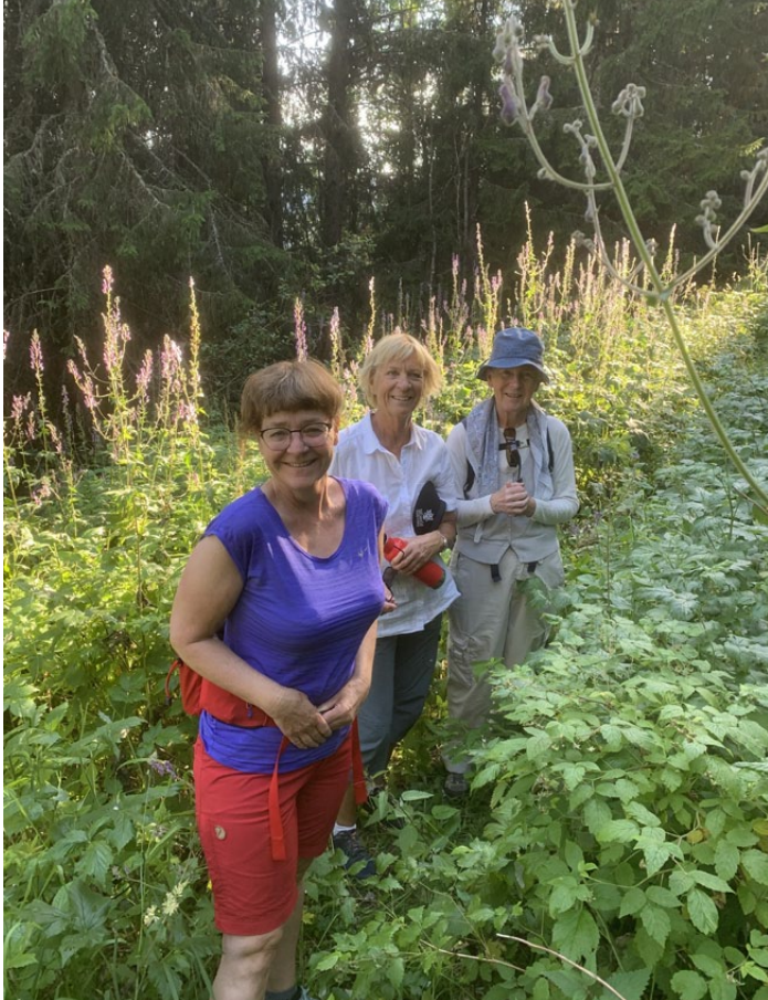
Underveis ble det både historie og frodig planteliv.