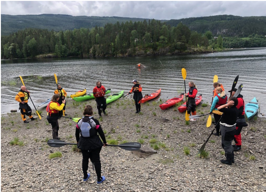
Instruksjon på land før prøving på vannet.