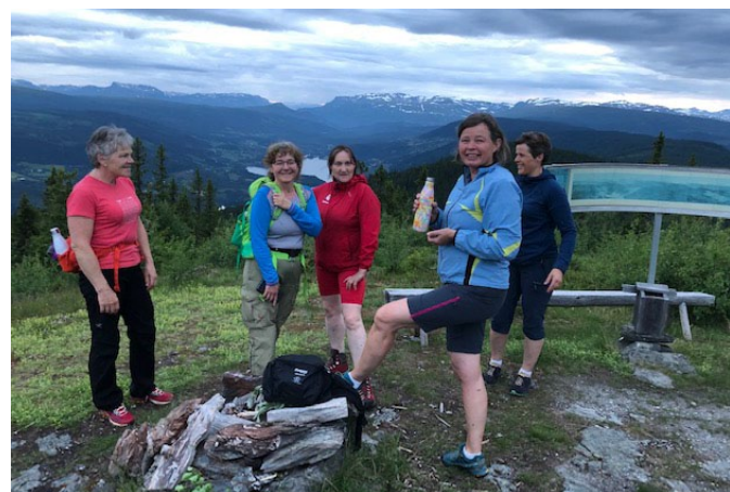
På vestre utsiktspunkt på Kvithovd, mot Vestre Slidre.

fluer). På toppen valgte vi først å nyte utsikten mot Vestre Slidre. Her rakk vi den siste rødfargen på himmelen i det solen hadde gått ned. Så kikket vi litt på det tidligere hotellet, før vi gikk til utsiktspunktet mot Øystre Slidre. Her tok vi en liten matpause mens vi nøy utsikten og stillheten. Deretter gikk vi tilbake. Det ble kommentert at konseptet Natt-tur i natur var en god idé.