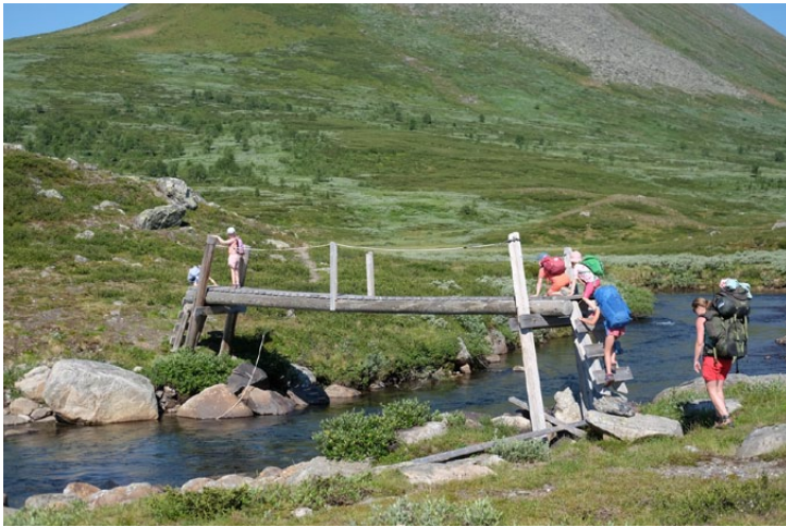
På brua over Smådøla.

Vel fremme fant vi fire fine teltplasser og tok fram fiskestengene. Det tok ikke lang tid før nest minstemann hadde fast fisk! Stor stas for fiskeren og alle andre som kom løpende for å sjå.