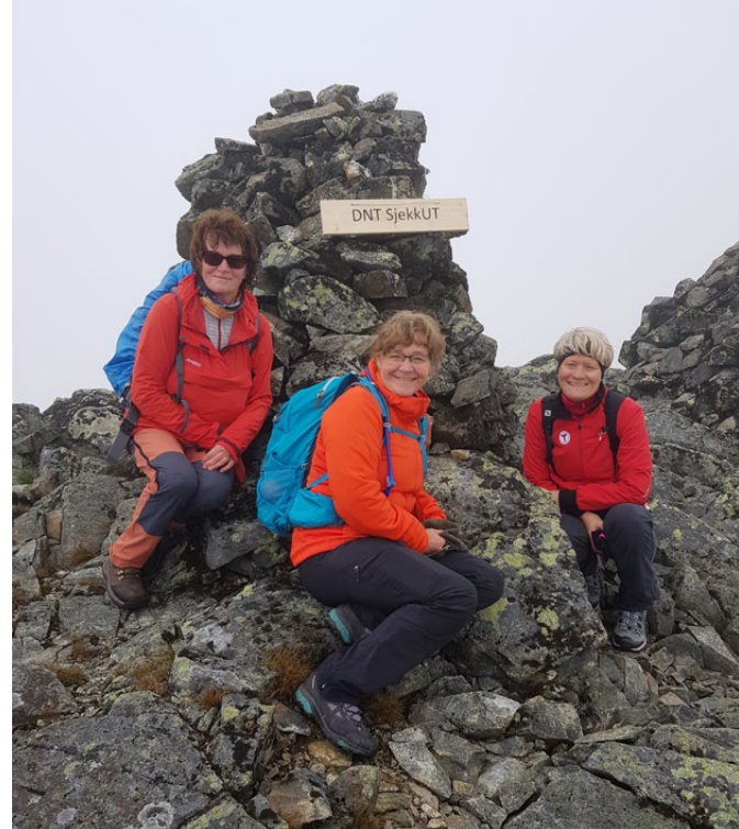
Skiltet på vestpunktet ved Kruk på Gilafjellet kom på plass.

Vi møttes kl 22 ved Slidretun, og kjørte sammen opp til Slidrestølane. Herfra gikk turen til fots, delvis på kjerrevei og delvis på sti. I alt 3 km med en stigning på ca 300 høydemeter. Det var for det meste tørt og fint å gå. Lettskyet vær som gjorde at det var lyst nok til å gå tur retur uten bruk av hodelykt (det eneste negative var