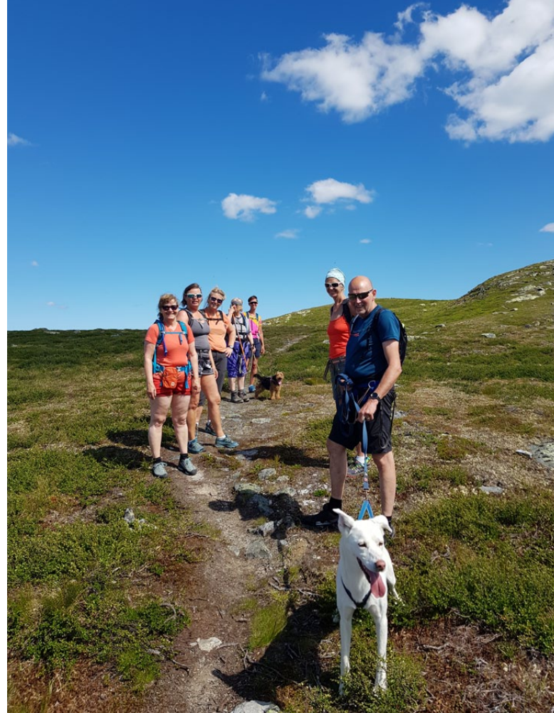
Ingen sure miner her, nei!