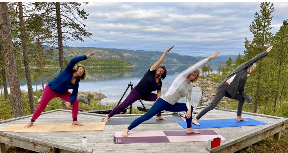
Yoga i det fri, i herlige omgivelser.