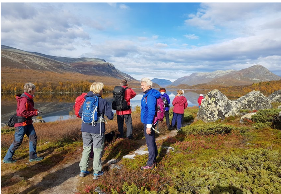
Idyllisk ved turstart frå Jaslangen.