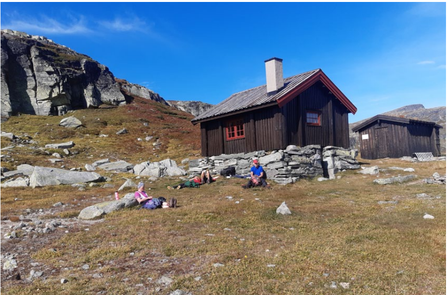
Rast ved Langsubua under seniorturen 31. august.