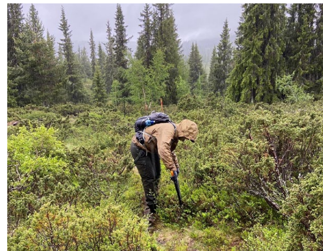
Klipping går bra selv i regnvær.