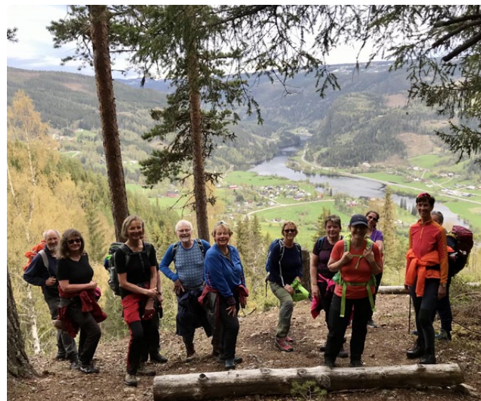
Litt før vi er oppe blir det fint utsyn ned mot Bagn.