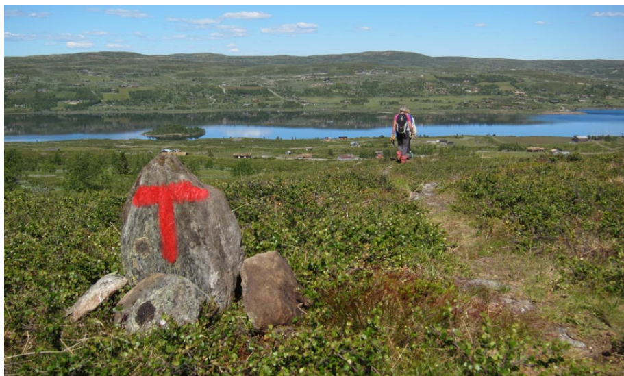
I 2018 var det merkekurs og dugnad på Stølsruta, ved Syndin.

Ei rekkje merke- og vardekurs er halde, dette for å lære dei mange frivillige å rydde og merke på en god og forsiktig måte, etter «Merkehåndboka». To kurs er halde for innsette ved Slidreøya fengsel, som har gjort en flott praksis-jobb på «Stølsruta i Valdres».