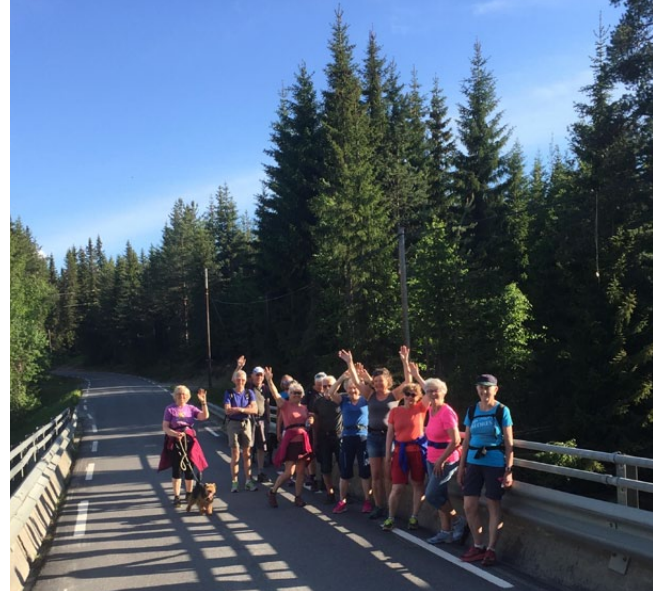
Turfølget samlet halvveis, på Mosbrue.