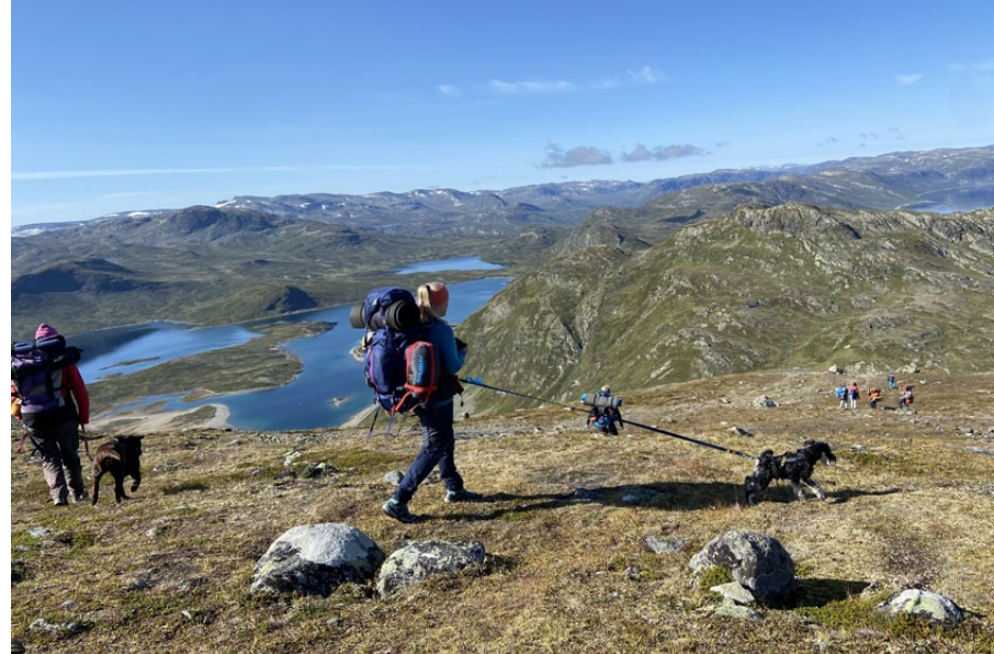
På hjemveg ned fra Synshorn.