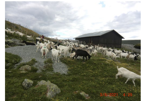
Godt fram møte ved Hølastølen.