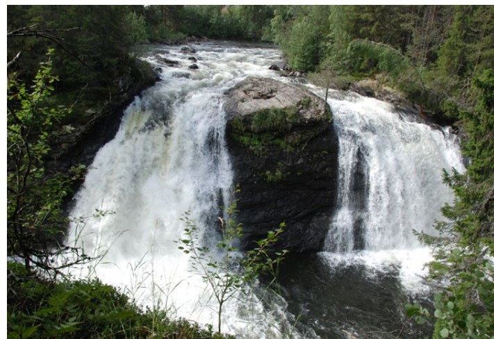
Den flotte Vindebrufossen, rett på nedsida av fv. 51.