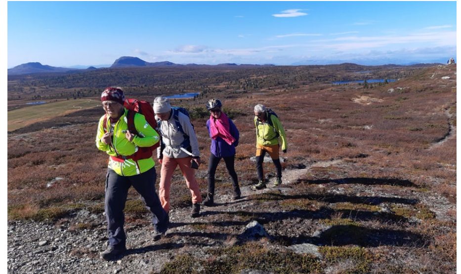
På veg attende frå Tansberghøgde til syklane.