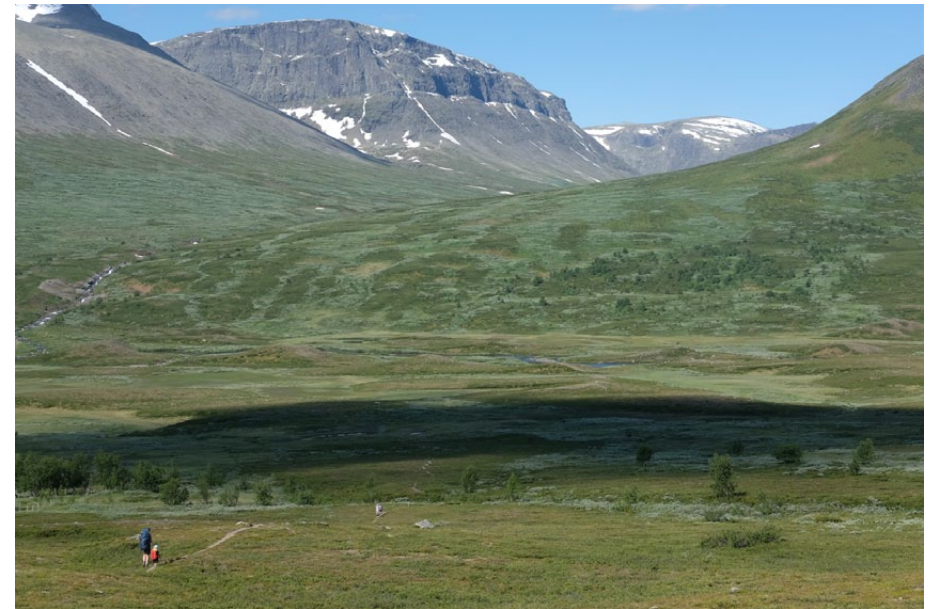
Nedover mot Smådøla, Ranastonge og Hestebøtn bak.