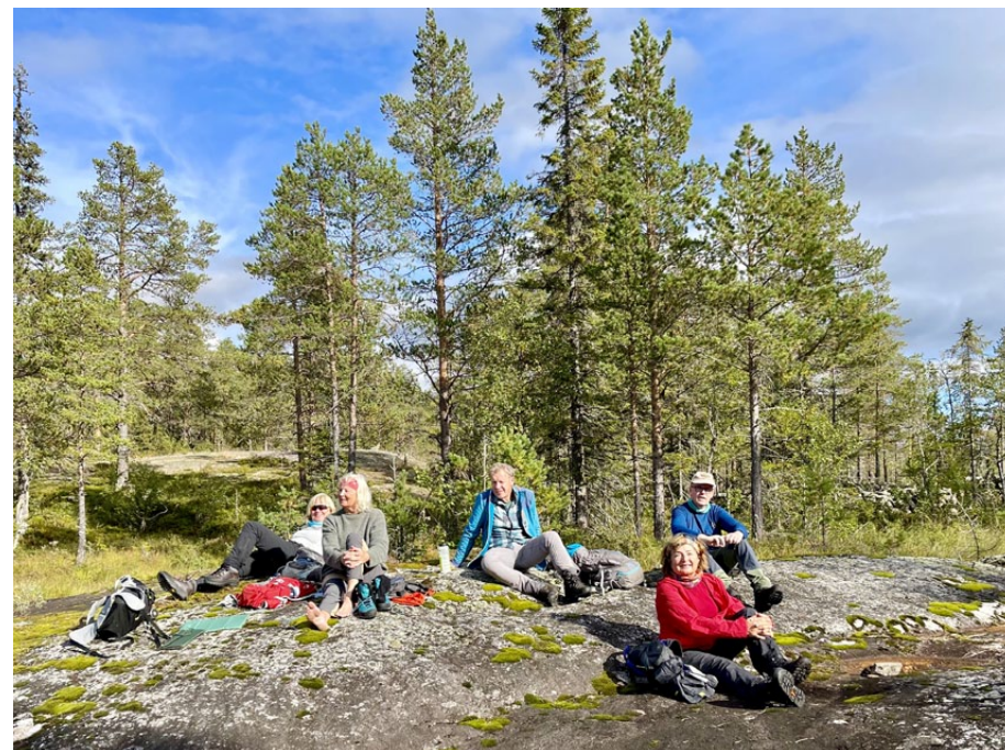
Velfortjent rast.

Alle tok del i vannbæring, vedfyring, matlaging og oppvask, og alt arbeid fløt lett og naturlig. Når regnet øste ned utover kvelden hadde vi det trygt og varmt ved middagsbordet og stemningen var god og lett.