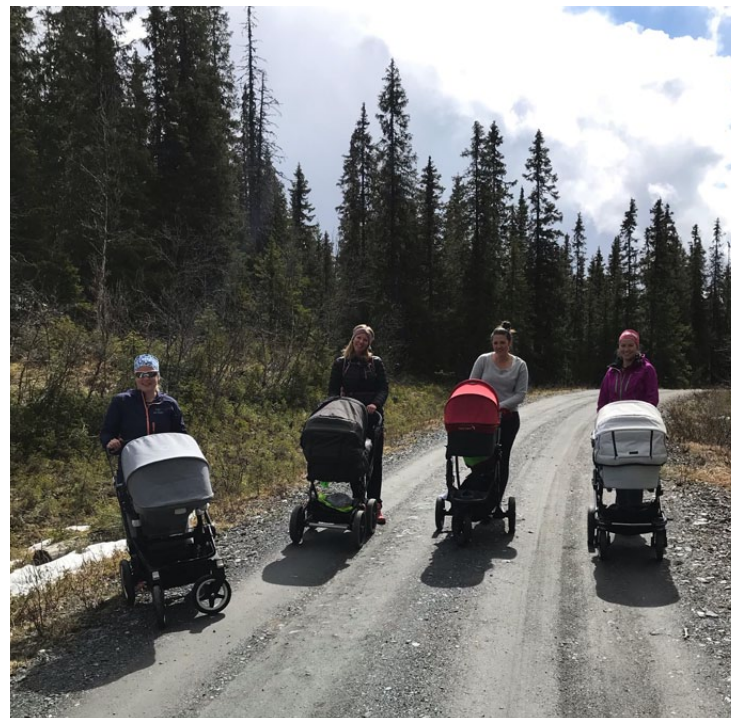
Trivelig trilletur på Magistadåsen.