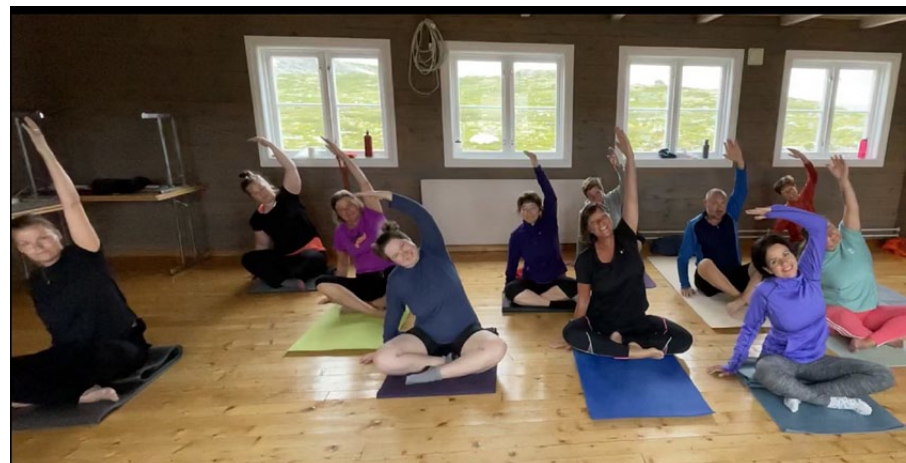
Deilige yogaøktene morgen og kveld i egen yogasal.

Til yoga-øktene fikk vi en stor, egen yogasal, der vi mjuket opp stive muskler og fikk tøyd ut etter turene fredag og lørdag, samt startet dagene med mer energikrevende yogaøkt før frokost både lørdag og søndag.