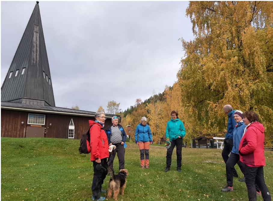
Ved Tingnes kyrkje.