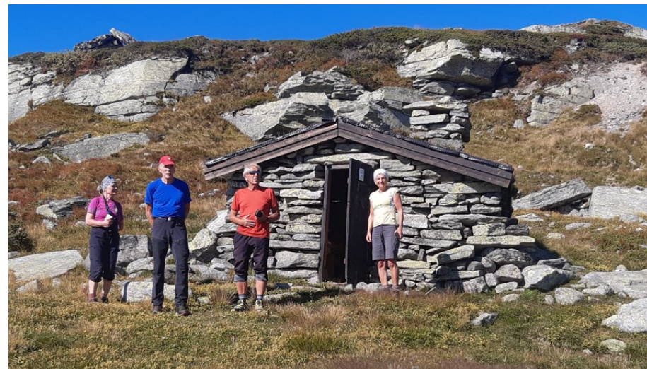
Ved steinbua som ligg rett bak Vesterheimsbua.