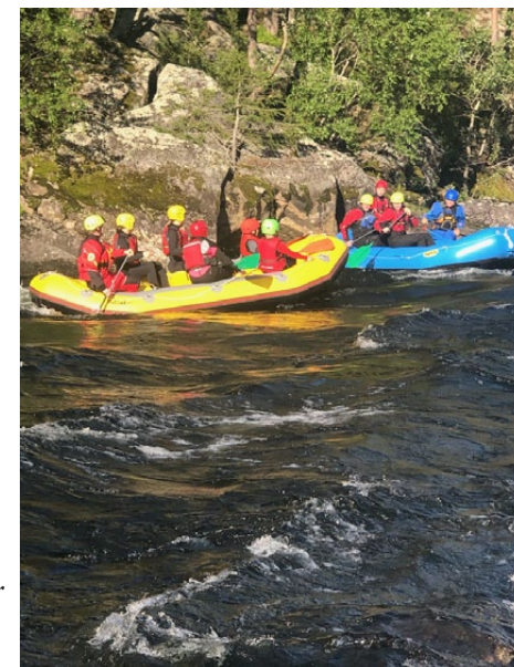
Hvert år inviteres det til spennende tur på Begna elv.

Barnas Turlag og DNT Ung Valdres inviterte til flåteferd på Begna for alle som ville se vakre Sør-Aurdal fra en helt ny vinkel. Turen startet ved Leite sør for Bagn. Det ble padlet gjennom noen kortere stryk og flate partier før vi endte opp ved Fønhus 7 km lengre ned i elven. Flere av deltakerne benyttet anledningen til å bade i elva undervegs.