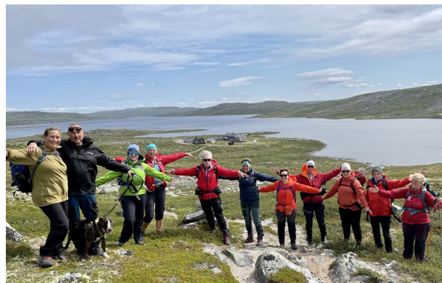
Herlig turterreng, her med Krækkja i bakgrunnen.

Lørdag gikk turen til Larsbu og videre opp til Blåfjell, med lunsj i lyngen. På ettermiddagen kom et skikkelig regnskyll, men da var vi heldigvis trygt i hus.