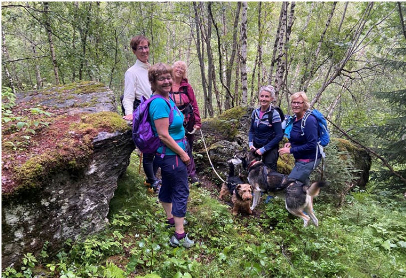
Ved steinene med offergroper.