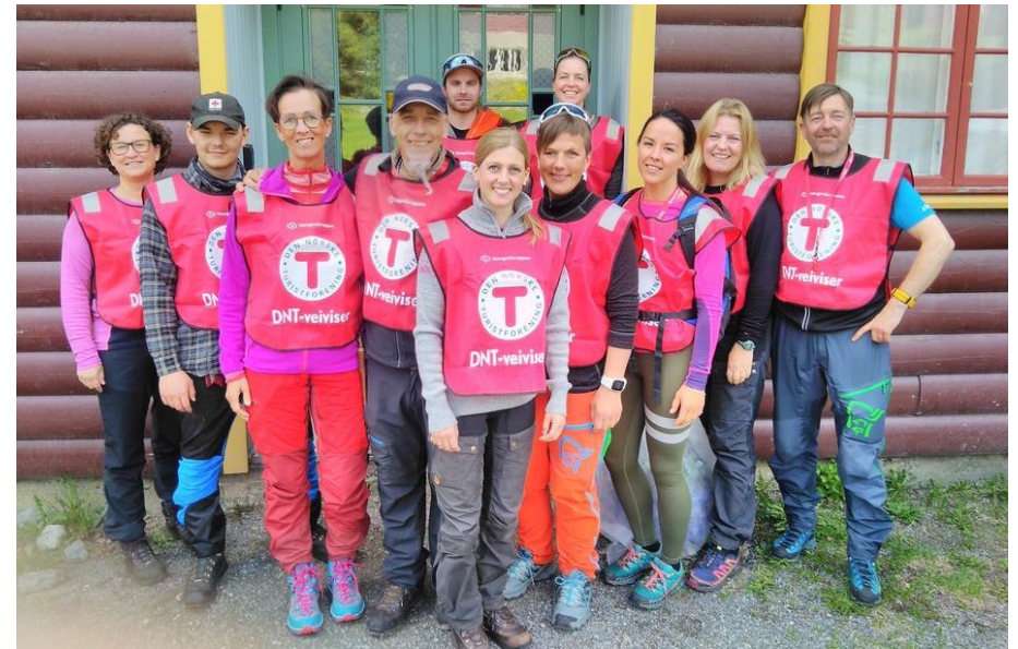
Ein fin gjeng som har fullført turleiarkurs.

Den årlege «Kremtoppjakta», med 12 utvalde turmål rundt om i Valdres, hadde sin forsiktige start i 2015. Responsen var utruleg, i 2018 vart nesten 26.000 namn notert i bøkene. Oppfylte krav blir premiært med gratis krus, i tillegg har Sport I på Leira gjeve nokre flotte uttrekkspremiar kvart år – tusen takk!