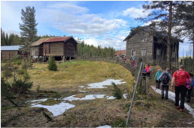
Det var harde kamper her i april dagene i 1940.