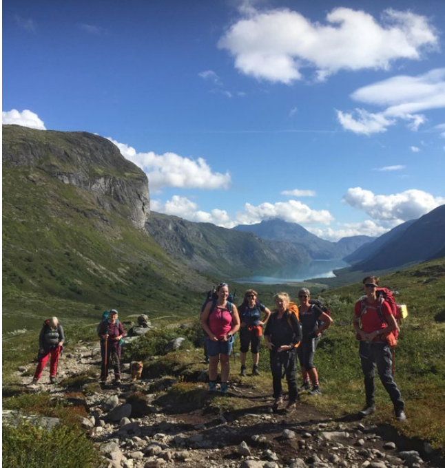
På vei opp Veslådalen, med utsyn mot Gjende.