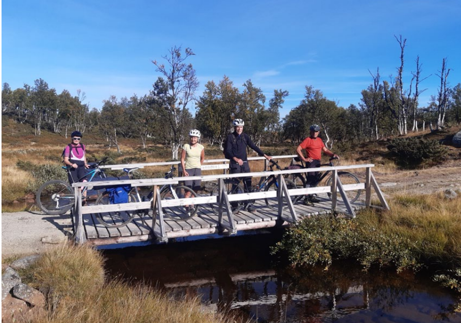
På brua over Fjelldokka, på retur mot Etnstølen.

I det fine været gikk tida frå oss, så vi droppa avstikkaren vidare opp til Massingholet og starta på heimveg langs same rute som framturen.