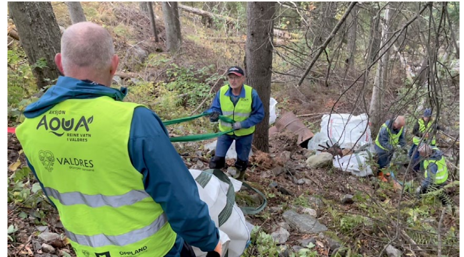
Store og små rydder, bl.a. ved Nordåkselva.