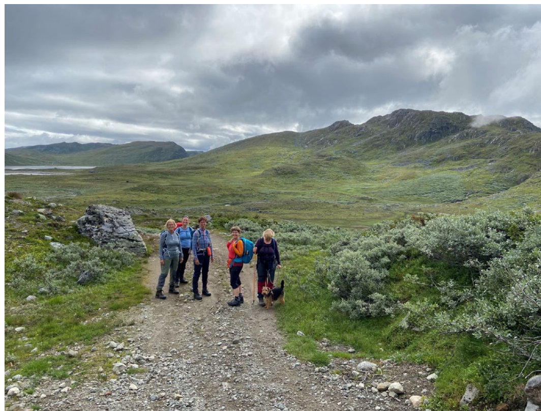
På anleggsveien mot Øyangen, Horntind bak t.h.