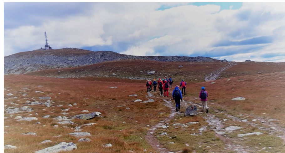
I godt driv mot toppen av Spåtind.

Tilbaketuren gjekk omtrent langs same rute, og vi hadde god tid til ein dusj før middag. På kvelden fortalte vertskapet litt om historia til Liomseter.