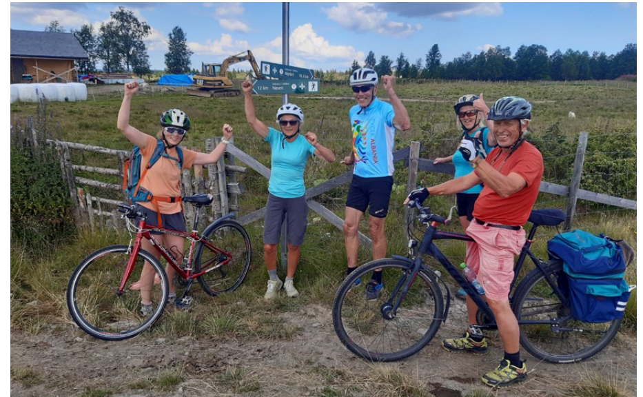
Stopp ved Tyrisholt.

Det vart mange stopp undervegs for å nyta den flotte naturen. På Langestølen hadde vi lang matpause, og fekk servert nysteikte vaflar og kaffi. På Tyrisholt stoppa vi for å informere om den ubetente hytta som DNT Valdres leiger der, og om den 70 kilometer lange fotturruta «Stølsruta i Valdres» som laget har vore med å opparbeide. På Valtjednstølen hadde vi ein ny matpause.