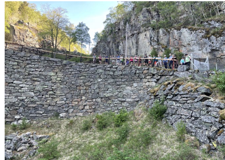
Imponerende vegkunst i Vindhella.