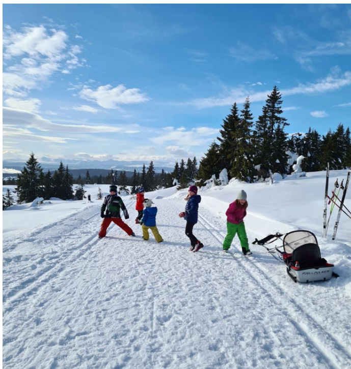
Herlege tilhøve for aktive ungar.