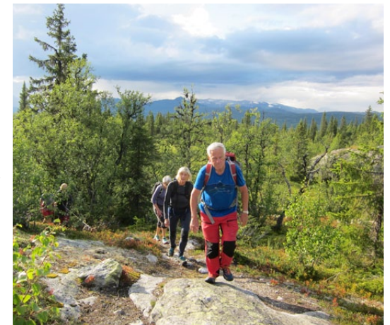
På stien mot Storberg.