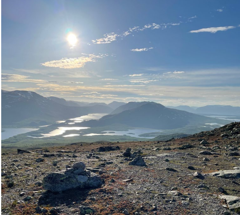
Fantastisk utsyn mot vann og fjell.

Turen gikk videre i lettere kupert terreng mot Grønsennknippa. Vi gikk og ventet på sola, som var lovet å komme, og den kom. Mot toppen kom sola godt frem og vi fikk se sola inn over Helin og videre mot Jotunheimen. Denne utsikten kunne vi nyte mens vi spiste kveldsmaten vår. Veldig trivelig tur!