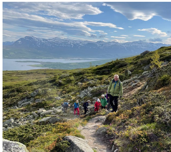
På god sti, med Skogshorn langt bak.