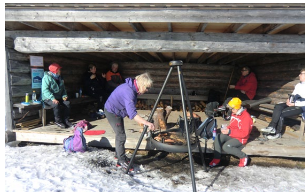
Hyggelig matpause i gapahuken nedenfor Skardåsen.