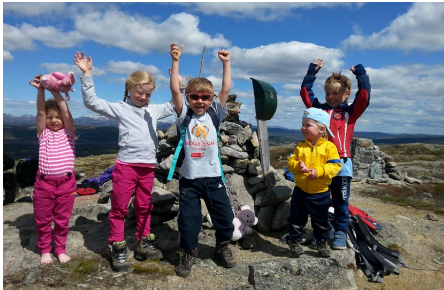
Barnas Turlag var særst aktive heilt frå starten.

Alt hausten 2011 vart det stifta undergruppe for Barnas Turlag (BT), og året etter vart Vang Turlag teke opp som eige lokallag i DNT Valdres. Hausten 2013 vart Seniorgruppa stifta – og i 2017 vart DNT Ung så smått drege i gang.