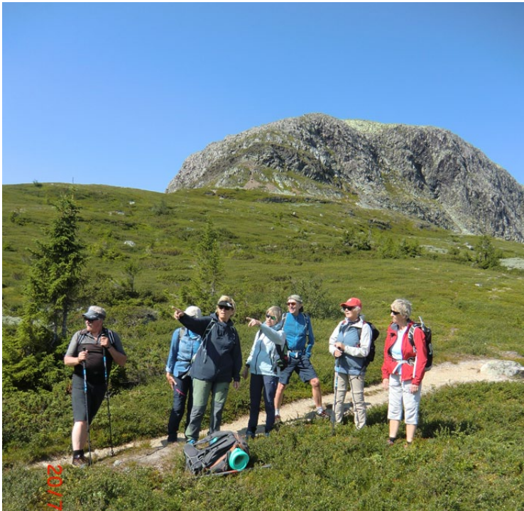
Pause i bakkene med Rundemellen i bakgrunnen.