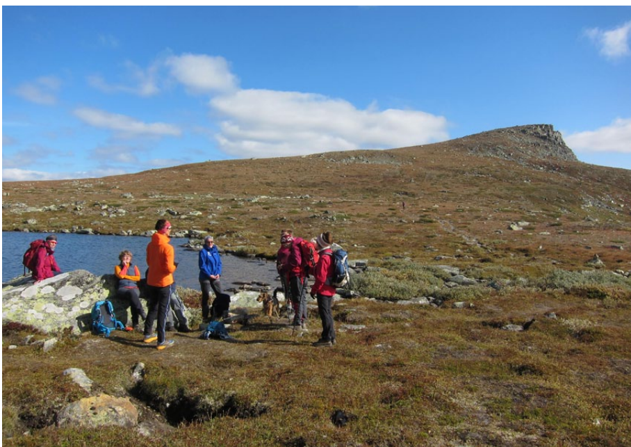
Pause ved Svarthamartjednet før siste rusling mot toppen.