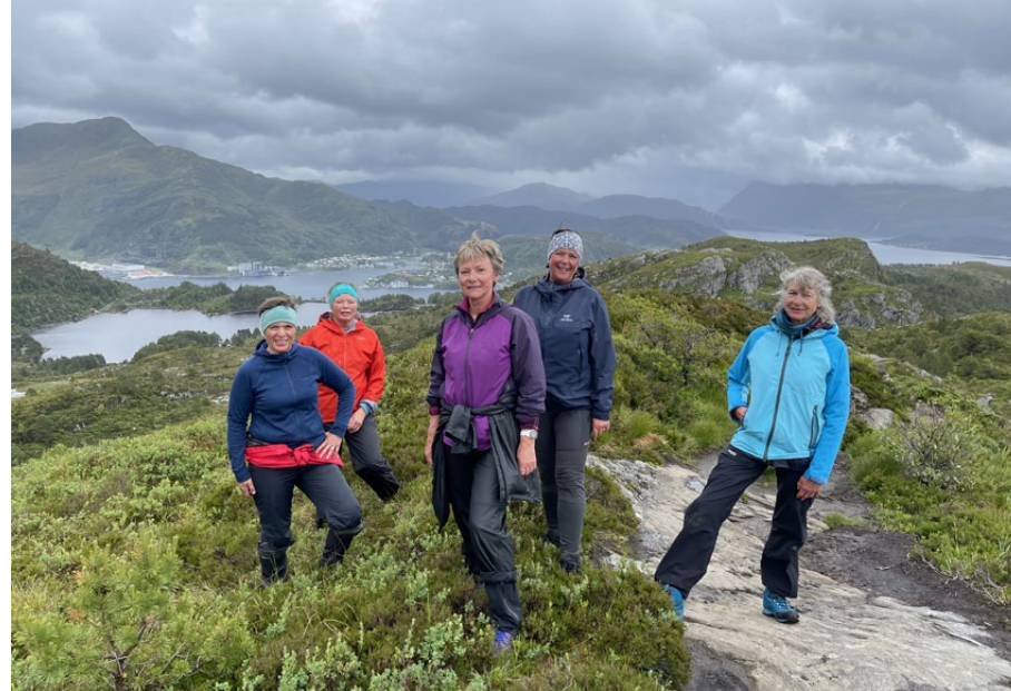
Det ble turer også, selv om været ikke var det beste.