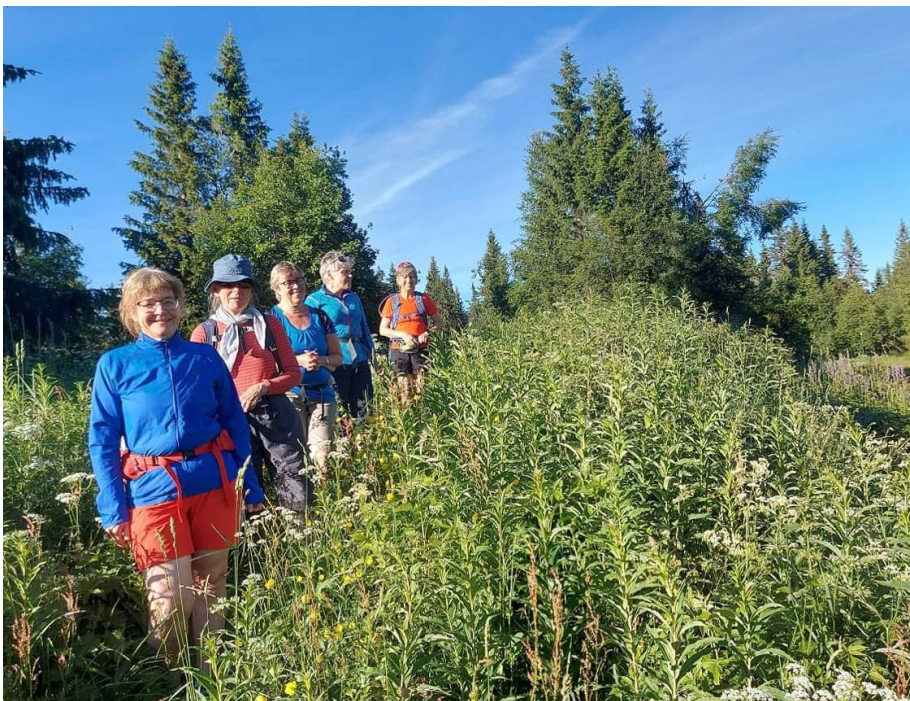
I historiske spor i frodig vegetasjon.