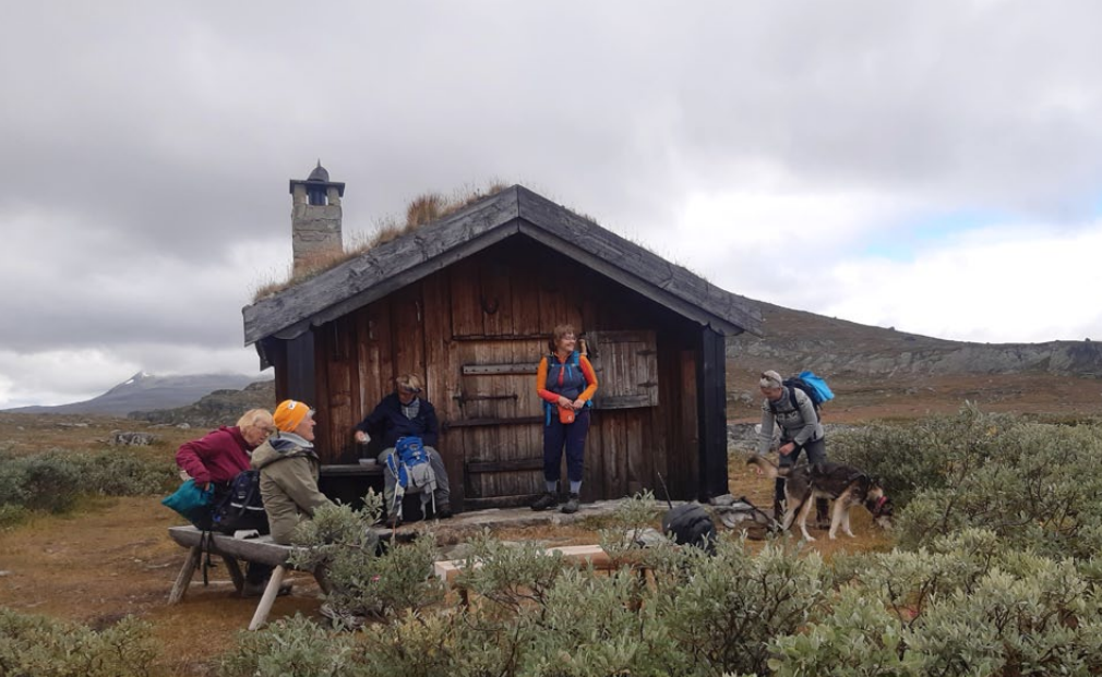
Rast ved fiskebua ved Brurskarstjønne.