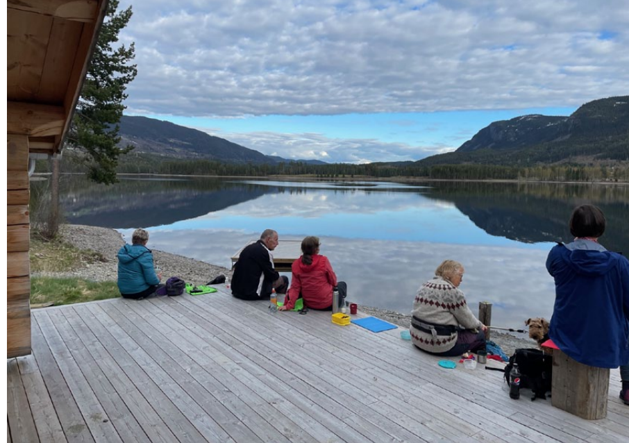
Trivelig med kveldsmat ved Fløafjorden.