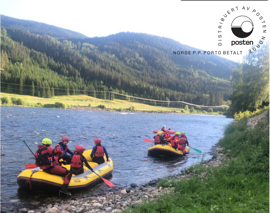
Hvert år tilbyr vi flåteturer på Begna for barn og unge.