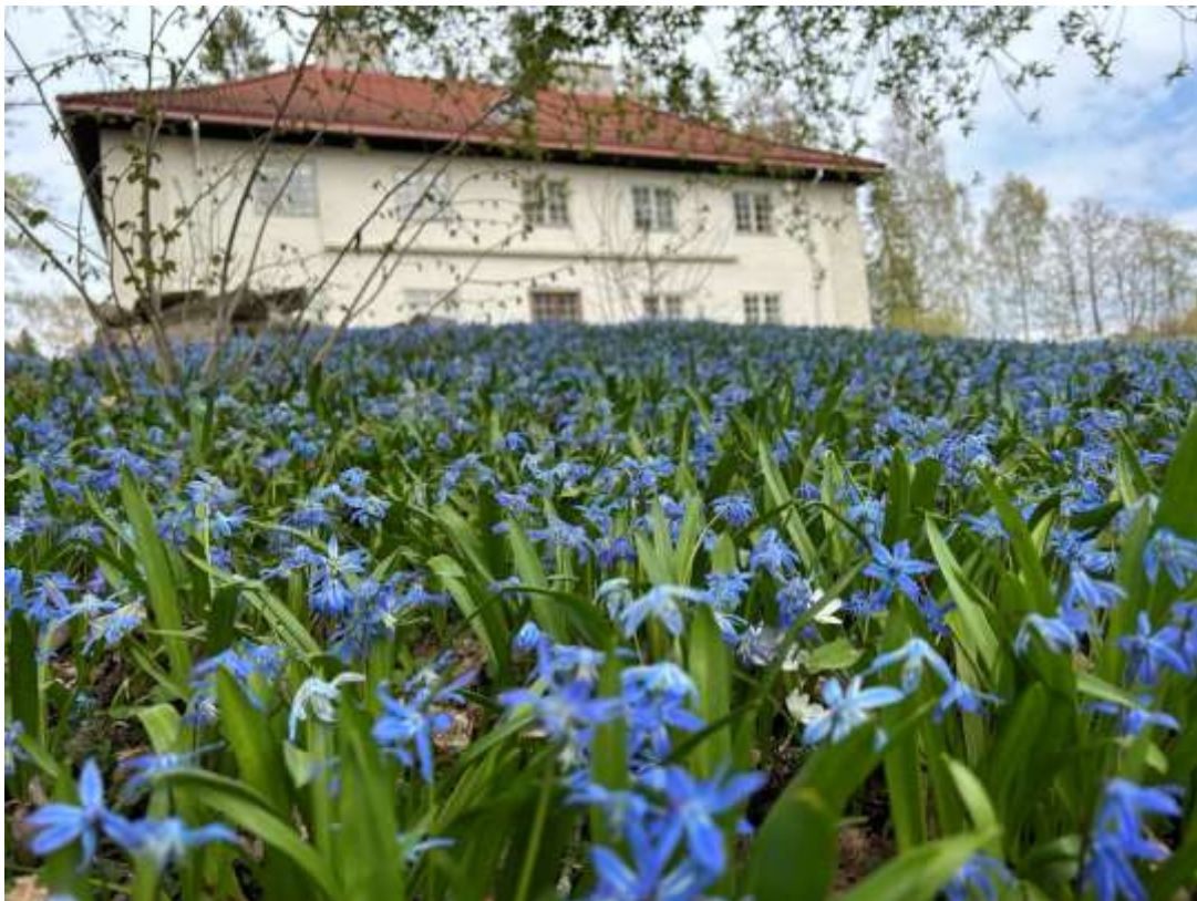
Vår på Naturens hus

Vi har heldigvis ikke hatt noen alvorlige ulykker i 2023.