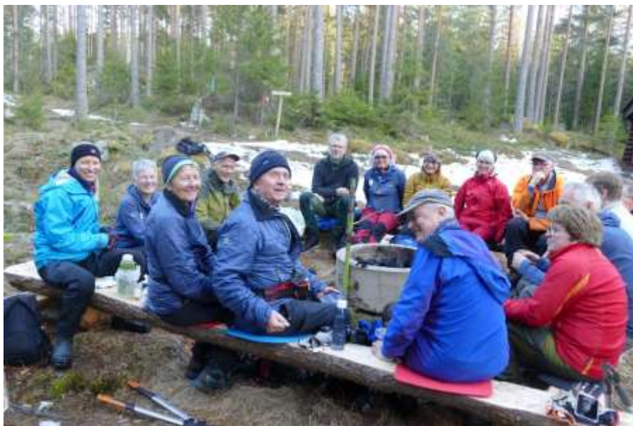
Dugnad i Stange har mange deltakere

Regnskapet for kretsen føres i henhold til felles retningslinjer fra HHT og revideres som en del av regnskapet for HHT.