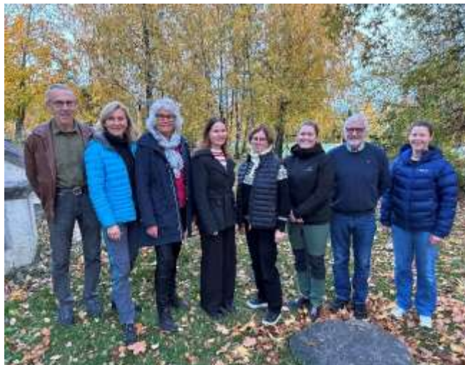
Styret i HHT i 2023