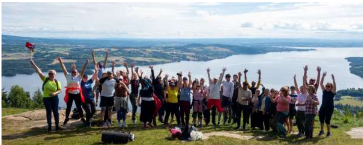
Voksenpedagogisk senter-deltakere på Bangsberget.