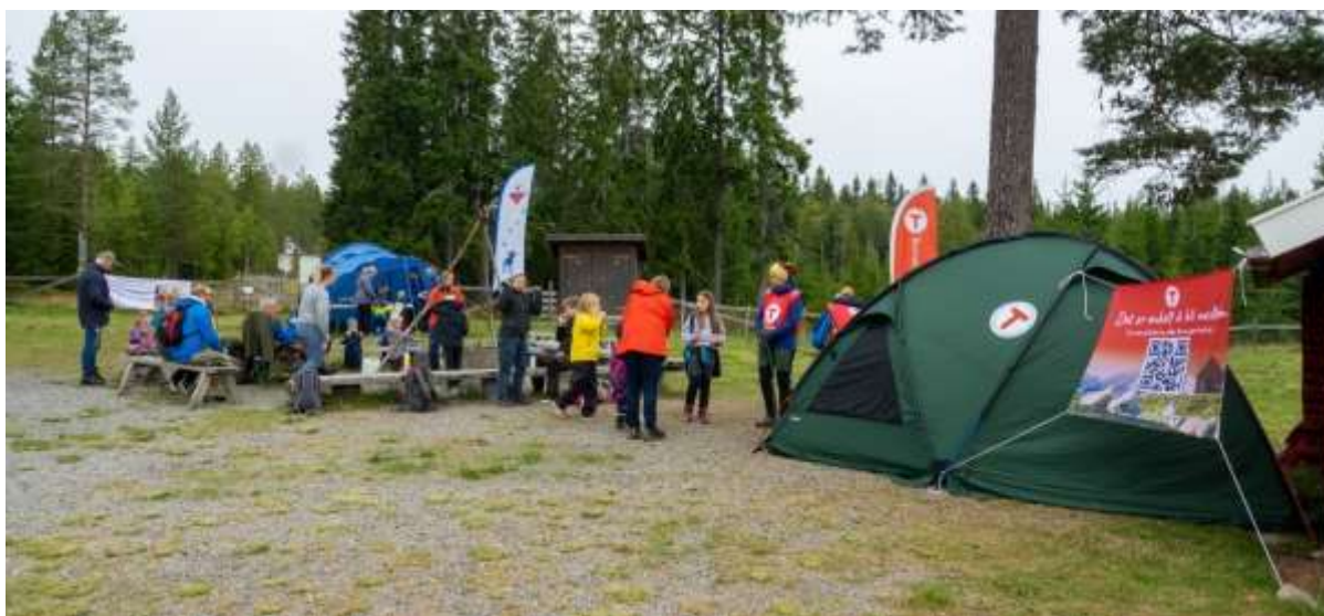
Kom deg ut-dagen på Vollkoia.