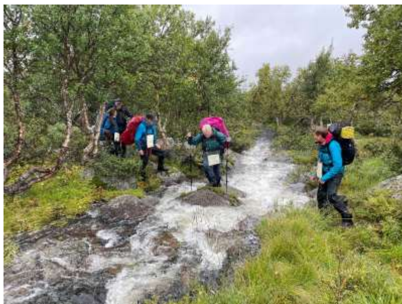
Sommerturlederkurs 2023