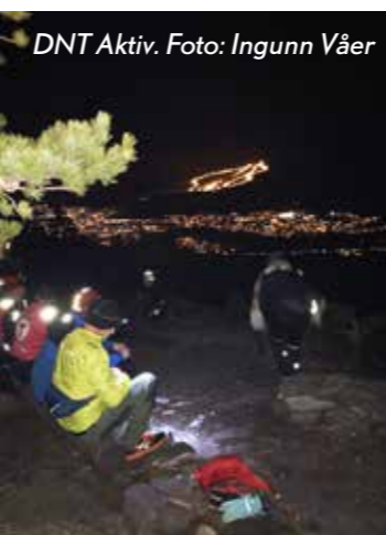
DNT Aktiv.

@ DNT Aktiv - Kongsberg: Siste mandag i måneden møtes vi for å få opp pulsen litt.