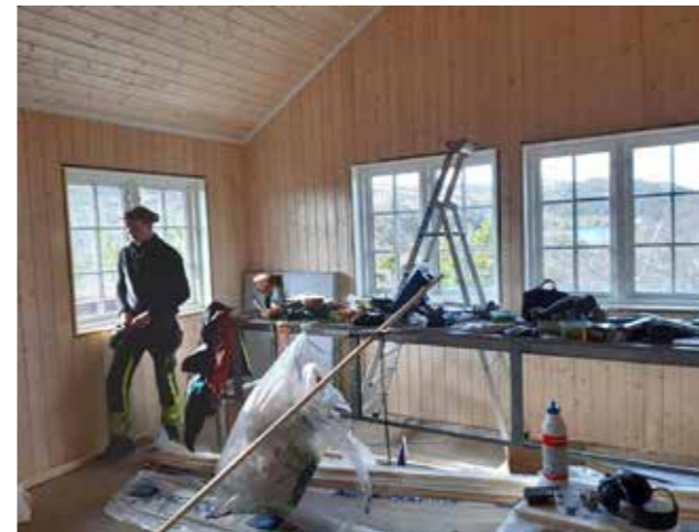
Fra byggeplassen, oktober 2020.

før veien slutter, er det en liten parkeringsplass, og skilt viser til Eriksbu. Vi følger merkinga og får en fin tur forbi Revlivatnet og stiger behagelig i åpent terreng. Når vi er framme ved Eriksbu, har vi gått om lag 6 km og steget 150 meter.