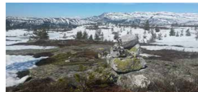
Kransekollstein. I bakgrunnen ser vi mot Gausta og Store-Ble.