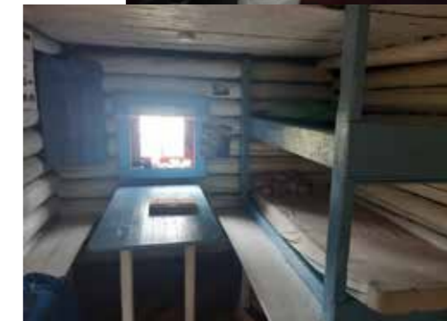
Fossvannskoia, inne og ute.