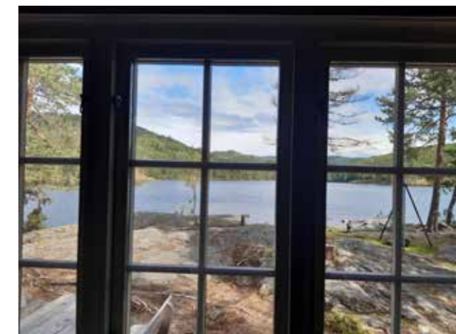
Utsikt fra Hovinkoia.

til Dalabu og videre til Dusehesten. Og er vi først på vei oppover Numedal, er det jo fristende å dra helt inn i Jøndalen til Solheimstulen . Denne tradisjonsrike, betjente hytta er nå overtatt av DNT Drammen og Omegn.