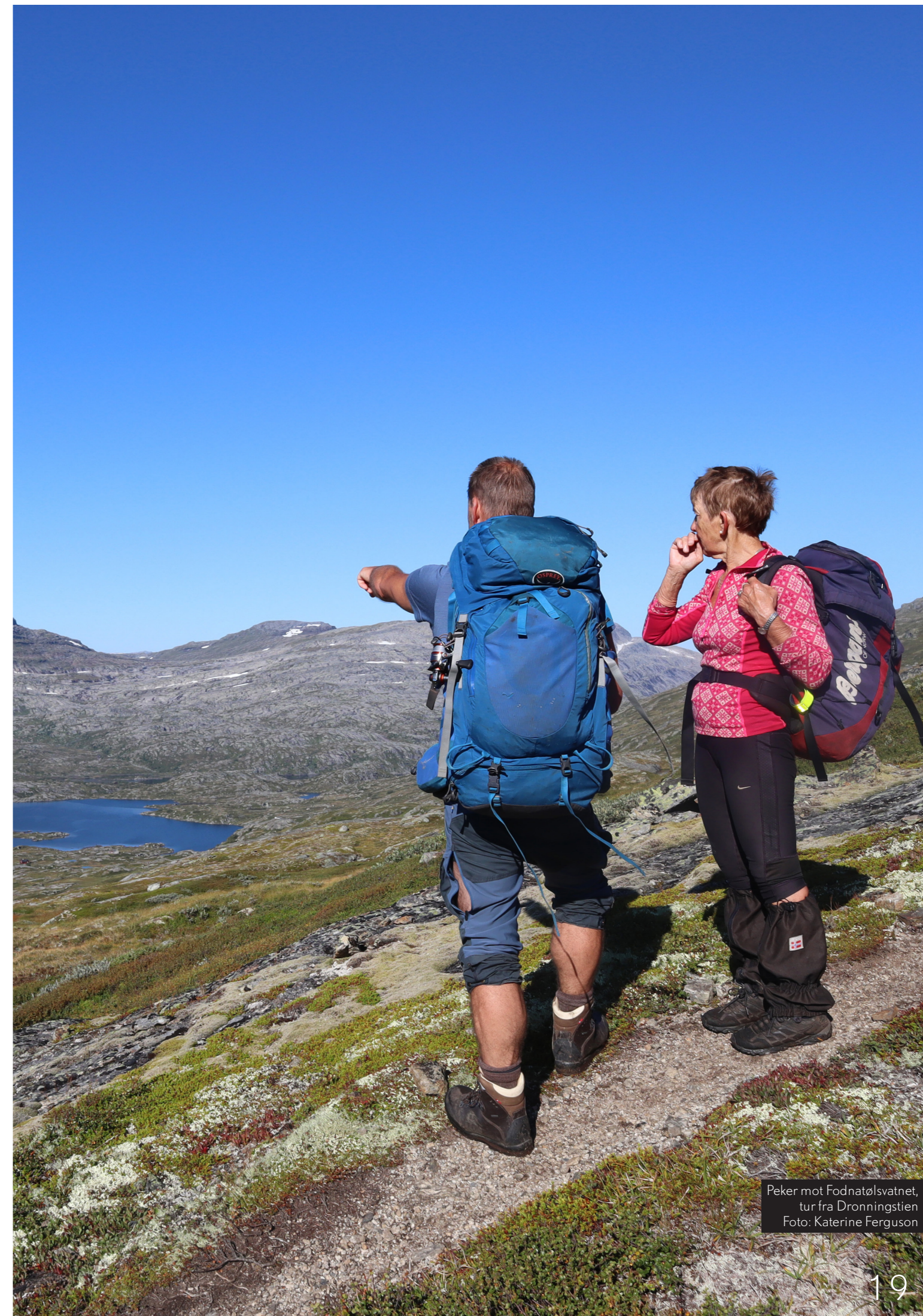
Peker mot Fodnatølsvatnet, tur fra Dronningstien