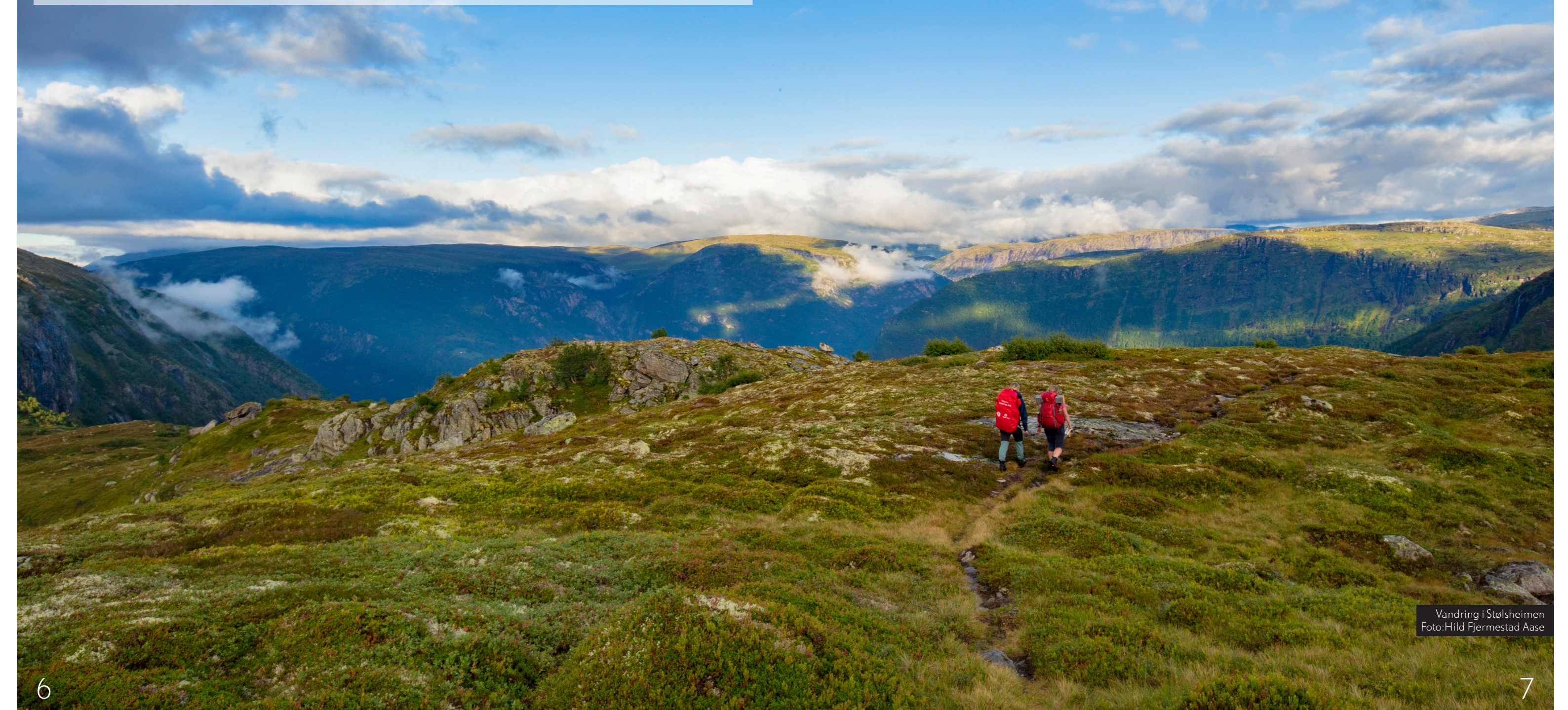
Vandring i Stølsheimen

"DNT foreiningane har ein sentral rolle i friluftslivskulturen i Noreg, og difor skal me også inspirera alle som driv friluftsliv til å redusera sitt fotavtrykk"