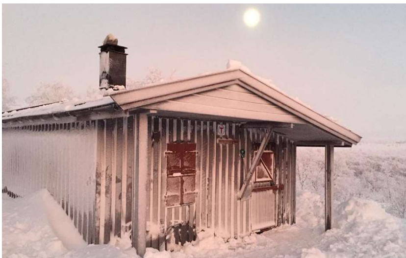
Bojobæskihytta i Stabbursdalen

Reinbukkelvhytta https://ut.no/hytte/101359/reinbukkelvhytta er en åpen dagsturhytte, og har to brisker som til nød kan brukes til overnatting. Det er ikke mulig å forhåndsbookehytta. Alternativt, ta med telt.