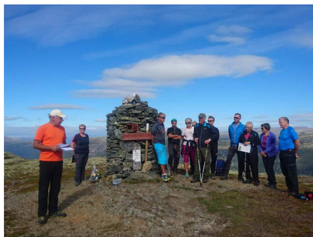
Kom deg ut-dagen i Sel, som ble arrangert i samarbeid med Sel kommune og utdeling av kulturprisen som gikk til stigruppa til Dahle vel