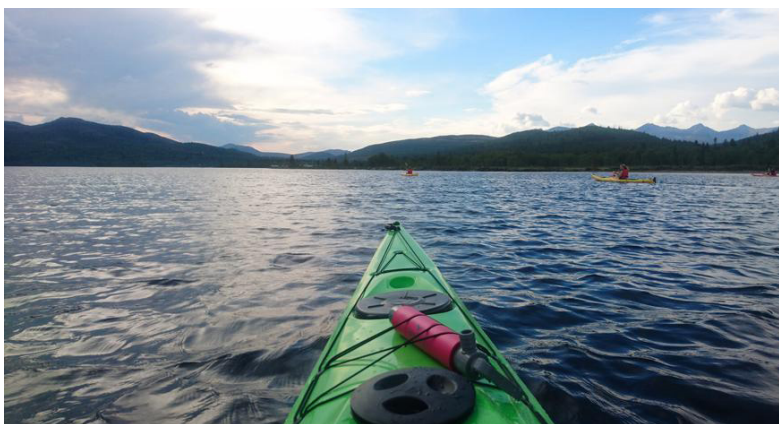
Padlegruppa møtes jevnlig for å padle, og kajakkene til DNT Gudbrandsdalen leies ofte ut.