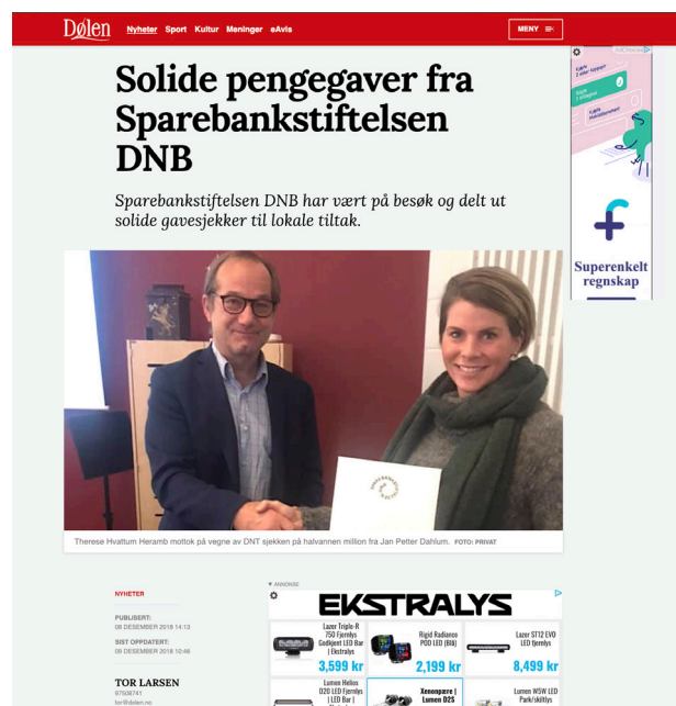
Faksimile fra GD og Dølen.