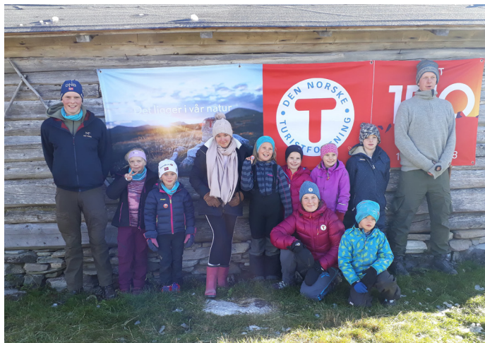
Høstferiecampen var godt mottatt av deltagerne, og vi vil utvikle arrangementet videre.