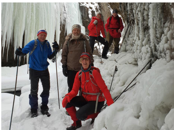
Seniorgruppa har ukentlige turer nesten hele året. Her fra Storfallet i Tromsø i januar 2019.

To turer i år ble plukket ut som GD-tur, og dette var Tur til Lorkverna og Kulturstien og Jubileumsturen til Muen med Nils Øveraas.