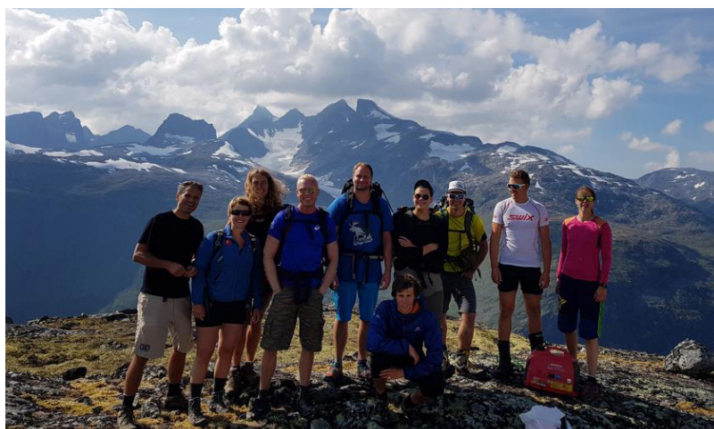
På tur med Lars Monsen i Jotunheimen. Mange tunge bærer for å få logistikken med live TV til å gå opp.

DNT Gudbrandsdalen har økt aktivitet på sosiale medier. Facebook brukes til å promotere turer og aktiviteter og kommunikasjon med folk. Vi har jevn aktivitet på Instagram, og det er mange som bruker #dntgudbrandsdalen.