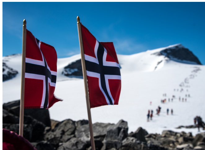
Med strålende vær og jubileumsår var det rekordmange på Galdhøpiggen 17. mai.

vellykket arrangement som vi vil utvikle videre. Det ble kjøpt inn litt utstyr til videre bruk for slike camper, dette og godtgjørelse til ledere ble dekket av bidrag fra Gjensidigestiftelsen.