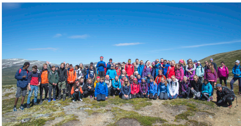
Opptur for 8. klassinger ble arrangert både i Midtdalen og Nord-Gudbrandsdal. Her fra nedturen fra Grønseterhø ved Dombås.

Vi arrangerte Oppturer for 8.-klassinger både for Nord-Gudbrandsdal og Midtdalen.